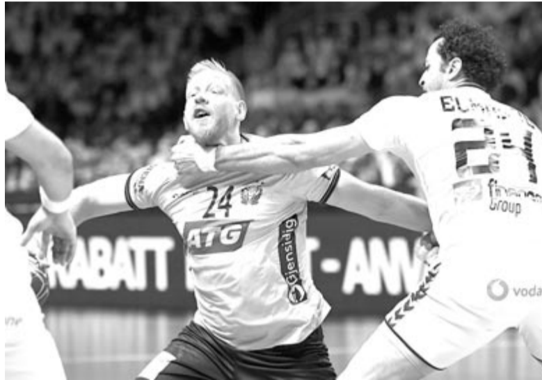
A svéd Jim Gottfridsson (k) és az egyiptomi Ibrahim el-Maszri (j) a kézilabda olimpiai kvalifikációs világbajnokság negyeddöntőjében játszott Svédország – Egyiptom mérkőzésén a stockholmi Tele2 Arénában 2023. január 25-én.

kosának (MVP) 2018-ban és tavaly is megválasztott Gottfridsson a következő két hónapban nem léphet pályára. „Azt hiszem, a kezem beakadt az ellenfél egyik játékosának mezébe. Rögtön fájdalmat éreztem, most pedig borzasztóan elkeseredett vagyok, mert arról álmodtam, hogy hazai pályán vb-döntőt játszhatok. Rendkívül nehéz most nekem, de mindent megteszek, hogy a továbbiakban is támogassam a csapatot” – nyilatkozta Gottfridsson.