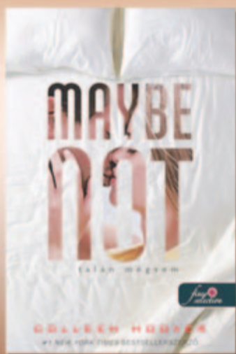
Colleen Hoover Talán mégsem