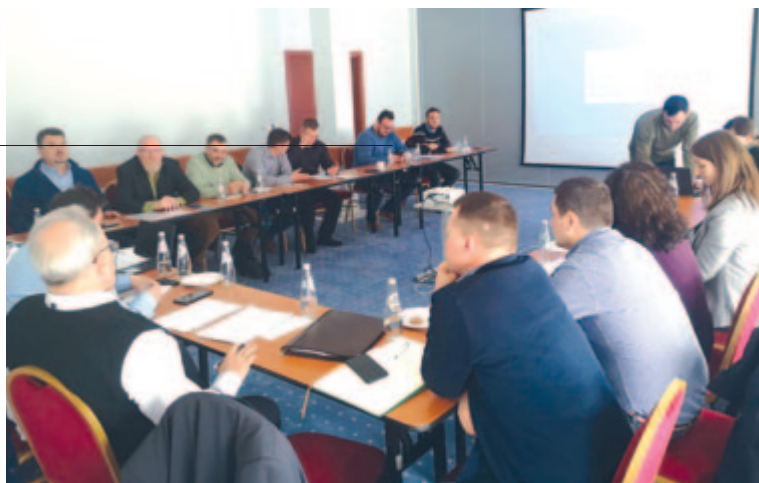
Elkészült a falugazdászok évi terve

A rendezvényen Barabási Antal Szabolcs államtitkár ismertette az országos mezőgazdasági terv fontosabb irányelveit, és válaszolt a falugazdászok kérdéseire, felvetéseire is. Az egyesület szakemberei elkészítették a stratégia kivonatának magyar változatát, amely elérhető a www.szekelygazda.ro honlapon – tájékoztatott Cilip-Szilágyi Dalma Orsolya, a szervezet sajtóreferense.