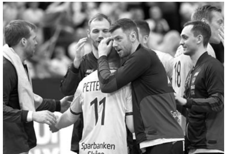
A svéd válogatott ünnepli győzelmét a férfiekézilabda olimpiai kvalifikációs világbajnokság középdöntőjének harmadik, utolsó fordulójában játszott Svédország – Portugália mérkőzés végén a göteborgi Scandinavium Arenában 2023. január 22-én