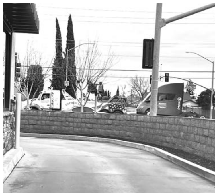
A lerobbant Tesla Semi