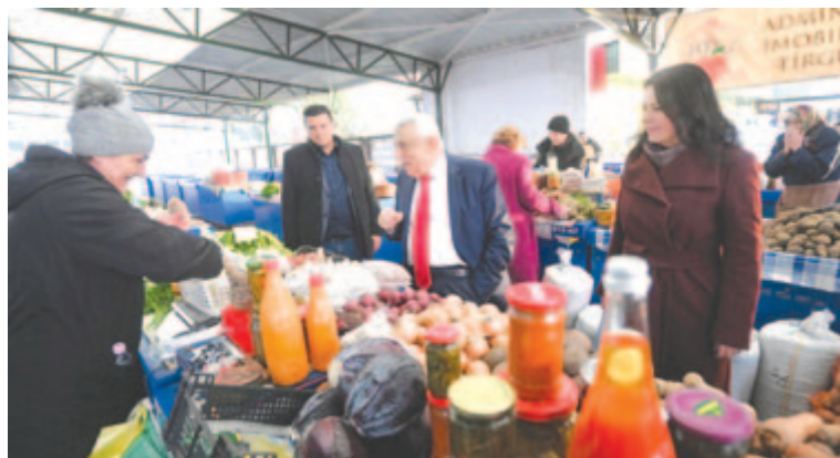
Petre Daea miniszter (középen) a marosvásárhelyi piacon.

Hosszas tárgyalások és egyeztetések után az Európai Bizottság 2022. december 7-én fogadta el az ország mezőgazdasági stratégiáját, aminek alapján Románia a 2023–2027-es uniós finanszírozási időszakban 15,8 milliárd euró uniós támogatást fordíthat a mezőgazdasági és vidékfejlesztésre. A dokumentum 1900 oldalból áll, és leszögezi mindazokat az irányvonalakat, feltételeket, illetve a konkrét támogatási programokat, amelyek alapján az EU által rendelkezésünkre bocsátott európai mezőgazdasági hitelkeretből és az európai mezőgazdasági és vidékfejlesztési hitelkeretből támogatják majd a hazai mezőgazdaságot. 89 mezőgazdasági és 38 vidékfejlesztési programot határoztak meg. A stra-