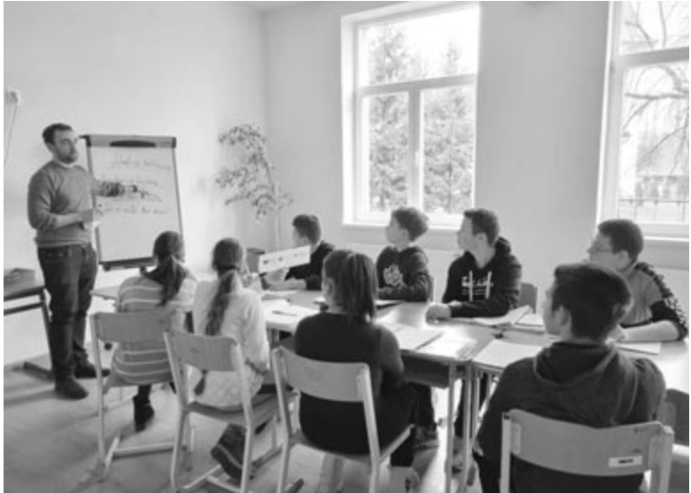
Több tantárgyból van felzárkóztatás, főleg a vizsgatantárgyakból