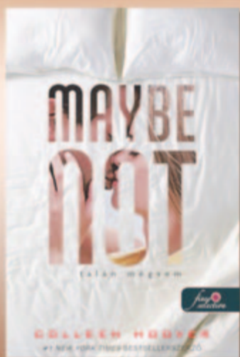
Colleen Hoover Talán mégsem