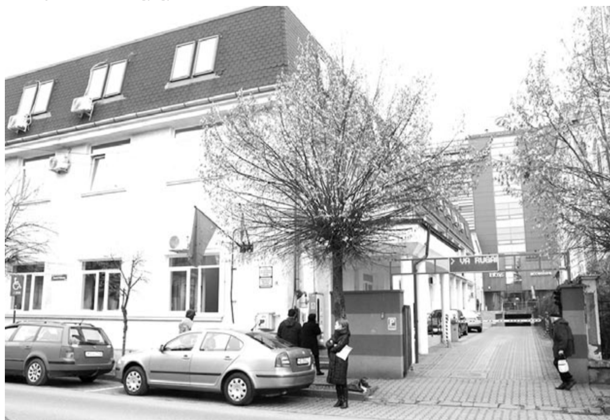
Az egészségbiztosítási pénztár épülete Marosvásárhelyen