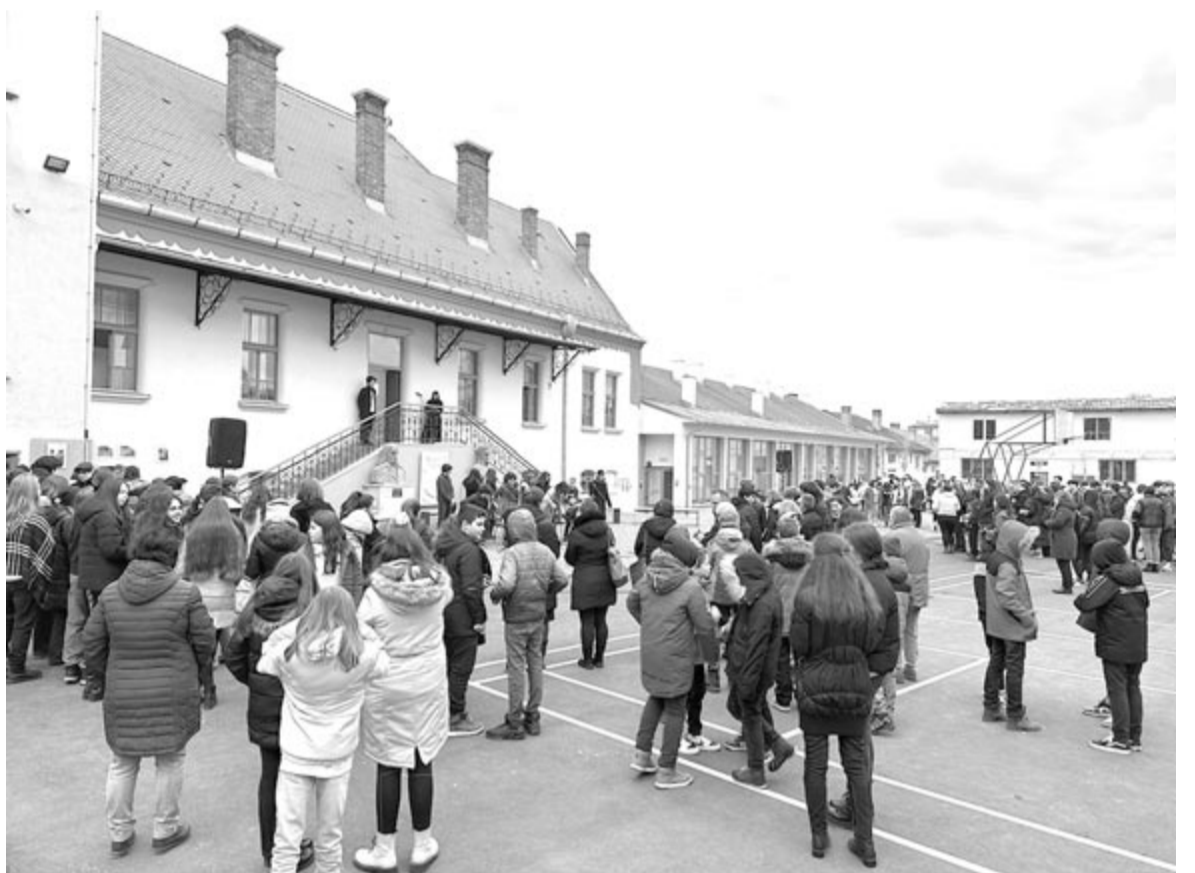
A megnyitóra összesereglett diákok