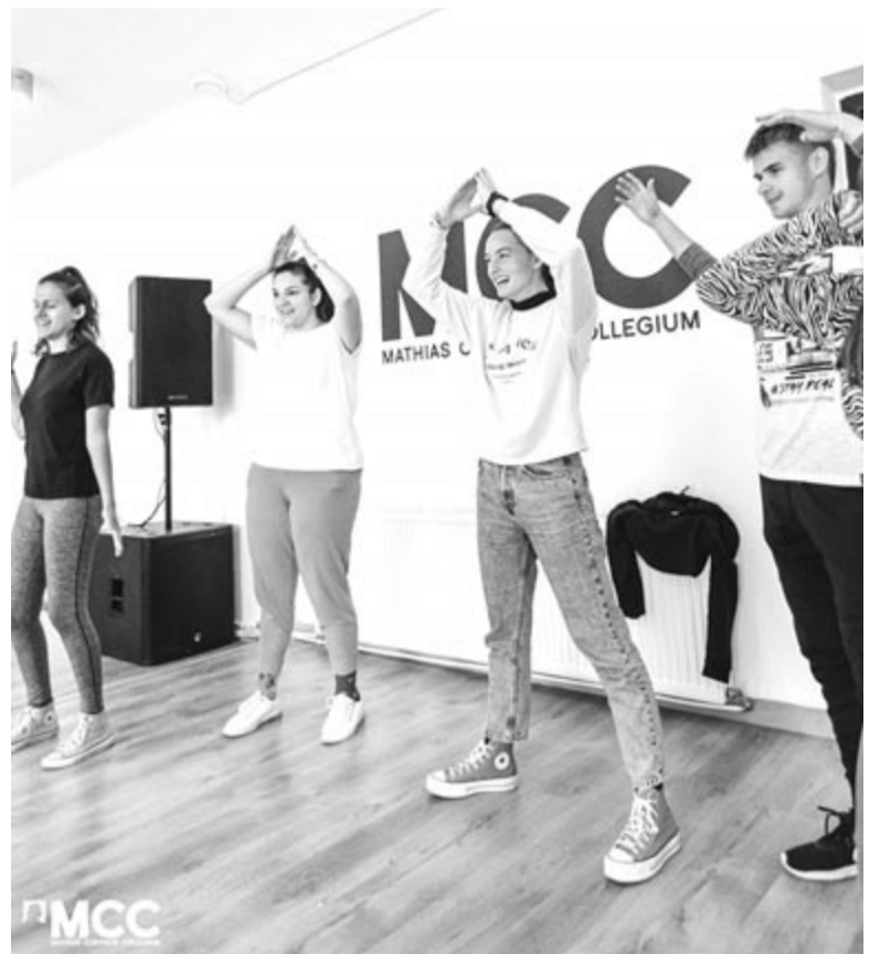
Középiskolás Program, délutáni csapatépítő tevékenység