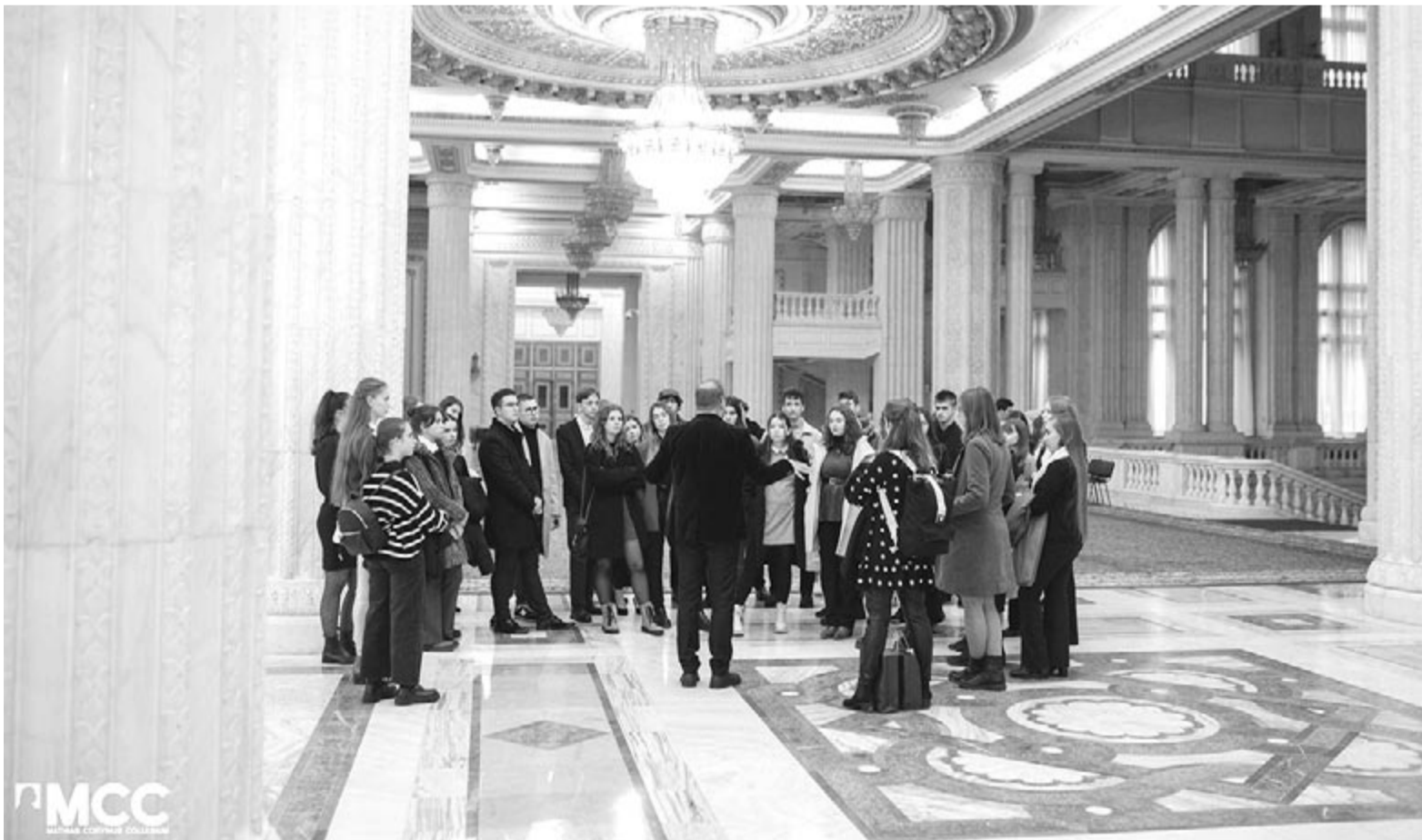
Középiskolás Program – KP+ túsár