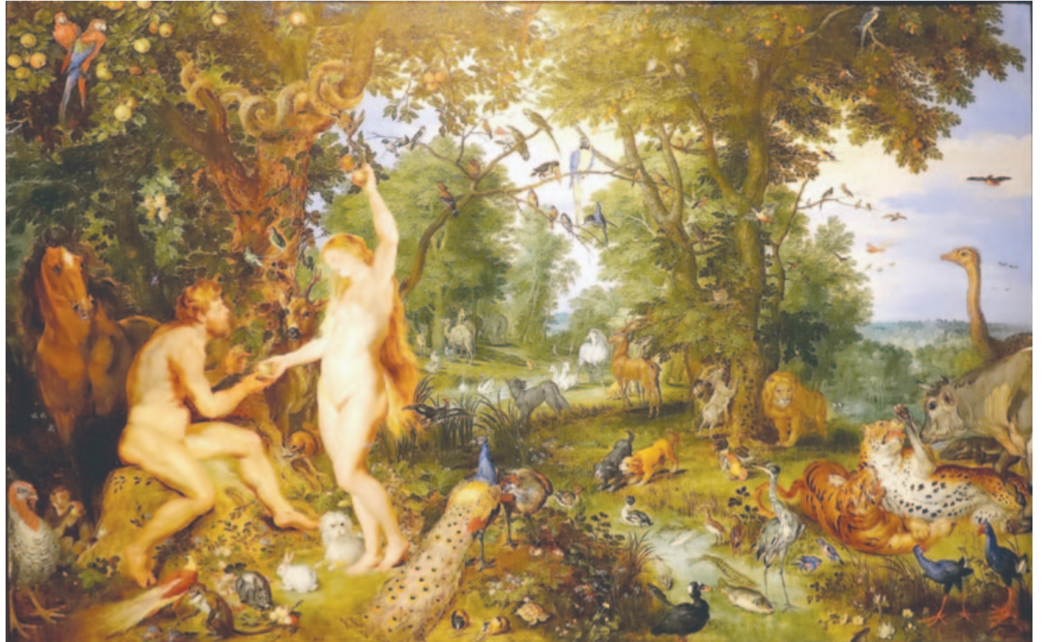
Id. Jan Brueghel & Peter Paul Rubens Ádám és Éva a paradicsomban, 1615

Gyakran előfordul a havazástalan évkezdéskor, hogy a lehülő levegő nem tudja tartani harmatterhét, zúzmarásodik minden. A tiszta légtengeren ilyenkor látni a legmesszebb. Akár a Bekecsről, akár a csergedi tetőről, néha még a Somostető Nagyhegyszőlő felőli erdőnyiladékból nézve is naplementekor a