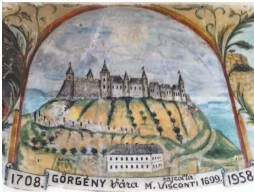
Freskórészlet Visconti képe alapján

A három öl magasságú közfalban lévő ókapunál láncos felvonóhídon lehetett a várba bejutni. A kapuközben álló „ágasra” kötve csüngött a jelzést adó rézhang.