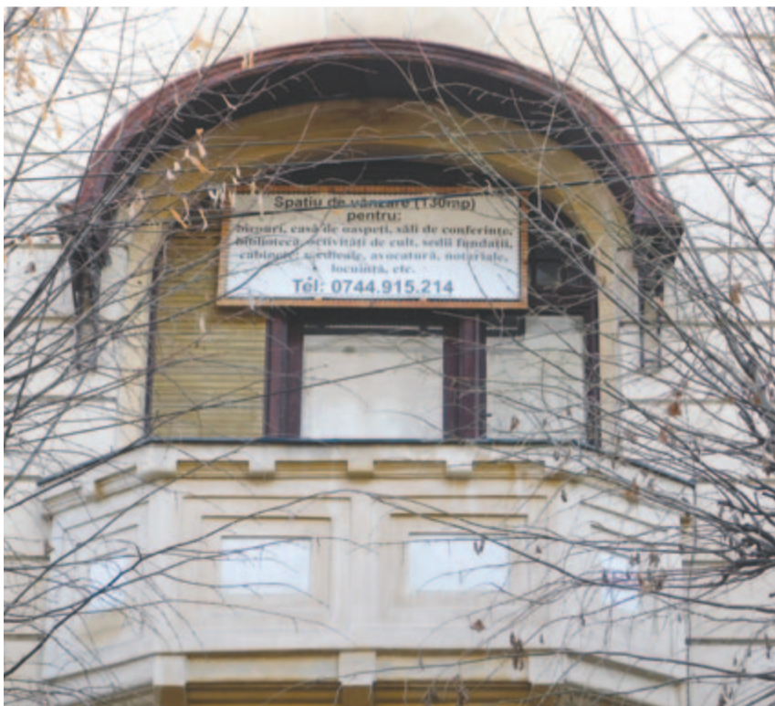
A bejárat fölötti erkély