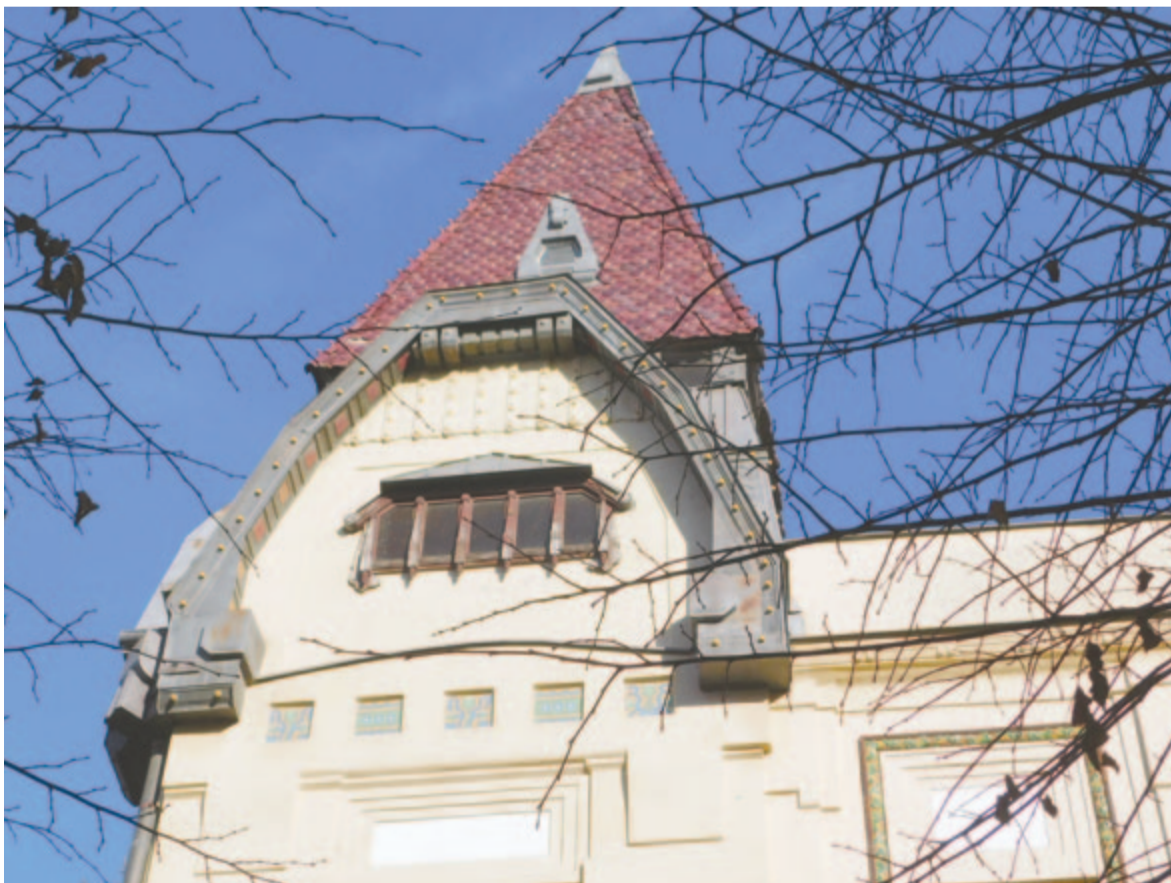
A vörös csempével fedett tornyok egyike