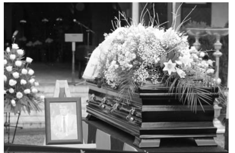
Mészöly Kálmán ravatala a budapesti Farkasréti temetőben

Az egykori Európa-válogatott Vasas-legendát november elején kritikus állapotban szállították a János Kórház belgyógyászatára, ahová tüdőgyulladás, keringési rendellenességgel és fertőzéssel került be. Később elkapta a koronavírus, majd november 21-én szívelégtelenség következtében hunyt el.