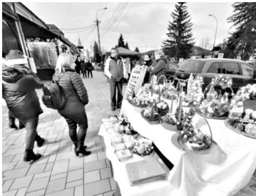
Két hétvégén tart a szeredai karácsonyi vásár