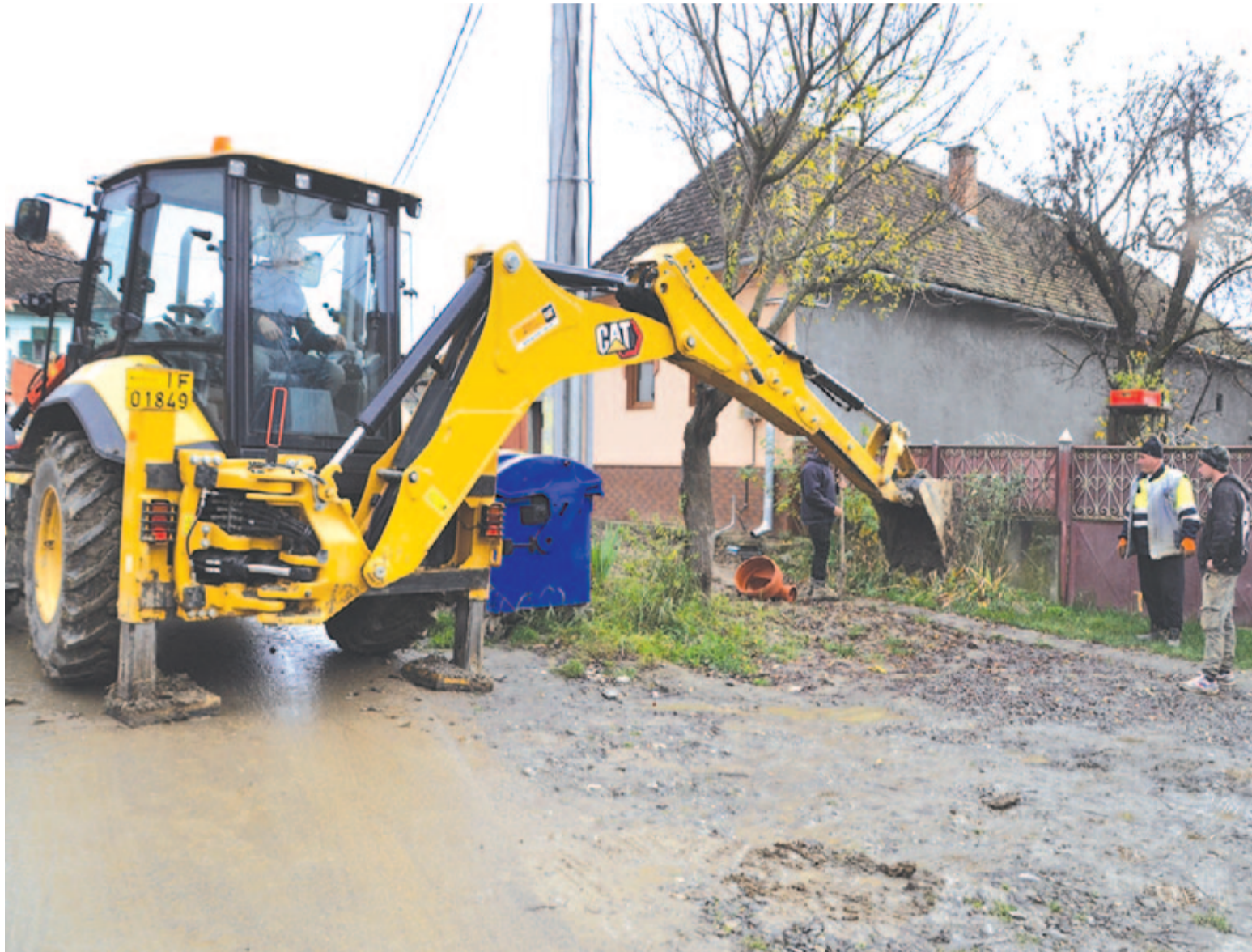
Gyulakutai Népszás a 6. oldalon