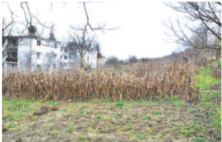
Ide tervezik a sporttermet

Október közepén közölte az RMDSZ, hogy a fejlesztési minisztérium támogatásával Gyulakután új sportkomplexumot építhetnek. A tervek szerint a jelenlegi futballpálya területén egy természetes gyepel, öntözőberendezéssel rendelkező, világítótestekkel felszerelt, öltözőkkel ellátott, standard méretű labdarúgópálya lesz, mellette egy 320 férőhelyes lelátóval.