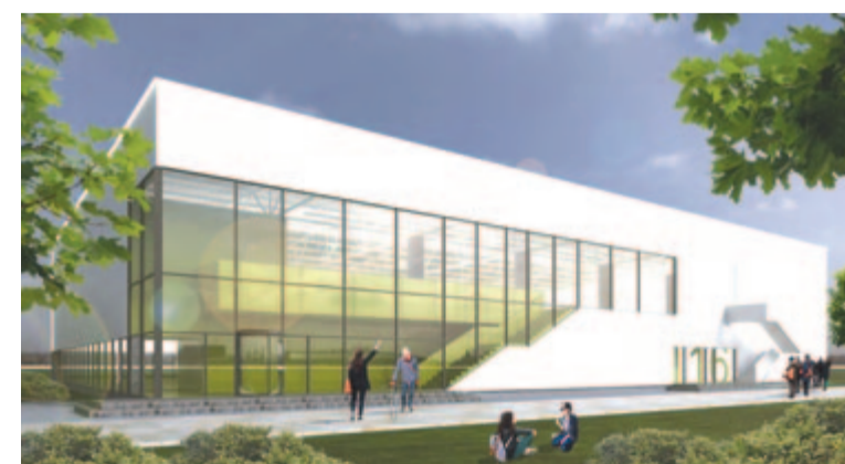
A sportterem látványterve

Mivel a pályázat nem tartalmazza a fedett sportterem építését, a hivatal egy ilyen létesítményre is pályázik. A fejlesztési minisztériumhoz fordultak egy standard, 150 férőhelyes lelátóval rendelkező sportcsarnok építésének finanszírozására. Az épületet az ún. német tömbházak mögötti, mintegy 1,4 hektáros közterületen építenék fel. A polgármester azzal érvelt a döntéshozóknak, hogy valamikor intenzív sportélet volt a községben, ahonnan nemcsak élvonalbeli labdarúgók, hanem olimpiai sportolók is elindíthatták karrierjüket az úszás, birkózás és más sportágak terén. Jelenleg egy, a standardoknak nem igazán megfelelő labdarúgópálya és egy tornaterem van a községben, szeretnék, ha a gyulakutai sport visszanyerné egykori hírnevét.