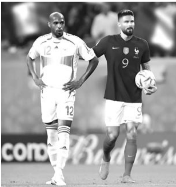
A FIFA World Cup közösségi oldalán közzétett felvételen egymás mellé helyezték Thierry Henryt és Olivier Giroud-t, mivel utóbbi kiegyenlítettte előbbi gólkordját

Tunézia: Damen – Talbi, Bronn, Meriah – Drager (88. Szá-szi), Laidouni (88. Kesrida), Skíri, Abdi – ben-Szliman (67. Sliiti), Dzseballi (80. Kenisszi), Mszakni (80. Mejbri).