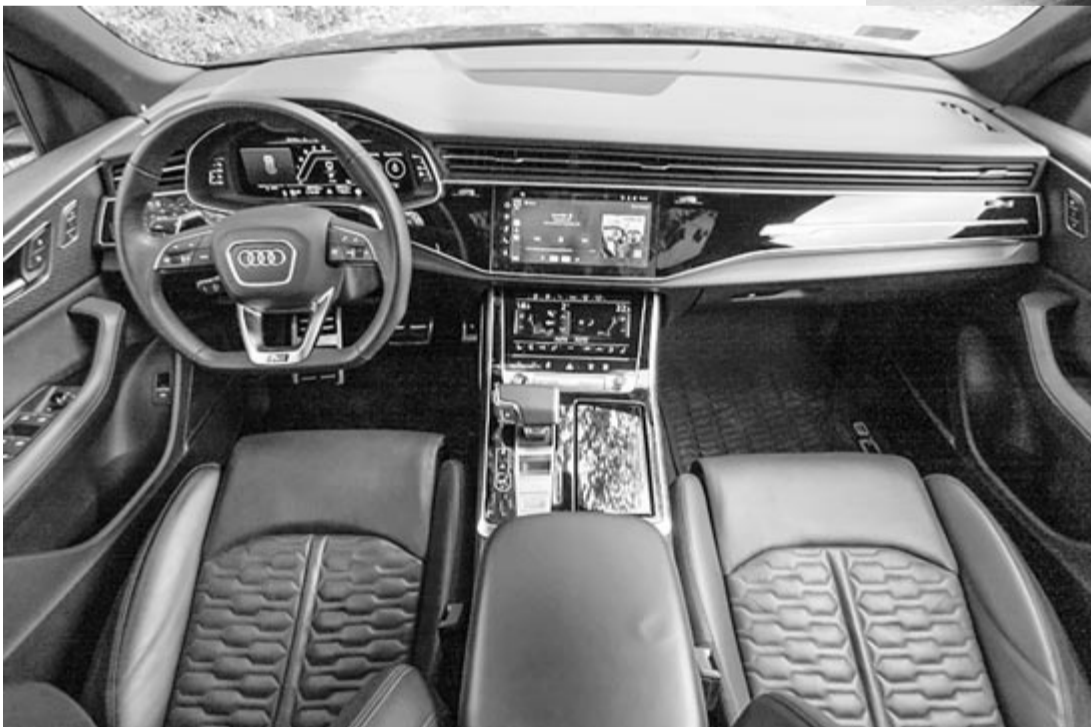
Audi-beltér, a központi kijelzőn kellene megjelenjen a kamera képe

Azzal kapcsolatban nincs információ, hogy esetleg európai modellek tekintetében is jelentkezhet-e valamilyen meghibásodás. Azonban nem szabad szem elől téveszteni, hogy az európai és az amerikai modellek között számos eltérés van, annak ellenére, hogy ugyanazt a nevet viselik.