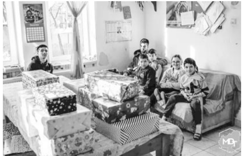
Gyermekek arra várnak, hogy kibonthassák az ajándékukat. A tavalyi gyűjtés eredménye