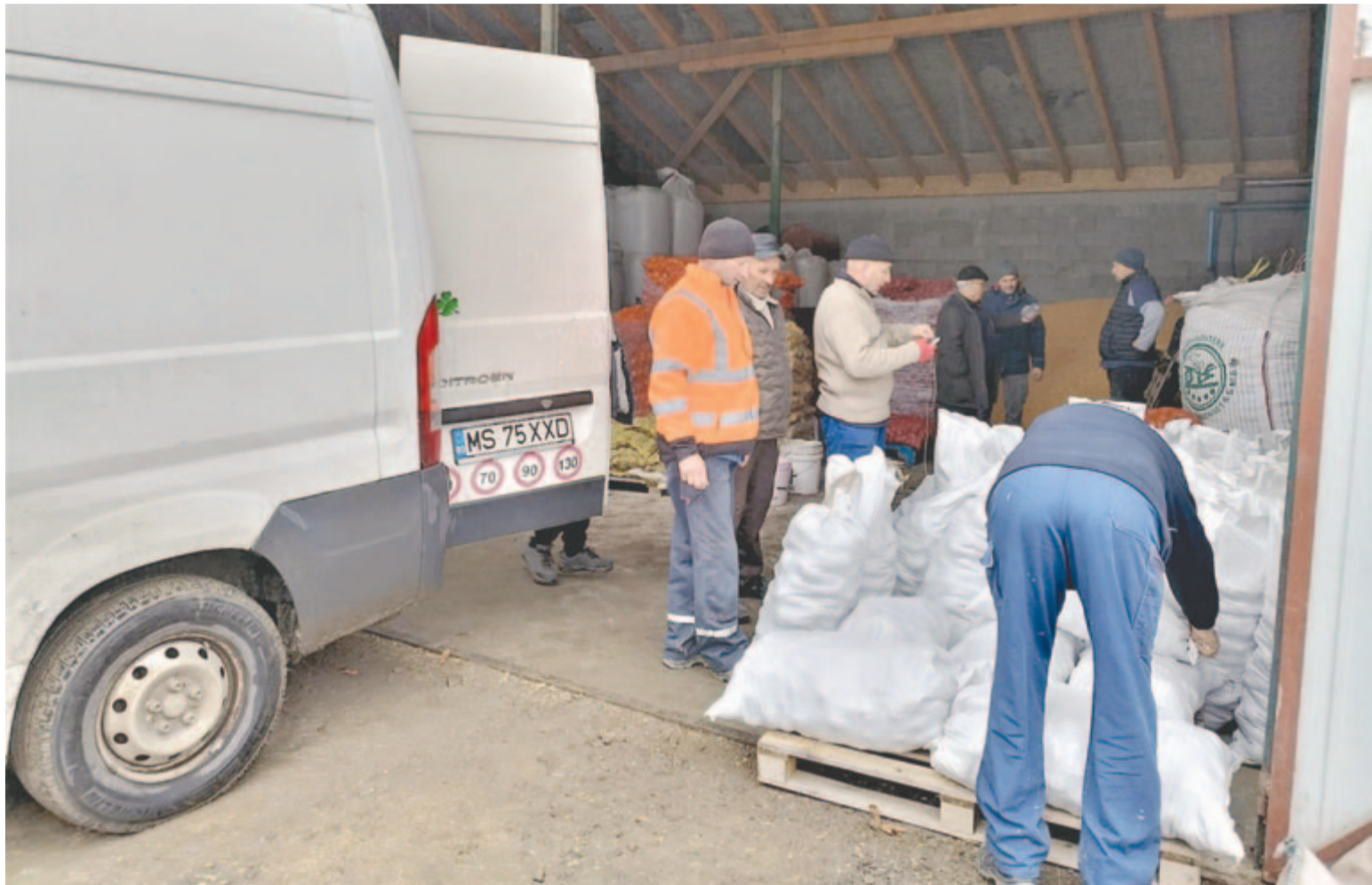
Múlt héten érkezett meg a zöldségrakomány, már szét is osztották

Ne feledje idejében megújítani előfizetését! Ha előfizet, biztosan kézhez kapja, féláron!