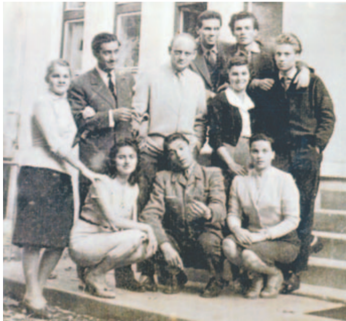
Csoportkép a főiskola udvarán

Az eseményt kultúrpolitikaiak már egy évvel korábban előkészítették: 1961 augusztusában az Állami Székely Színház elnevezést a Marosvásárhelyi Állami Színház név váltja fel, majd a Minisztertanács 1962/484 sz. rendelete alapján a magyar mellett létrejött a román társulat is – az intézmény az új, 1962/63-as évadot már kétfazisú színházként kezdi el. Azok a demográfiai folyamatok, amelyek az ötvenes-hatvanas évek fordulóján ekkor kezdenek kibontakozni a város szűkebb és tágabb környezetében, értelmeztetik ezt a kultúrpolitikai döntést. 1957 őszén tették le annak a vegyipari kombinát az alapkövét, amely a következő évtizedben több ezer, zömében más megyékből áttelepített alkalmazott számára teremtett marosvásárhelyi munkahelyet és lakást. Ekkor zajlik le az a területi-adminisztratív átszervezés is, amely a Magyar Autonóm Tartomány határait átszabva létrehozza a Maros-Magyar Autonóm Tartományt, érzékelhetően módosítva a korábbi etnikai mutatókat.