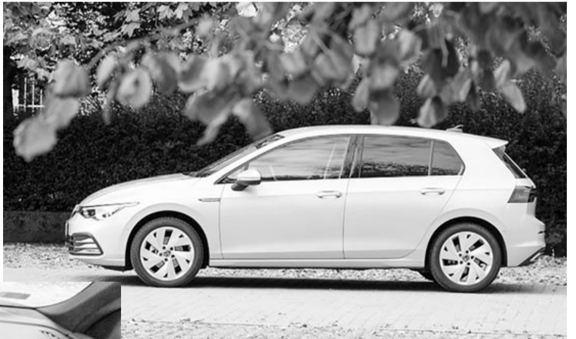
Volkswagen Golf 8, illusztráció

A guminyomás-ellenőrző szenzor esetében a szoftverrel van gond, legalábbis ezt állítja az NHTSA. Elmondása szerint nem reagál elég gyorsan abban az esetben, amikor valamilyen oknál fogva hirtelen történik valami a nyomással. Továbbá olyan helyzetekben is csak később jelzi a problémát, ha valamiért mind a négy kerék elkezd veszíteni a nyomást, ez pedig balesetveszélyes is lehet. Ezért kötelezte a gyártókat az amerikai közlekedésbiztonsági hatóság, hogy orvosolják