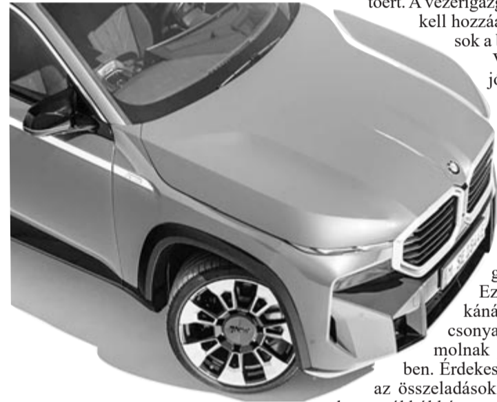
A BMW jövője, illusztráció, BMW XM

Ezzel együtt is a márkánál valamivel alacsonyabb eladásokkal számolnak jövőre, mint 2021-ben. Érdekesség, hogy miközben az összeladások csökkennek, a villanyautókból kétszer annyi fogy, mint egy évvel korábban.