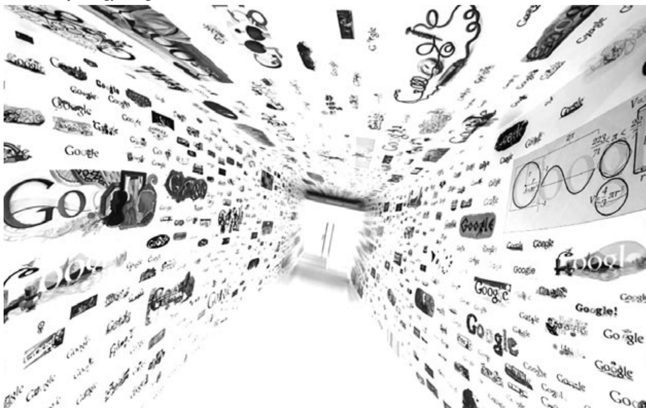
Keresési előzmények, illusztráció

A pert indítók nehezményezik, hogy a Google azt a látszatot kelti, hogy inkognitó módban minden adatgyűjtéstől védve van a felhasználó, holott ez koránt sincs így. Azok a felhasználók, akik vették a fáradságot, és elolvasták az apró betűs részt is, tudhatják, hogy inkognitó módban csak más felhasználó