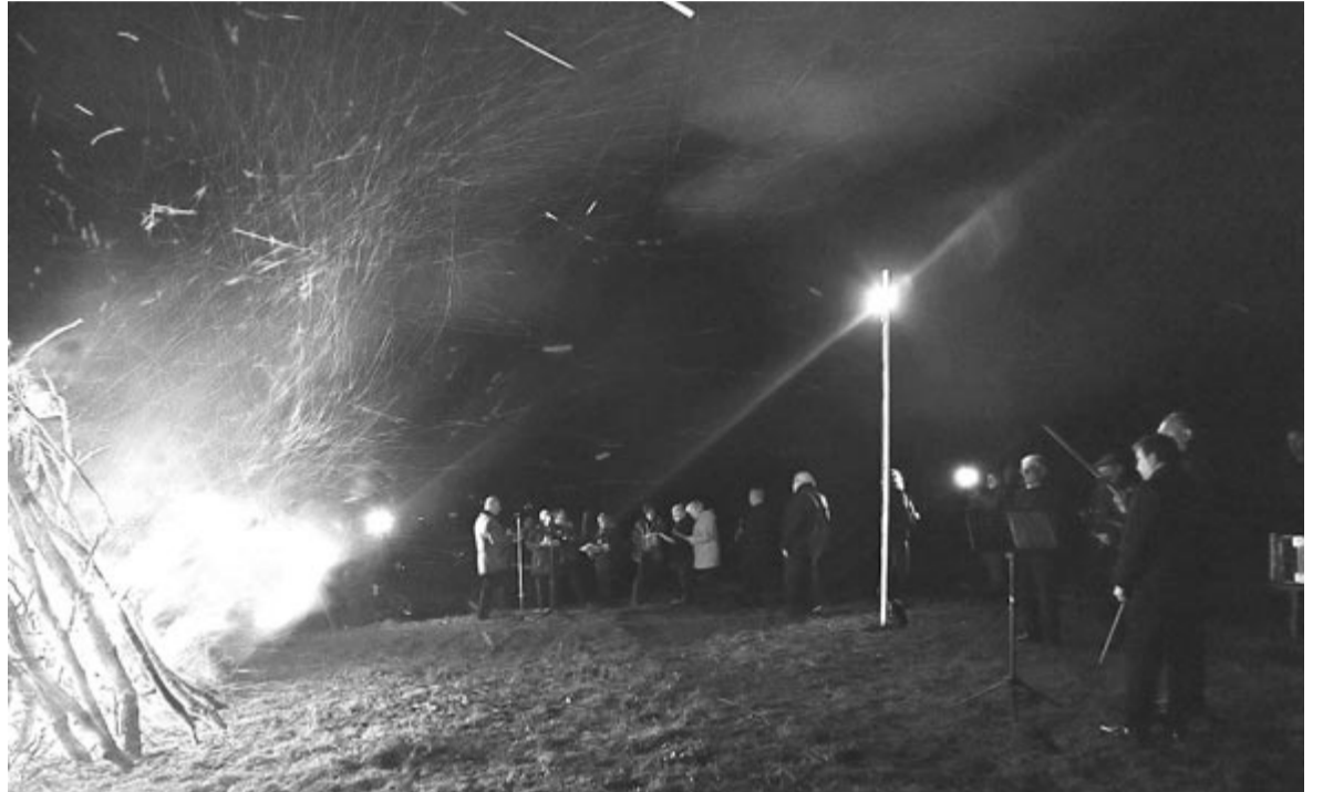
Jobbágyfalván a helyiek mellett szegediek is voltak az őrtűznél

hogy létrehozza és intézményesíti a székelyföldi személyi kártyát. Fontos, hogy mindenkiben tudatosuljon, hogy ez az önszerveződés alapja, mert a székelység képes megszervezni önmagát, függetlenül attól, hogy a román hatóságok mit akarnak, vagy hogy az uniós intézményeknek milyen magas az ingerküszöbe. Ami az idej tűzgyújtások számát illeti, csak néhány nap múlva lesz pontosabb rálátásuk, de a tavalyihoz viszonyítva idén több szándékjavaslat érkezett, egyre többen értik meg, hogy ez mennyire fontos – magyarázta az SZNT elnöke.