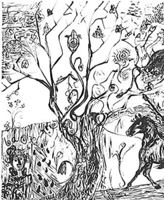
Ifj. Molnár Dénes grafikája a marosvásárhelyi Bernády Házban nyílt kiállításán (részlet)

95 éve, 1927. október 9-én született Dunaharasztiin a Kossuth- és József Attila-díja költő, író, műfordító. Elhunyt 2020. január 31-én.