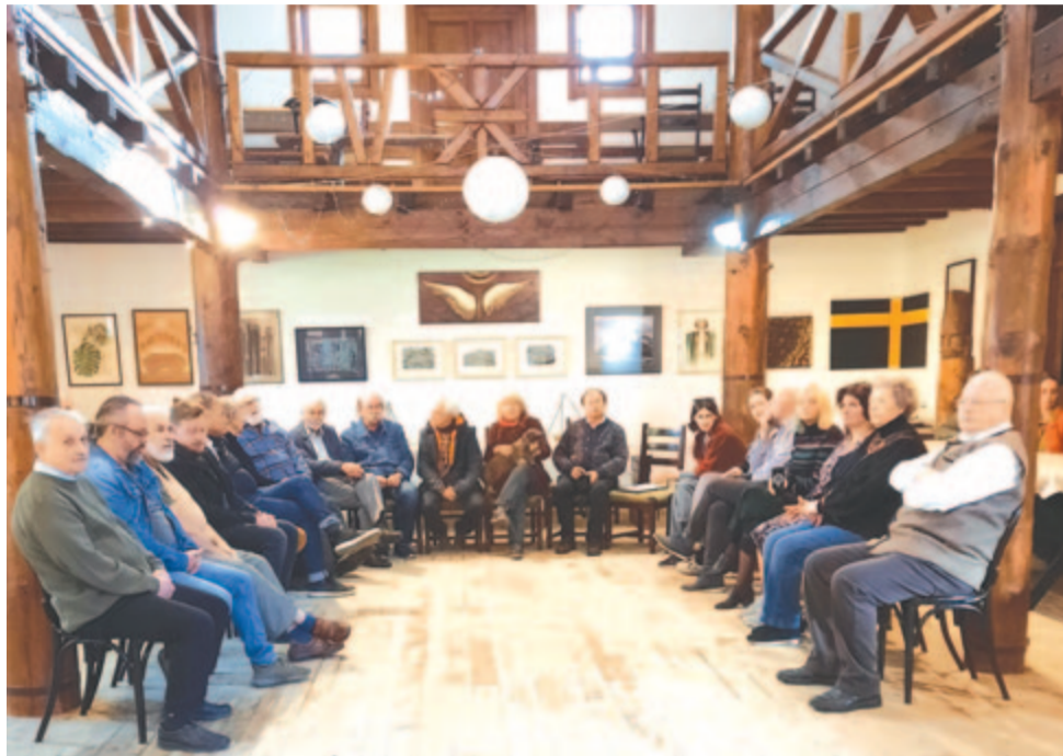
Az alkotótábor művész vendégei a zárókiállítás megnyitóján