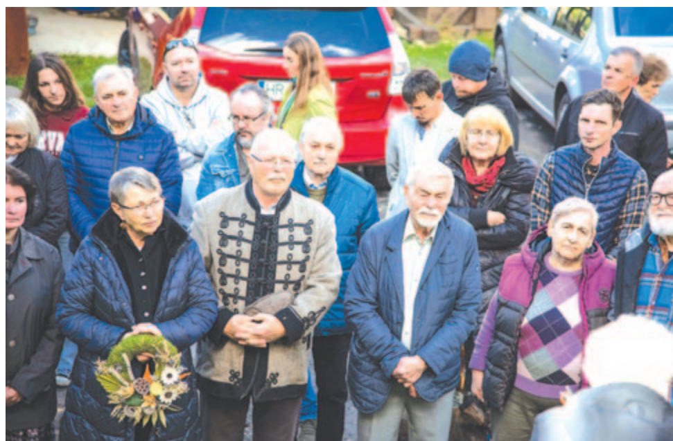
Főhajítás az elhunyt kollégák emlékoszlopa előtt