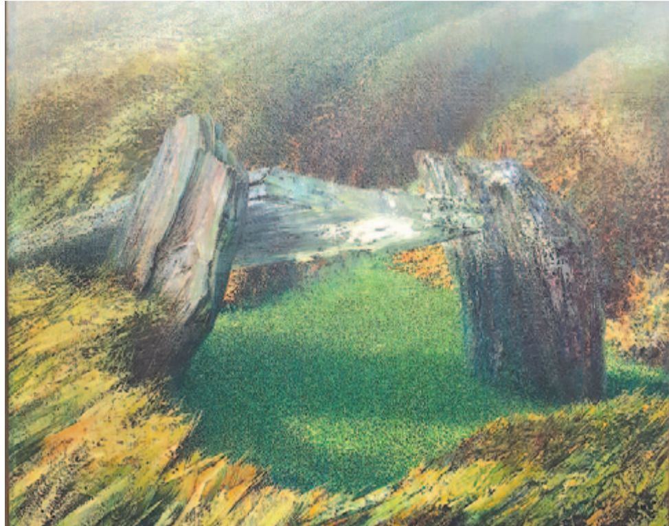
Kuti Dénes: Nagyapám forrása

Zsúfolásig telt a tágas kiállítóterem, a festményeket is majdhogynem elfedte a sok érdeklődő, de október végéig bőven lesz idő arra, hogy a művészetkedvelők csendben,