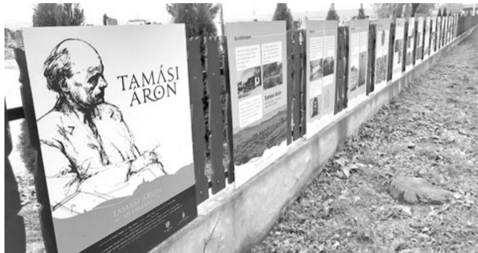
Szabadtéri dokumentum- és fotókiállítás Farkaslakán

De aztán semmi – kutyák bagzanak a telkek közötti gaz vackaiban, odébb éppen hozzák a tejet az állami szektor privatizáltjai, egy kapu előtt az áll a gyűrött cégtáblán, hogy Regina beer srl –, szinte kiér a szűk, agyagos völgyből, meg sem fordul, s már azt láthatja az a pár nyugdíjas, aki ott meresztgeti a szeme üvegét, hogy háttal eregél, még benéz ide meg amoda, s ojjé, most veszi figyelembe: a kirakatok telve választási plakátokkal, egy kemény bajuszú férfit hirdetnek, aki azt igéri, hogy amint eddigé, csak úgy ezután is... Számos kirakatban lát efféle Denndörfer vagy Belleschdörfer, miközben régi korokat idéző munkamániás öregek és gumicsizmás alkalmazottak érthetetlen dolgokat sutyurálnak a seprűnyél mellett, éppen-pihenőben: „Fészénés volt s most pénélés lett!...” D. vagy B. csak bambul; az ő dimenziójában jelentés nélküli e halmaz. Tapasztal lekapart plakátokat is, egyikén mégis valahogy ott maradt: „Jos cu mafia din fabrici” – ez is rejtély, és az is, ami egykori kedvenc sörháza belső te-