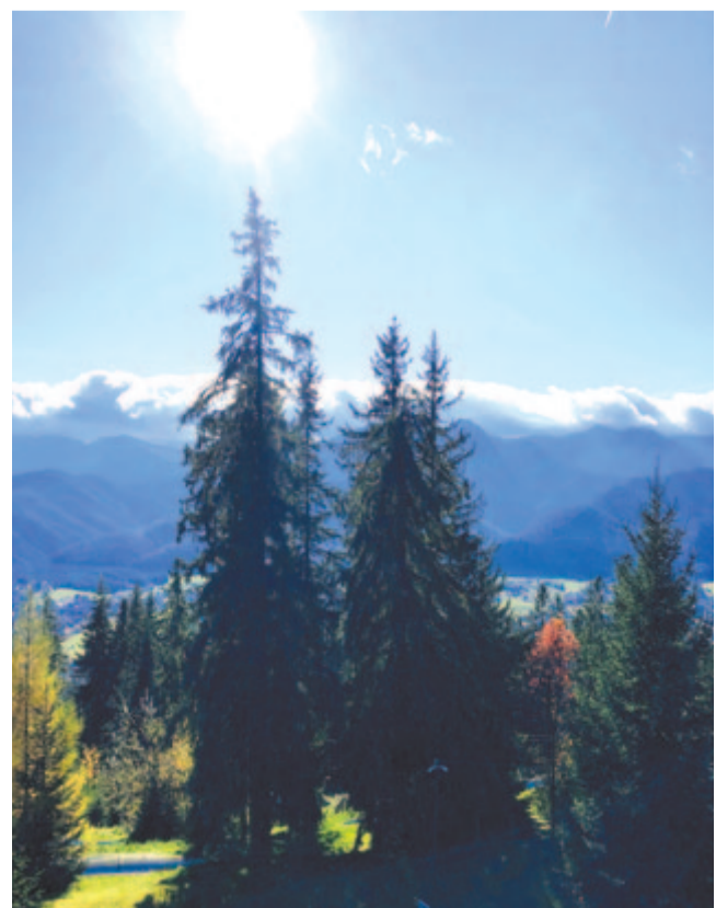
Nézem a fenyők mély-zöld tetejét, ott fenn lappang valami rejtelmes szép veszély

(...) Kik „ott álltatok, nem tehetve másképp”, mert... megalkuvás nincsen, mert a langyosat kiköpi az Isten, (...) mennyi az igazság még öklötökben, mely négy százada oly nagy esküt morkolt, mely kőbe s öröklétbe görcsösödten tartja ma is a bibliát s a kardot?