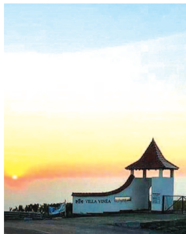
Finom fényben fürdő toszkán táj a Kis-Küküllő mentén

A sárga gesztenyés tövén az élet ifjú láza tombol. A labdázó fiúk zaját szél hozza a kollégiumból.