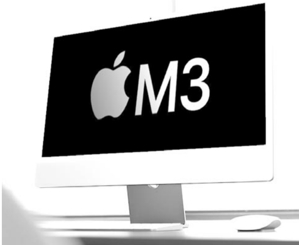
iMac M3, illusztrációkonceptió

Végül pedig egy igazi nagyágyú, amely méretében, teljesítményében és árában is hatalmas lesz. Ez nem más, mint a Mac Pro, amely szintén kaphat újítást, pontosabban ráncfelvarrást. A jelenleg piacon levő változatban még Intel processzorok vannak, minden bizonnyal ezt akarja az Apple helyettesíteni a saját processzorával, a jövő évben érkező Mac Próban már az M2 Ultra processzor – amit még be sem mutattak – foglalhat helyet, 20 magos CPU-val és akár 64 magos GPU-val, 64 vagy 128 GB memóriával. Ha ez nem lenne elég teljesítmény, a felhasználók választhatják az M2 Extreme csippel szerelt változatot, amibe a hírek szerint egy 40 magos CPU, egy 128 magos GPU és 128 vagy 256 GB memória kerülhet, hogy tényleg minden feladatnak eleget tegyen a számítógép, még hozzá pillanatok alatt. A mostani változat csúcskialakítása 60.000 dollár körül alakul, a ráncfelvarrott változat, különösen az M2 Extreme csippel szerelt, minden bizonnyal hasonló árú lesz. Természetesen ez a gép már nem otthoni felhasználásra van tervezve, az óriási hollywoodi produkciókat vágják és szerkesztik ilyen teljesítményű számítógépeken.