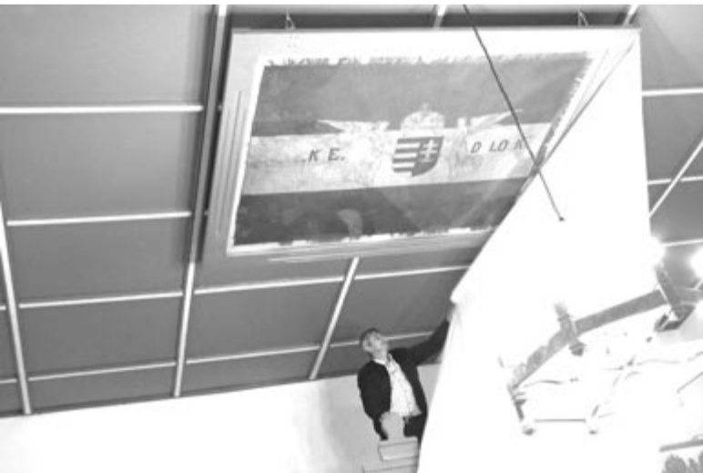
Három évtized után, restaurálva, méltó helyre került a zászló