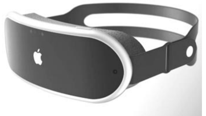
Apple VR Headset, Reality Pro