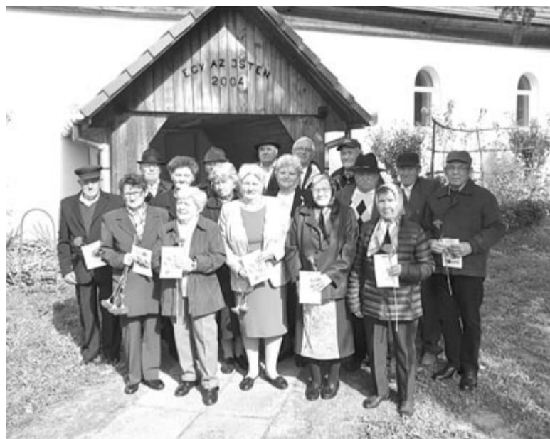
Szabédon is virággal és emléklappal kedveskedtek a gyülekezet idősökének

A havadtői rendezvényt a régi iskola épületében szeretetvendégség zárta, a 70 éven felülieket virággal is megajándékozták. A faluban 103