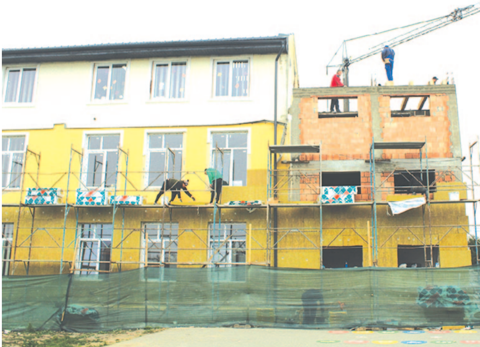
Marosszentannai vendégoldal a 6. oldalon