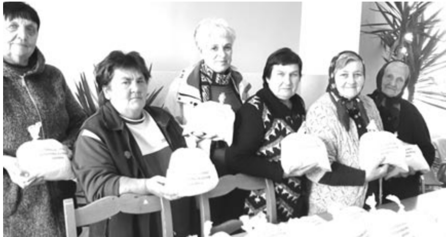
Céla érték az adományok. A Marosvásárhelyi Református Közösség ajándéka – felirat a tasakon

A Maros megyei EMNT az Ukrajnában dúló háború kárpátaljai károsultjainak megsegítésére indított mozgalom Fogadj örökbe egy kárpátaljai falut! címmel. A kezdeményezést szeptemberben a Szabadi úti Református Egyházközösség vállalta fel, a novemberi adománygyűjtést a marosvásárhelyi unitárius egyházakozségek szervezik.