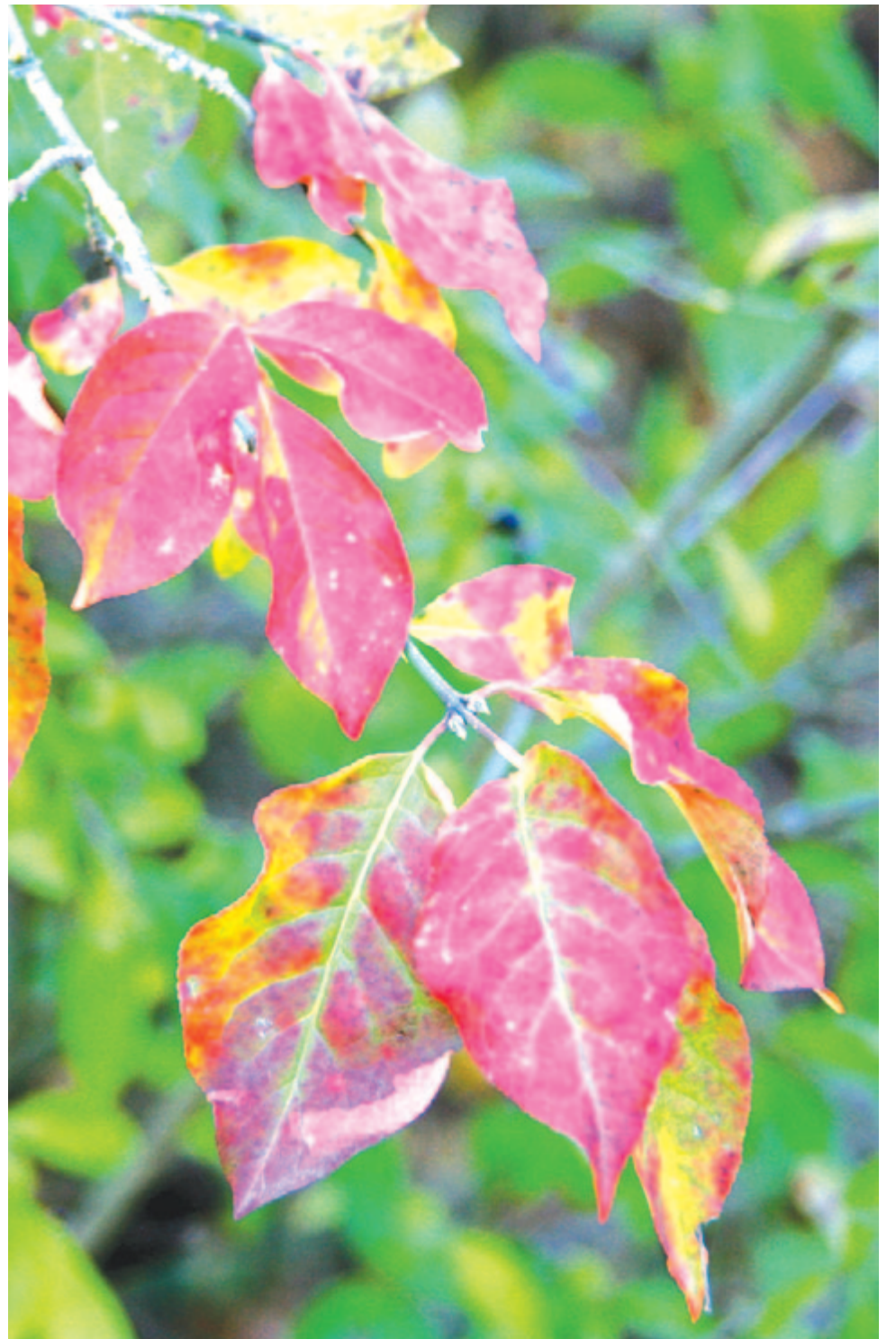
...levél halni, hullni készül

És ma? Meggyőződésem, hogy ma is szükség van kalendáriumokra. Aki ma kalendáriumkiadásra adja fejét, igényt elégít ki,