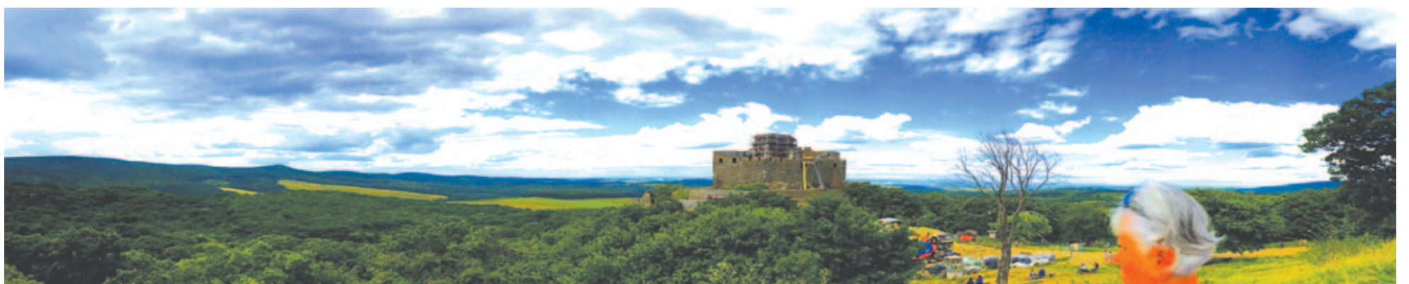
Beleoldódsz lassan az egészbe