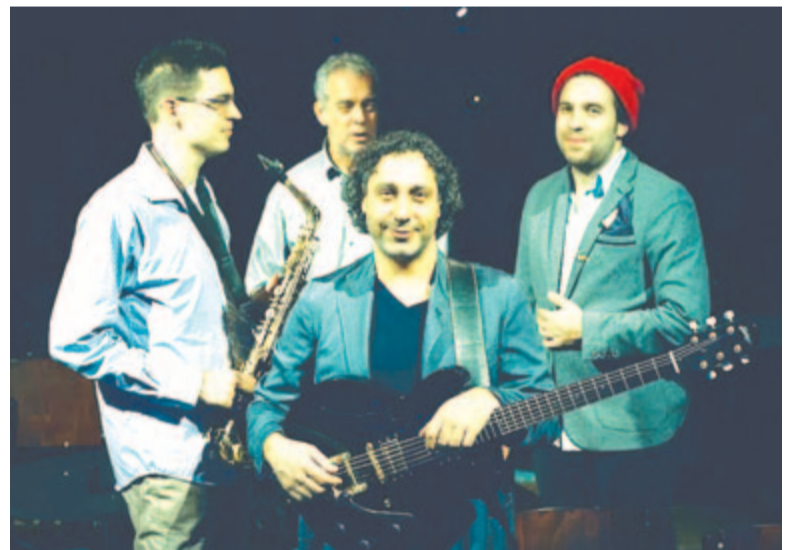
A Nigun zenekar

Csütörtökön 20.45 órától a magyarországi Nigun zenekart láthatja-hallhatja a közönség. A Nigun – európai dzsessz-zenekarként egyedülállóan – a közép-kelet-európai zsidó zenét tartja eredőjének. Zenéjükben a spirituális erőt hordozó hagyomány és a modern dzsessz olvad egységgé. A Nigun mindig is átlépte a műfaji határokat, leginkább talán a klez-jazz jelző írja le, milyen irányban gondolkodnak, ám zenéjüket legalább ennyire jellemzi a kreativitás és a színpadon spontán születő pillanatok varázsa. A zenekar számos országban ven-