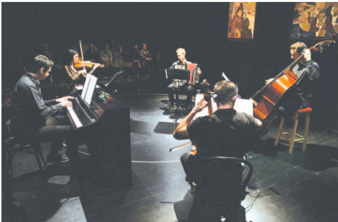
The Tango Orchestra

A fesztivál partnerei: a Maros Megyei Tanács, a Marosvásárhelyi Művészeti Egyetem, a Marosvásárhelyi Nemzeti Színház, a Liszt Intézet – Magyar Kulturális Központ, Bukarest. Főtámogatók: Marosvásárhelyi Polgármesteri Hivatala, a Kulturális Minisztérium, az RMDSZ, a Román Nemzeti Filmintézet, a Communitas Alapítvány, a Bethlen Gábor Alap (Magyarország).