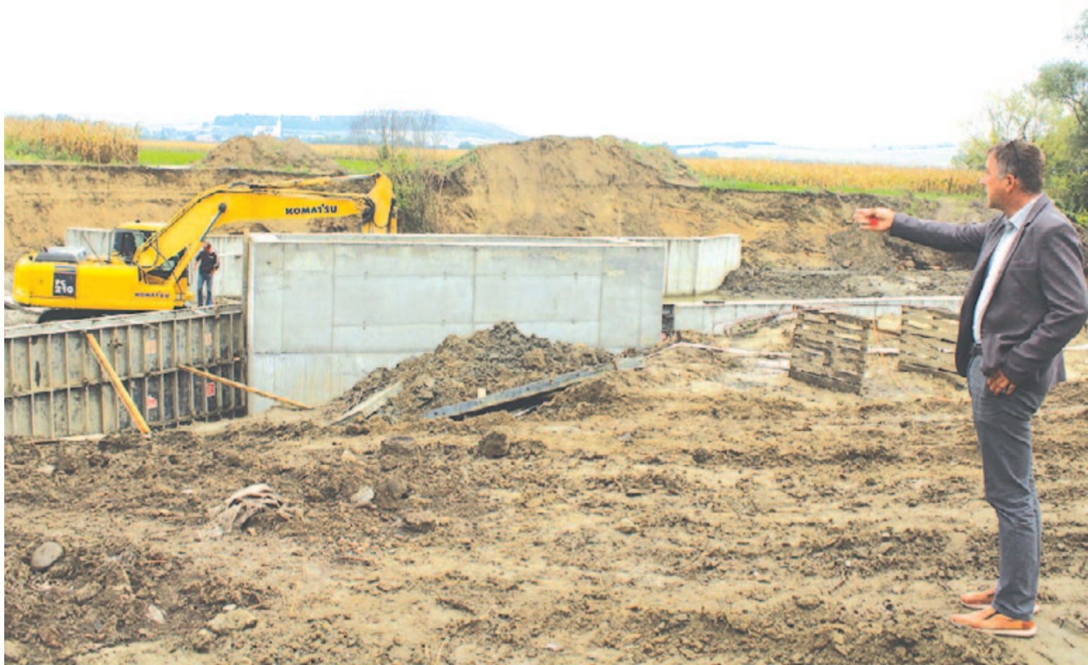
A Kis-Küküllő medrében épülő duzzasztógát. Küküllőszéplaki vendégoldal a 6. oldalon