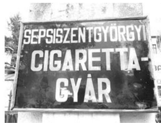
A cigarettagyár-tábla ma is ott díszel a bejáratnál

A Sepsiszentgyörgyön tapasztalható beruházások és a településre jellegzetes épületek újbóli bevezetése a mindennapokba követhető példa lehet mindegyik városi vagy megyei önkormányzat számára.