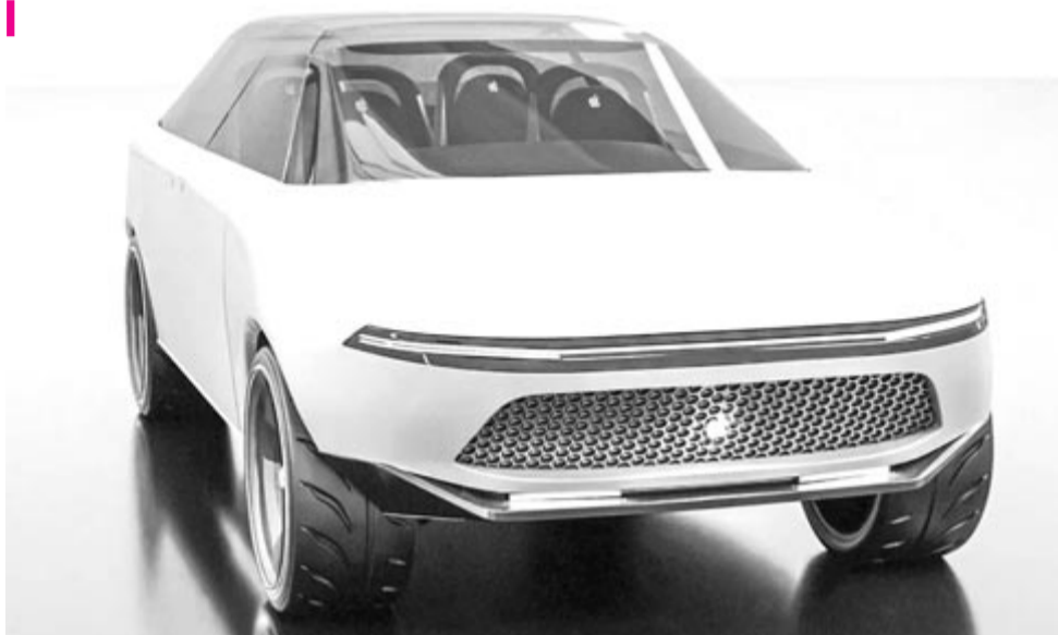
Apple autó, illusztráció

Ha már szóba került az Apple autó, akkor az ellopott adatokból tudni lehet, hogy a fejlesztésére 2014-ben mondta ki Tim Cook, az Apple vezérigazgatója az igenlő választ, és a projekt 2015-ben startolt. Az Apple projektje több ezer fejlesztőnek ad munkát, és várha-