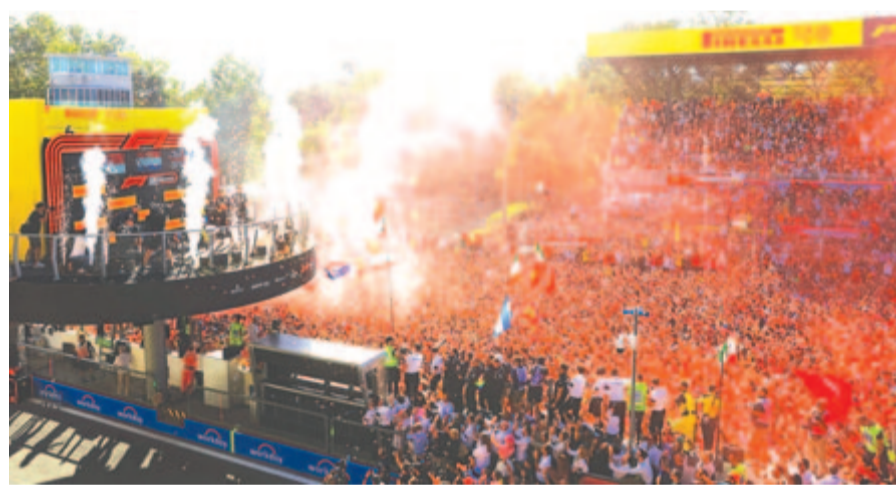
Leplezetlen csalódottság a Ferrari hazai versenyén, a közönség kifütyülte a győztest, aki a biztonsági autó mögött haladhatott át a célvonalon.

A vb három hét múlva, Szingapúrban folytatódik.