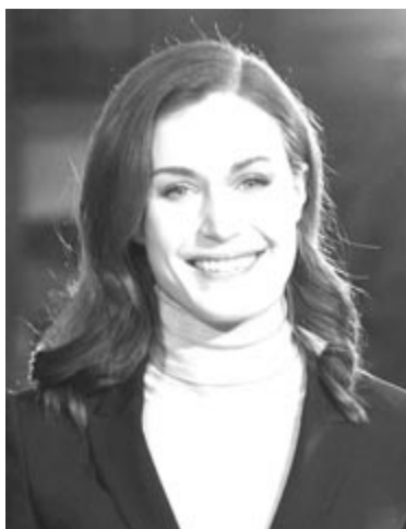
Sanna Marin, Finnország miniszterelnöke

litika is. Eszerint több befektetés szükséges a felzárkóztatáshoz. A képviselők az elmúlt évek kohéziós politikáját értékelik, és további forrásokat kérnek.