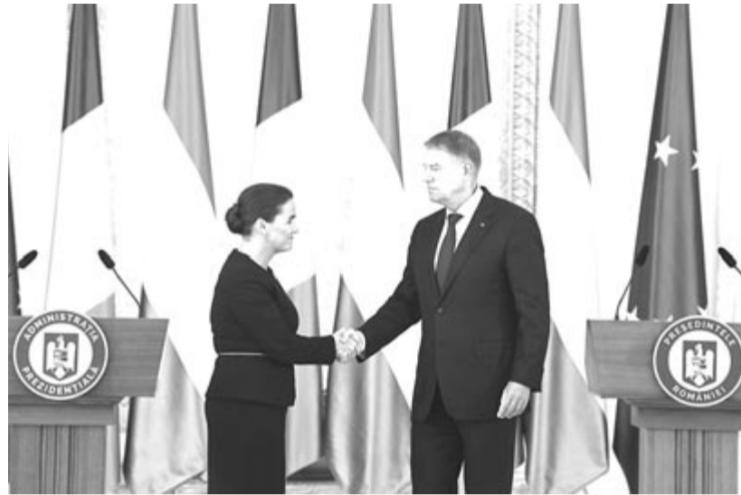
Novák Katalin és Klaus Iohannis közös sajtótájékoztatója a Cotroceni palotában

Elmondta: szó esett arról a közös érdekről is, hogy megállapodás szülessen Magyarország és az Európai Unió között a Magyarországnak joggal járó források vonatkozásában, illetve