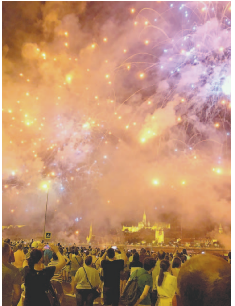
Mintha a Tejút költözött volna közelebb...

Hogy gyűljenek össze Az ő gyermekei, Az ő gyermekei, Hadbéli fiai.