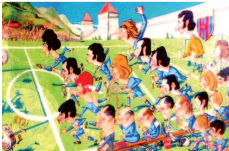
ASA 1975, karikatúra