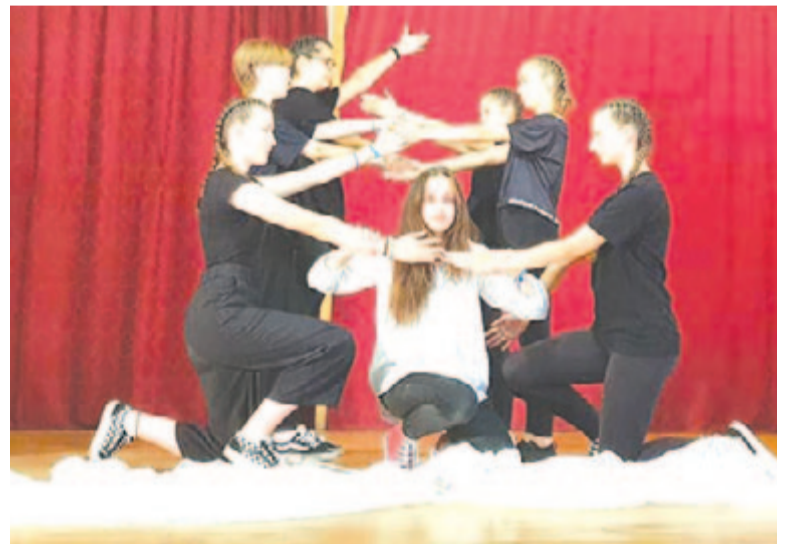
Nyolc csoportban tanultak, alkottak és mutattak be előadást a résztvevői

A darabok sikeresek, a diákok ügyesek voltak. Kiemelkedő előadások is születtek, így az erdőszentgyörgyi negyediké, továbbá a nyolcadik osztályt végzették, akik Arany János Ágnes asszony című balladája