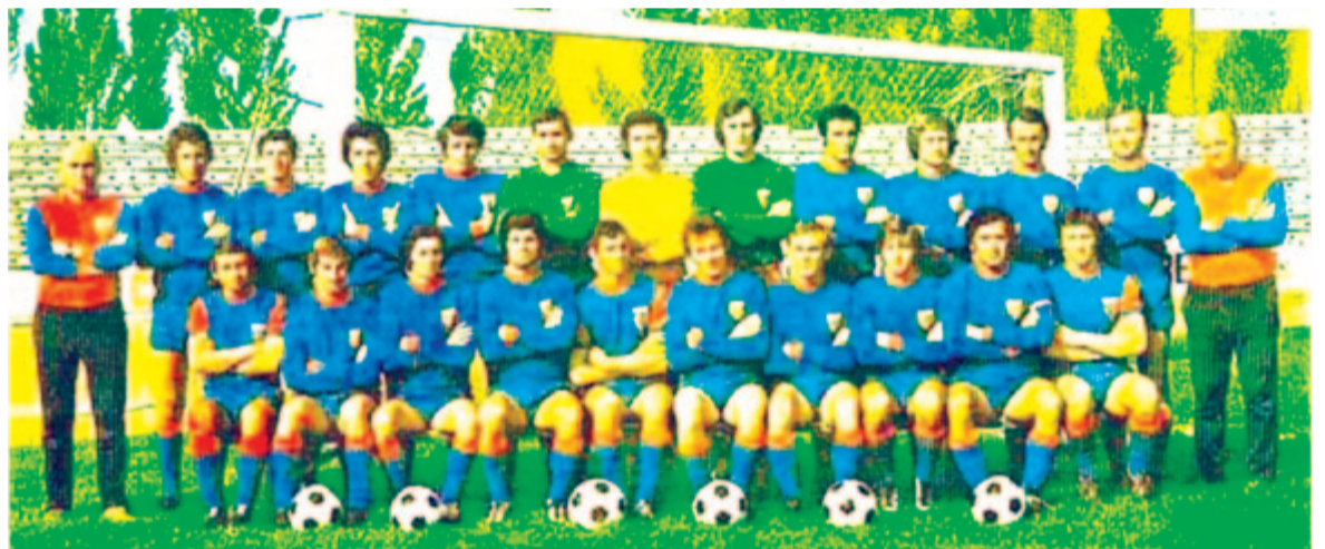
AS Armata, 1975