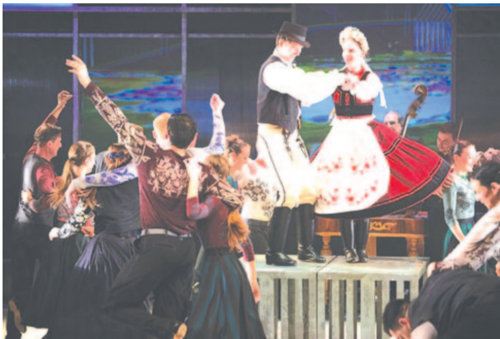
Idesereglik, ami tovatűnt

További részletekért kövessék a Tomp Miklós Társulat honlapját ( https://nemzetiszinhas.ro/play/totek-a-tamasi-aron-szinhas-vendegeloadasa-2022/ ), valamint a társulat és a Vásárhelyi Forгатag Facebook-oldalát ( https://www.facebook.com/tompamiklos ) https://www.facebook.com/forgatag .