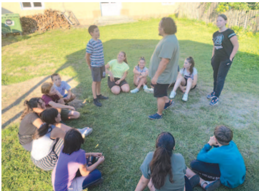
Idén is száznál többen vettek részt a táborban