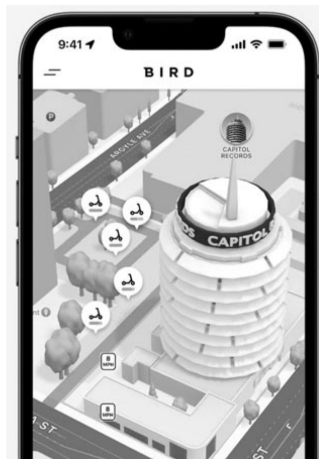
A 3D-s térkép

Nemcsak az új iPhone-ok érkeznek meg szeptemberben, hanem az iOS verzió is, az iOS 16. A szoftver béta változatai már kint vannak, így mostanra tudni lehet, hogy milyen újdonságokat hoz az Apple új, telefonokra szánt operációs rendszere.