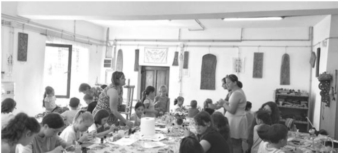
Köszönet a szervezőknek, a pedagógusoknak, a külsős szakembereknek, akik ezt a lángot próbálták átadni az elmúlt 20 évben és szeretettel ápolni mind a mai napig