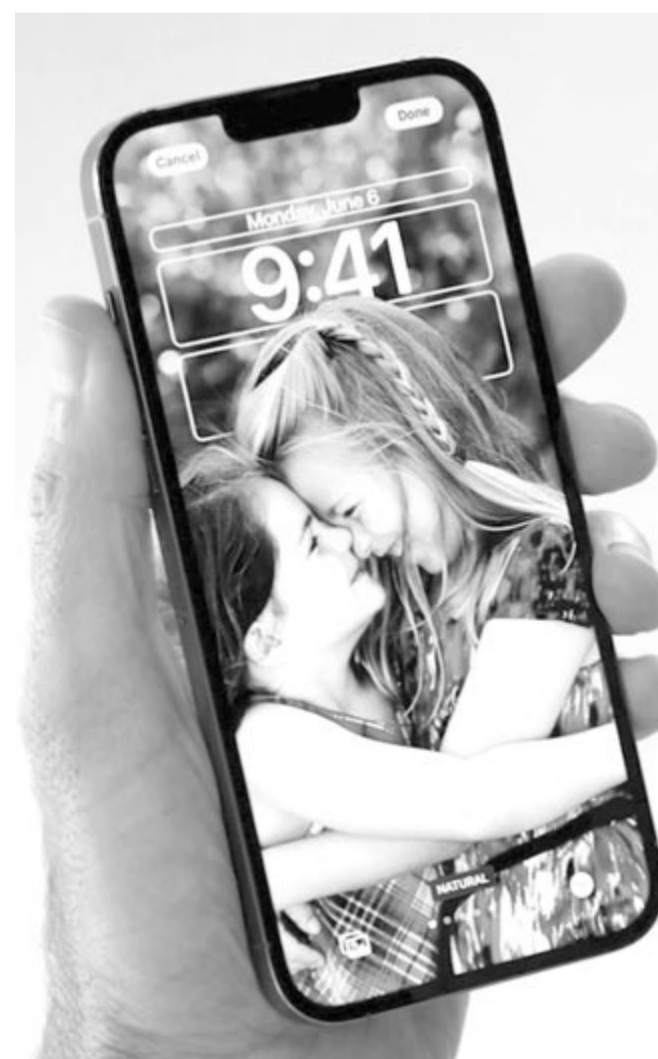
Új zárolt képernyőt kapnak az iPhone-ok

A Térképek alkalmazáson bővül azon városok száma, amelyek teljes egészében le vannak modellezve 3D-ben. Am ettől sem kell izgalomba jönni, mert egyetlen romániai vagy magyarországi város sem szerepel a listán. Azok a helységek, amelyekről elkészült a modell, fantasztikusan néznek ki, és számos lehetőséget rejtenek. Az elektromos rollert szolgáltató cégeknek lehetőségük lesz összeolvasztani saját rendszereiket az Apple-térképpel, így azon is megnevezhetik a felhasználók, hogy éppen hol van szabad roller.