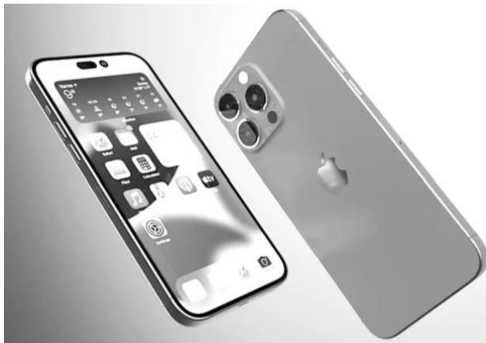
iPhone 14 Pro Max-konceptió

Van egy másik rossz hír is, bár erre számítani lehetett. Az iPhone 14 Pro Max indulóára 100 dollárral több lesz, mint tavaly az iPhone 13 Pro Maxé. Azaz az Egyesült Államokban 1200 dollár környékén kezdődik. A drágulásra már csak az infláció miatt is számítani lehetett. Viszont, ha figyelembe vesszük a dollár-lej árfolyamot, nem kizárt, hogy az ideai csúcs iPhone romániai indulóára meghaladja a 7000 lejt.