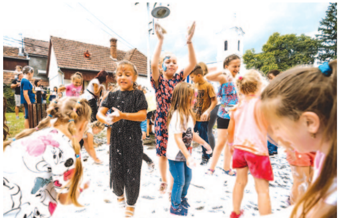
Nyár, öröm, szórakozás – ezt kínálja Nyárádszereda és térsége