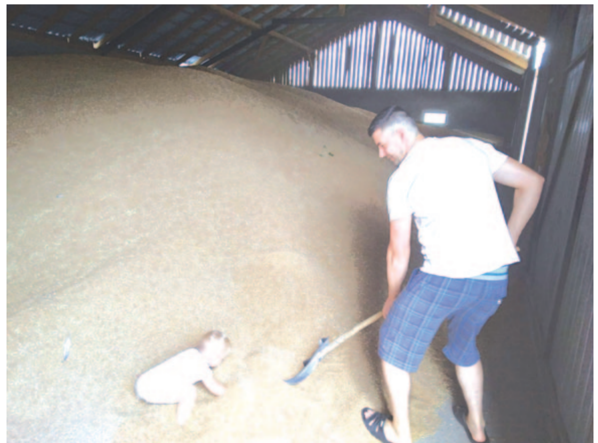
Az unokák korán belekóstolnak a gazdálkodásba

– Ahogy jelenleg mutatkozik, már 20-25 százalékos termés kiesés várható. Különösen azokon a táblákon, amelyeket később vetettek be.