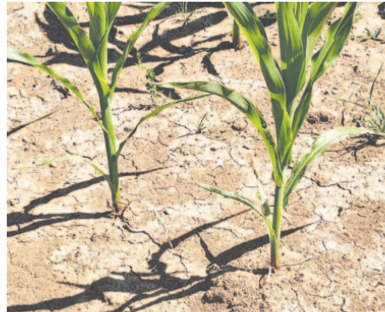
A terményre ritkán kötnek biztosítást

Leginkább aszály, árvíz, korai fagyok ellen szoktak tavasszal biztosítást kötni a gazdák, az állattartásban a betegségek, járvány,