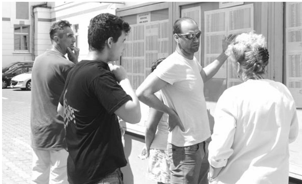
Felvételiünk illusztráció.

Az egyetem keretében meghirdetett magyar tannyelvű informatika szakra három jelentkező volt, mindhárman magas általánossal jutottak be. Kérdés, hogy három diák elegendő lesz-e, hogy egy csoportot alakítsanak – tehetjük hozzá az elmondottakhoz. (bodolai)