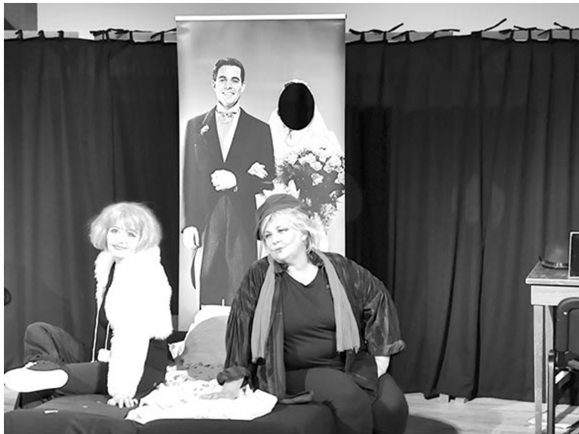
Tavalyról ismert arc és darab is érkezett

Az idei Rengeteg fesztiválsorozat szeptemberben népzenei rendezvényekkel zárul, a Sándor egyesület szervezésében mikházi őszi folkes-ték is lesznek.