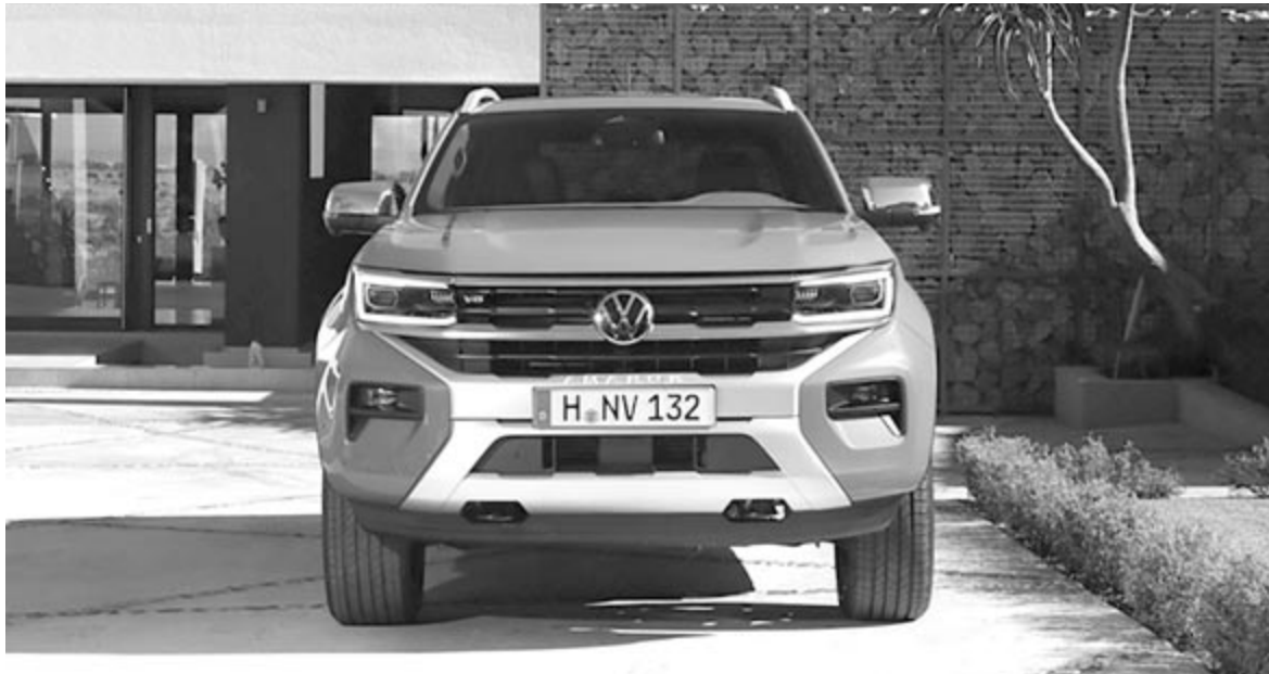
Volkswagen Amarok, második generáció

A Volkswagen Amarok első kiadása 2010-ben látta meg a napvilágot, akkor, amikor még a vásárlók valóban érdeklődtek – Európában is – a pick-upok iránt. Bár itt az alap-kivitelbe csak a szokványos 2 literes turbó dízel került, míg máshol a V6 volt a belépő, elég nagy érdeklődést váltott ki a kicsinek éppen