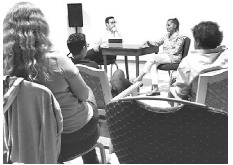
A vetítéseket követő pódiumbeszélgetések a filmes szakma kulisszái mögé engedtek betekintést

Mindenképp sikeres volt a filmfesztivál is, ha már az első évben ekkora érdeklődés volt iránta, és ilyen kiemelkedő magyar alkotásokat és személyiségeket sikerült elhozni Szovátára, akik nemcsak