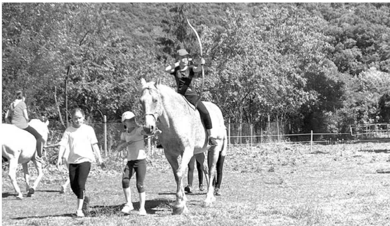
Szombatig mindenkinek kell tudnia lovagolni és lóról lóni