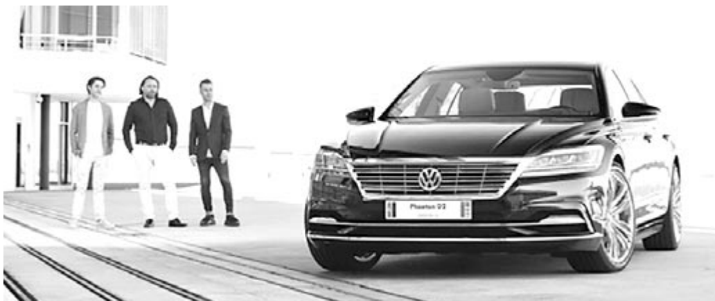
Volkswagen Phaeton D2, a soha el nem készült luxus-Volkswagen

A Phaeton soha nem volt sikeres, de a Volkswagen nem ezért engedte el a D2 kezét, hanem mert közbejött a dízelbotrány, amikor is évek profitja úszott el. Akkor született meg a döntés, hogy új pályára kell állítani a céget, amibe már nem fért bele egy olyan presztízisprojekt, mint a Phaeton D2. A gyártására szánt pénzt inkább a villanyautók fejlesztésére fordította a cég. Napjainkban pedig már tét nélkül mutathatták meg, hiszen mostanság senki nem készíti ilyen luxusszedánt. Tehát kijelenthető, hogy a Phaeton el lehet temetni, hacsak nem támad fel egyszer elektromos autóként, bár erre kicsi az esély.