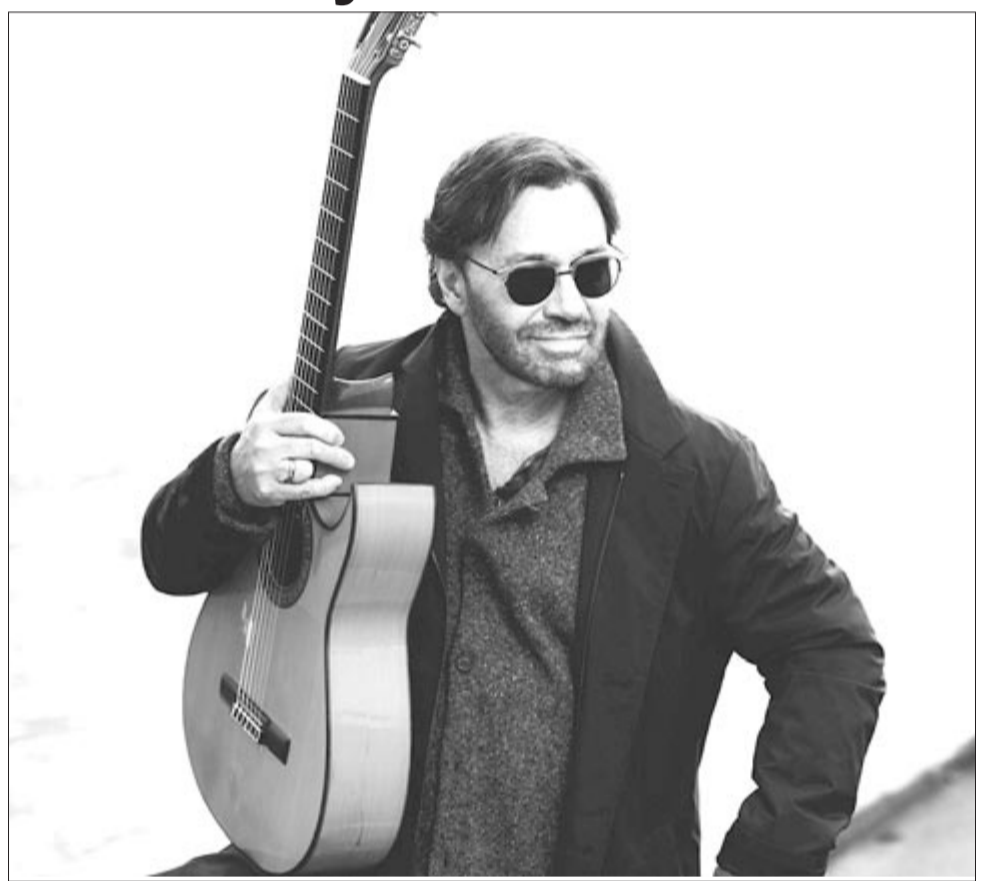
Al Di Meola