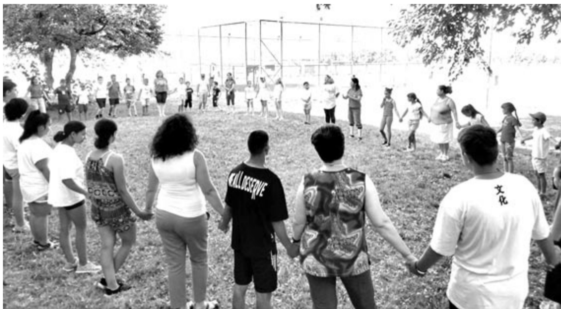
Négy napon át minden tanintézményben színes, változatos és vidám tevékenységek zajlottak