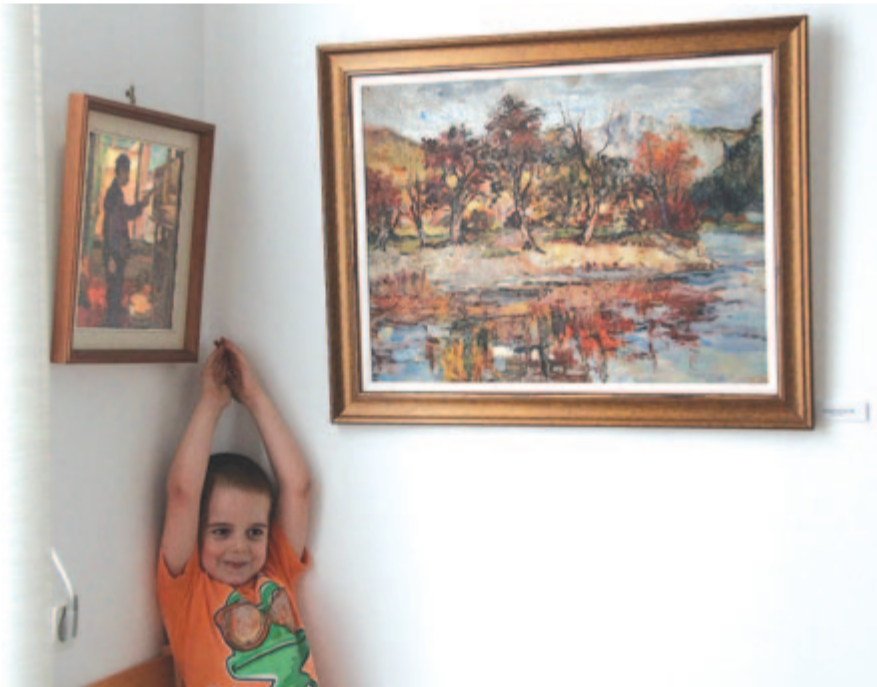
A festő képei és egyik dedunokája

Minden kiállított műve a halál cáfolata, a szabadság tételes kimondása, az alkotó dicsérete. Ha van: jóvátétel az utókor részéről.