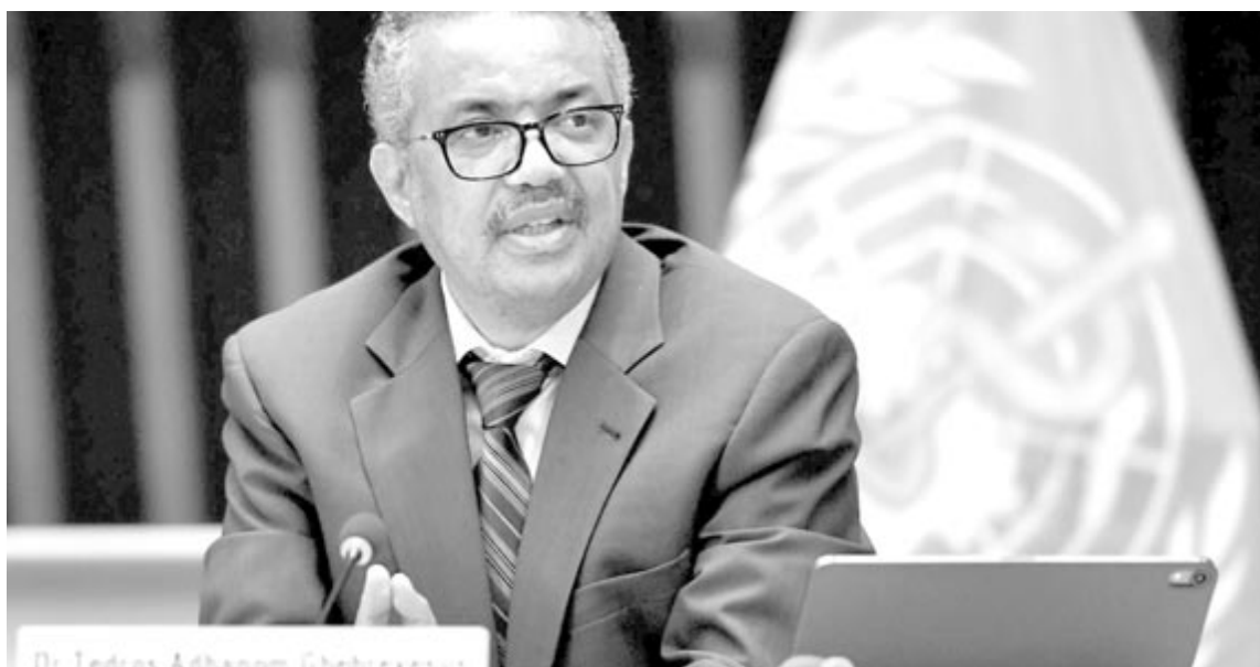
Tedrosz Adhanom Gebrejeszusz, a WHO főigazgatója

Az Egyesült Államokban már a BA.4 és BA.5 változatok a felelősek szinte az összes jelenleg regisztrált koronavírus-fertőzésért, ezért a Biden-adminisztráció is újból óvatosságra szólítja fel az embereket, illetve hangsúlyozza annak fontosságát, hogy az arra jogosultak emlékeztető oltást kapjanak. (Euronews)