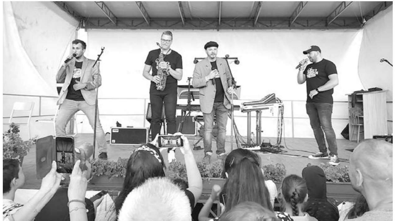
Több ismert fellépő volt, ennek is betudható, hogy idén sokan vettek részt a községnapok programokon