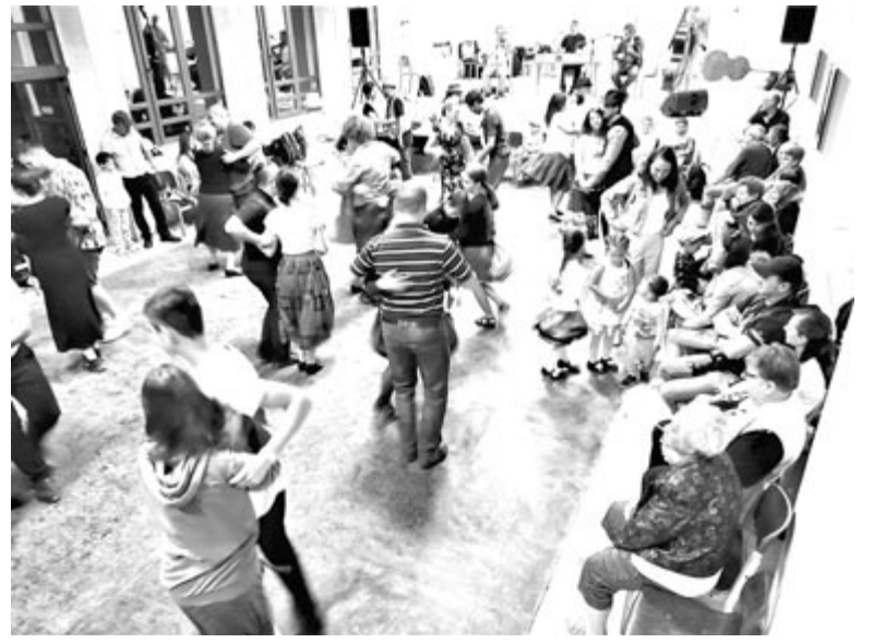
Kicsik és nagyok egyaránt rojják – két év után ismét előben