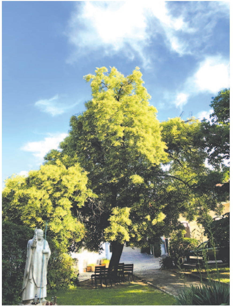
A szentendrei nagylevelű hárs is még ontja mézes illatát

A régi korok embere hiedelmeit felküldte a csillagos égre: a férfi megtermékenyítő erejét a Kos csillagképhez, a megtermékenyülést a Bikához, a férfi és nő egyesülését az Ikrekhez, a fogamzást, a belőlük fogant, rejtetten érlelődő új életet a Rák csillagképhez rendelte. Utóbbtól egy áldott állapotnyi időre,