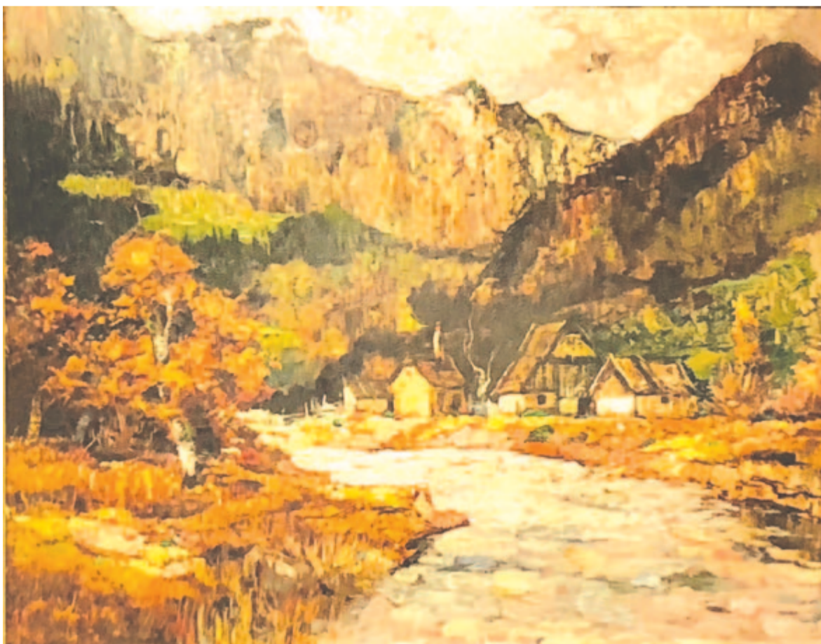
Székely körvasút menti nyári kép – Nyilka Róbert olajfestménye

Kelt 2022. június 17-én, 95 évvel Sütő András születése után