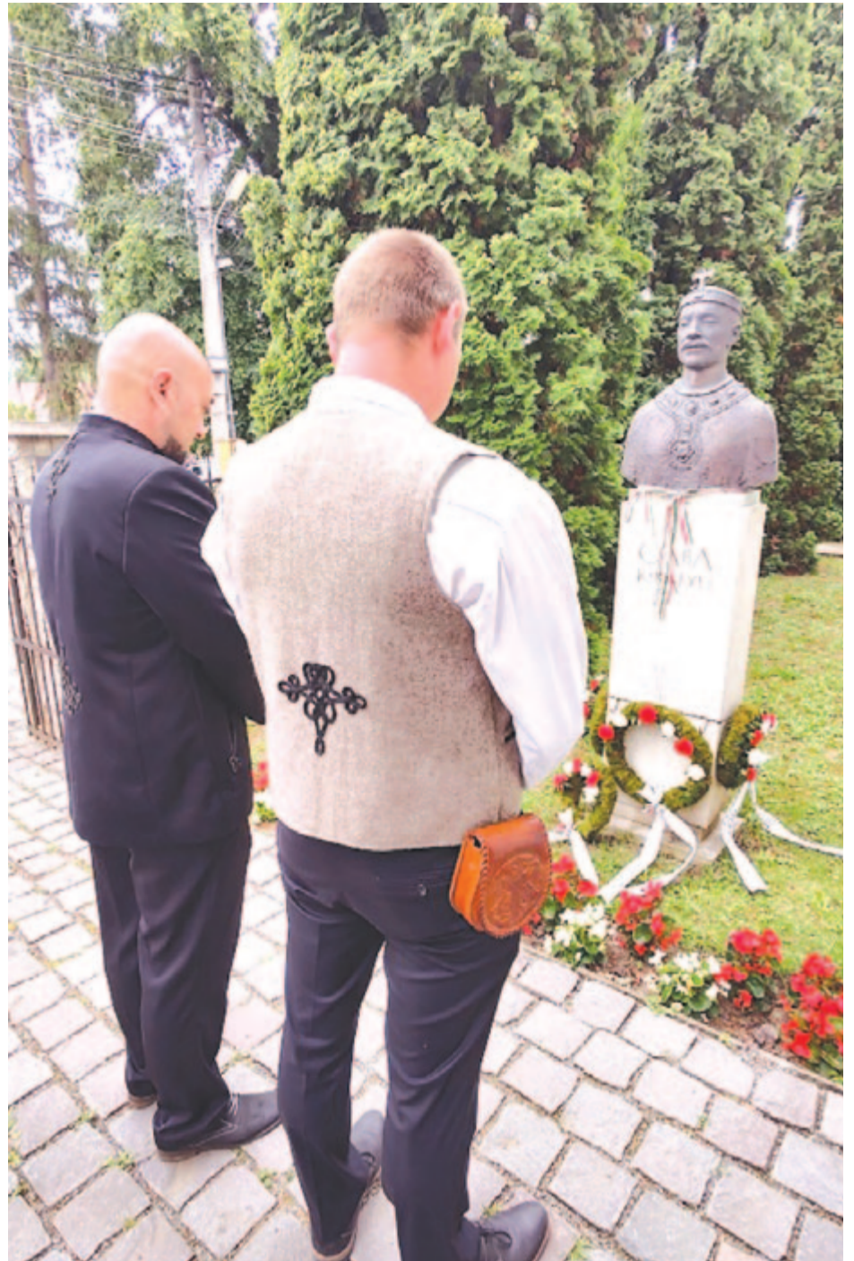
Tizenkét év alatt tízszer emlékeztek és koszorúztak Csaba királyfi szobránál

A rendezvény keretében négy gyerek mutatott be rövid, alkalomhoz illő műsort, majd a templomkertben álló Csaba-szobornál az emlékezés koszorúit helyezte el a református egyházközség, a Nyárádszeredaiért Egyesület, Nyárádszereda Székely Tanácsa és az EMSZ helyi szervezete.