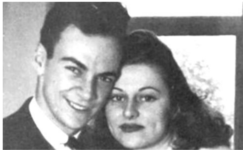
... egyedül vagyok nélküled...

dőbaja, tudni lehetett, hogy a kegyetlen valóság elkerülhetetlen. Egyik barátja, Klaus Fuchs autóját mindig készenlétben tartották, hogy amikor megcsörren a telefon, feleségéhez siethessen. El is érkezett a rémisztő pillanat. Feynman sietett, de útközben még két „stoppost” is felvett, hogy esetleg segítsenek, ha gond adódna az autóval. Két alkalommal is gumidefekt miatt kellett megállniuk, végül az utasok segítségével tolták be az autót egy szerelőhöz, aki, amikor megtudta, miről van szó, nyomban megjavította a kocsit. Mintha ördög bújna volna az autóba, mérőföldekkel a cél előtt ismét leereszkedett az egyik kereke. Ekkor már otthagyták a járművet az út szélén, és alkalmi autóval robogtak be a kórházba. Az utolsó pillanatban érkezett, még megfoghatta felesége gyengülő kezét. Feynman tekintete az asszony kezén lévő órán akadt meg. Ó adta évekkel azelőtt ajándékba. Az óra sehogyan sem akart továbblépni 9 óra 22 percnél – mert tulajdonosa szíve sem dobogott már.