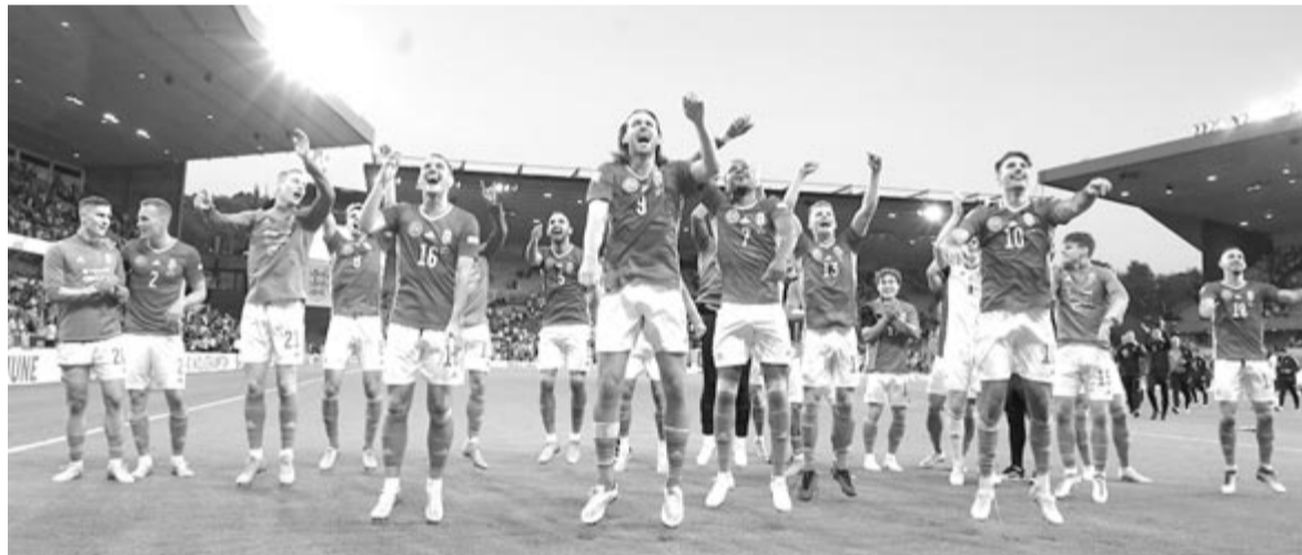
A magyar csapat tagjai győzelmüket ünneplik.

A magyar nemzeti együttes legutóbb 1953-ban győzött Angliában, akkor az évszázad mérkőzésén a Puskás Ferenc fémjelzte Aranycsapat diadalmaskodott 6-3-ra. Az angol válogatott 1928 márciusa óta nem kapott ki négygólos különbséggel hazai pályán: 94 évvel ezelőtt a skótok győztek 5-1-re Londonban. További érdekesség, hogy Sallai Roland lett az első magyar válogatott játékos Puskás Ferenc és Hidegkuti Nándor óta, aki legalább két gólt tudott szerezni idegenben Anglia ellen.