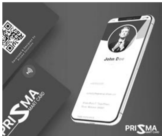
Prisma Smart Card és a hozzá tartozó felület

Kiss Levente, a Prisma Solution alapítója úgy összegezte, hogy egy termékben ötvözték a design, a környezettudatosság és a hasznosság elvét.