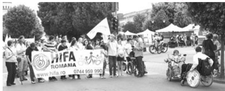
Felvételünk a civil szervezetek vásárán készült

Érvénytelenné válnak a lejárt rokkantsági igazolványok Kérelmezni kell a megújítást