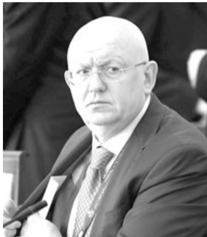
Vaszilij Nyebenja, Oroszország ENSZ-nagykövete

hullámot váltott ki az ENSZ-jelentés az orosz csapatok által Ukrajnában elkövetett nemi erőszakról. Feltételezhetően sokkal több az eset. (Euronews)