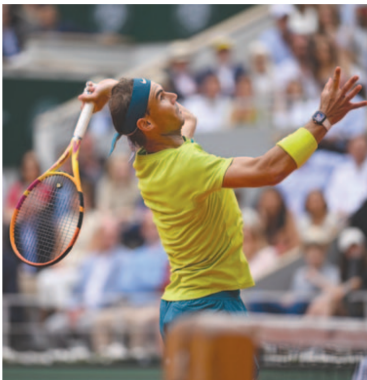
Rafael Nadal gyorsan legyőzte Casper Ruudot

A manacori klasszis két óra elteltével már hetes szériában volt (2:0) a nyert játékok szempontjából, az egyre többet rontó skandináv teniszező pedig megroppanni látszott. A következő brékkel a salakkirály már sorozatban kilenc gémmel járt, innentől már nem engedte ki a kezéből a meccset, és végül a 14. párizsi