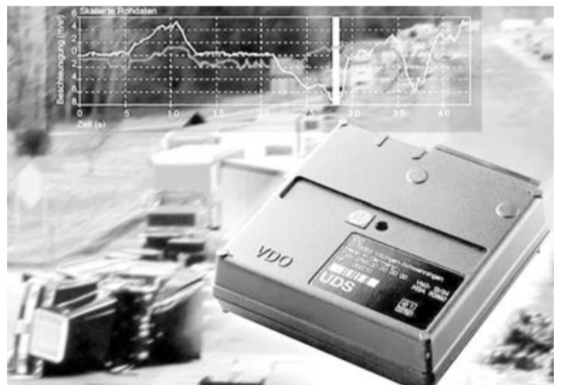
Az autók feketedoboz

A kilencedik rendszer az alkoholszonda, amely megakadályozná az autó elindítását, ha azt érzékeli, hogy a vezető szeszest italt fogyaszt