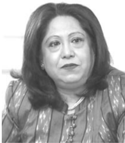
Pramila Patten, az ENSZ különleges képviselője

Heteken át vizsgálta az ENSZ a bejelentéseket az orosz katonák által Ukrajnában elkövetett szexuális erőszakról.