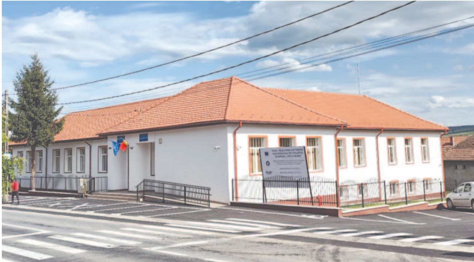
Alig két év alatt kibővítették, felújították és felszerelték a kelementelki iskolát