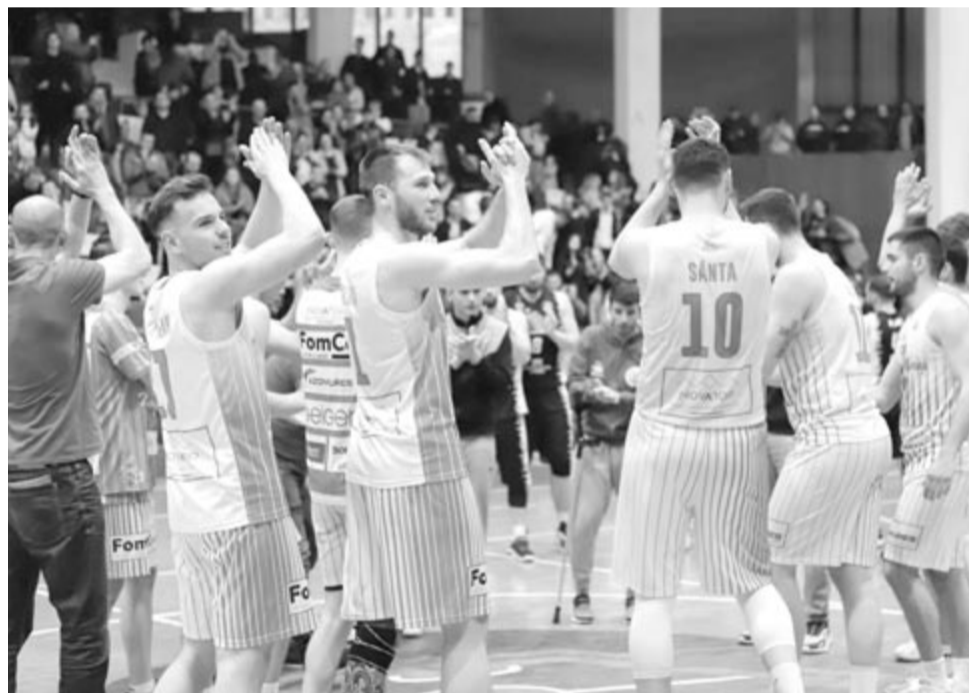
Marosvásárhelyen szerezheti meg a feljutási jogot a CSM

Elmaradt mérkőzésen: Jászvásári Politehnica – Nagyvárad CSM CSU II 76:69, Jászvásári Politehnica – Nagyszebeni CSU II 72:103, Nagyvárad CSM CSU II – Jászvásári Politehnica 85:68, Brassói Ralph – Kolozsvári U 65:74, Nagyszebeni CSU II – CSU Craiova 71:52.