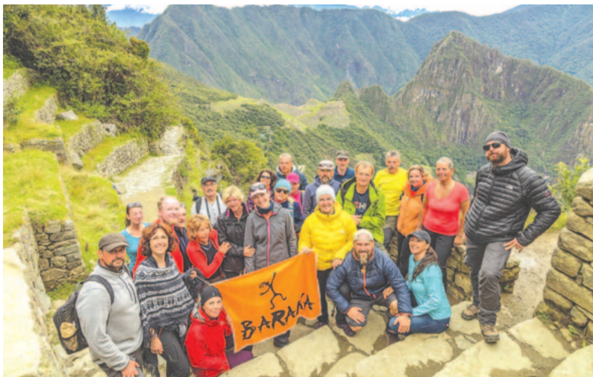
A perui hegyek között