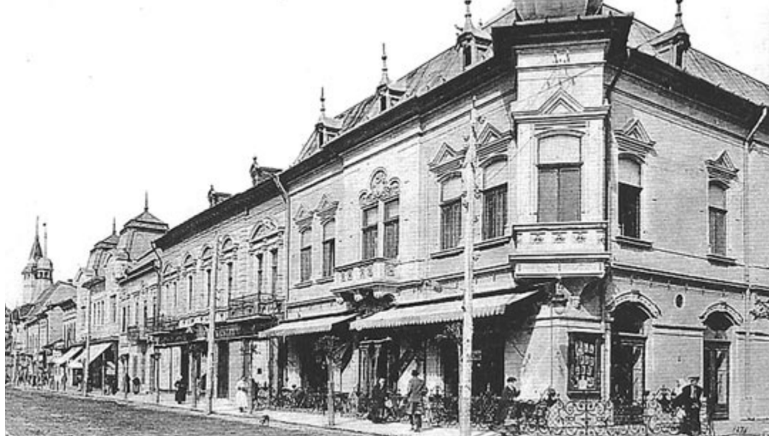
A marosvásárhelyi Korzó kávéház 1908-ban