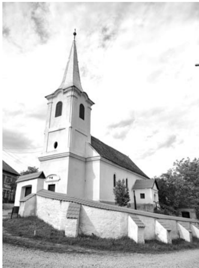
A nyárádgálfalvi templom az erdélyi szakrális teret képviseli a Skanzenben