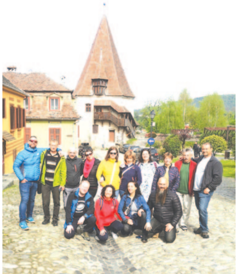
Csoportkép a segesvári várban