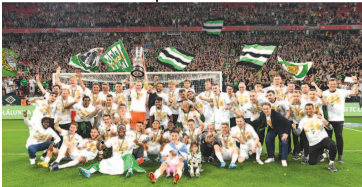
A Ferencváros csapata ünnepel a kupával.