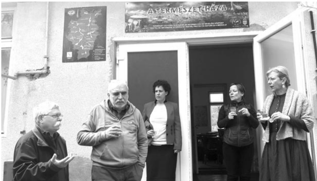
Több helyszínen is megvizsgálják a kérdéseket, mielőtt levonnák a következtetést