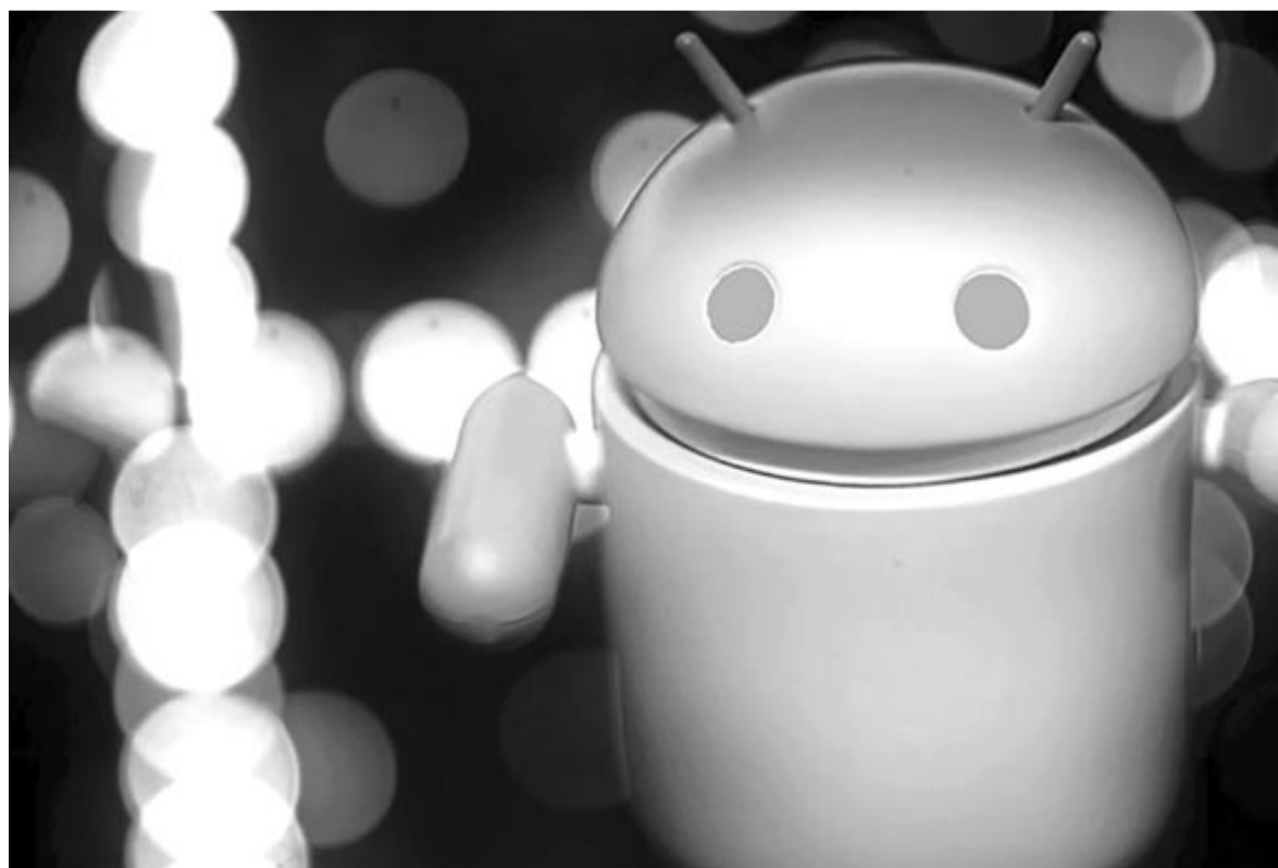
Android vírus, illusztráció

Elsősorban csak olyan alkalmazásokat szabad letölteni, amelyek ott vannak az adott rendszer saját áruházában. Itt is vannak kivételek, de az sokkal kevesebb, mint az internetről letöltött alkalmazásoknál. A második lépés az, hogy ellenőrizzük a fejlesztőt, ha valamiért furcsának találjuk. Például egy Facebook vagy egy széles körben ismert alkalmazás esetében erre nincs szükség, de egy kevésbé ismert program esetében érdemes megtenni, hiszen sok kellemetlenségtől megmenthet. Végül, ami talán a legfontosabb: ne felejtjük el azt az elvet, hogy miért nem kell pénzben fizetnünk ott mi magunk vagyunk a termék. Lehet, hogy csak jelentéktelen, ártalmatlan adatokkal fizetünk, de az sincs zárva, hogy komoly adatokat – jelszavakat, banki hozzáférést – lopnak el tőlünk ezek a programok. Nyitott szemmel kell járni a digitális világ labirintusában is!