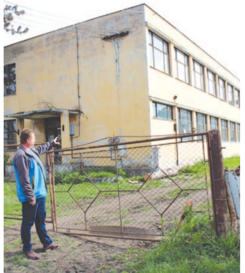
Felújítás után ide költözik a polgármesteri hivatal

A vajdaszentiványi orvosi rendelő régóta felújításra szorul, a község vezetősége azonban más megoldást talált az egészségügyi ellátás korszerűsítésére.