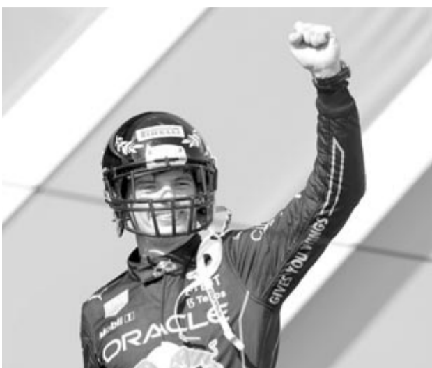
A hely szelleméhez illően amerikaifutball-sisakban ünnepelt a futamgyőztes.

Leclerc a folytatásban nem tudta tartani Verstappen tempóját, körről körre nőtt a hátránya, míg nem a 24. körben a boksza hajtott kerécsere. A Red Bull sem várt sokáig, két körrel később Verstappen is kiállt új abroncsokért, majd jött friss gumikért Sainz a Ferrarihoz, a negyedik Sergio Pérez pedig a Red Bullhoz.