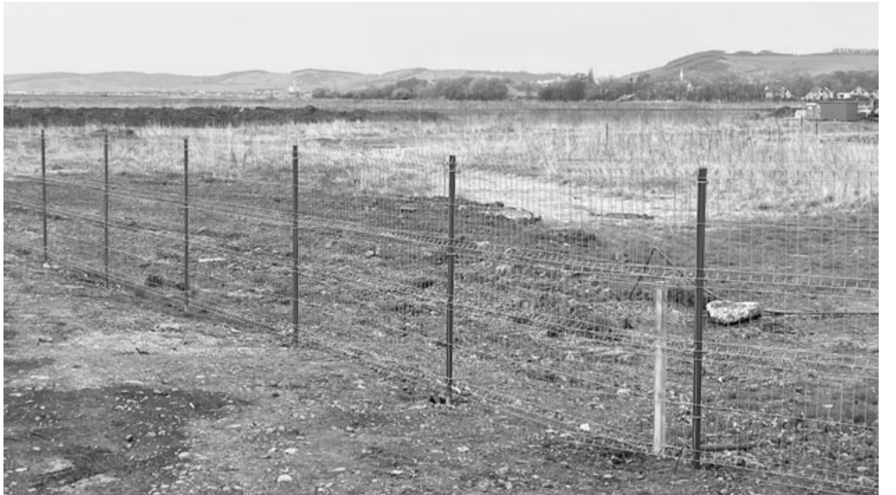
Az eredeti helyszín, ami el van kerítve