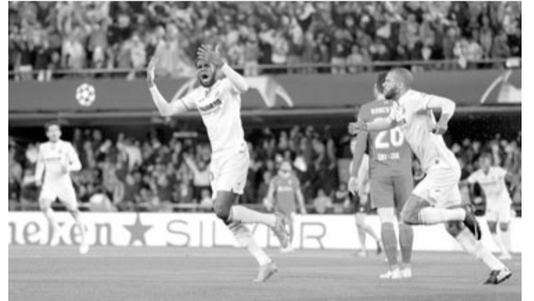
A Villarreal ledolgozta kétfólos hátrányát, és több mint egy óráig éltette a továbbjutási reményét.

Európa-konferencialiga, elődöntő, visszavágó: AS Roma (olasz) – Leicester City (angol) (1-1), TV: RTL +, Olympique Marseille (francia) – Feyenoord (holland) (2-3).