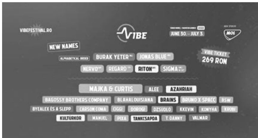
A fesztivál programja

– Az idei Koli új arcot és új tematikát kap. Ezekhez az újdonságokhoz próbáltuk találatni a felkért előadókat. Ezzel kapcsolatban is minden információt meg lehet találni az oldalainkon. Érdeemes résen lenni, hiszen hamarosan mindent megosztunk az érdeklődőkkel.