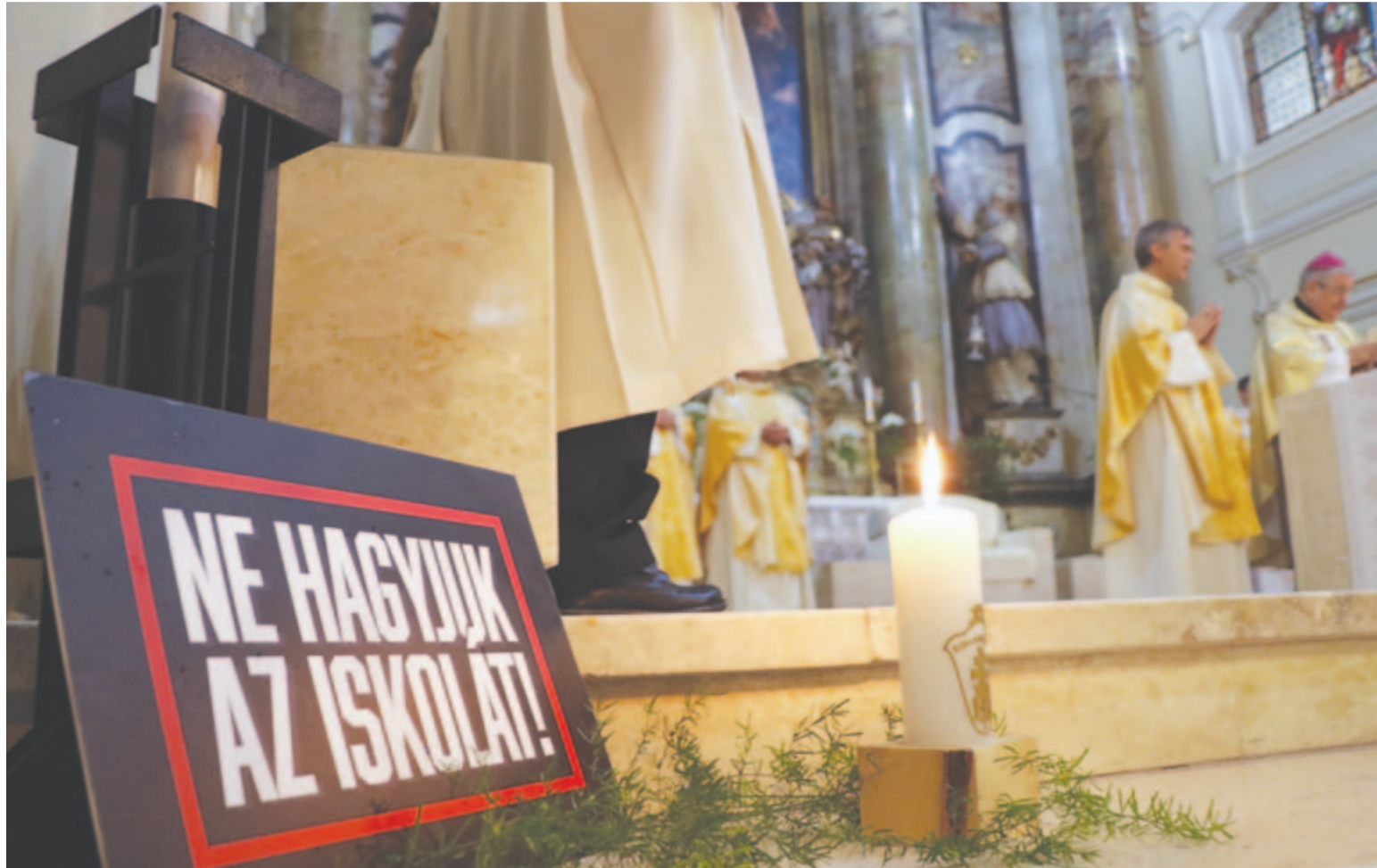
Tanévnyitó a katolikus iskolában 2018-ban