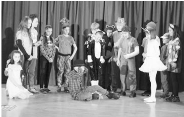
Megyénk diákcsoportjai is kitűnően alakították a sepsiszentgyörgyi színpadon