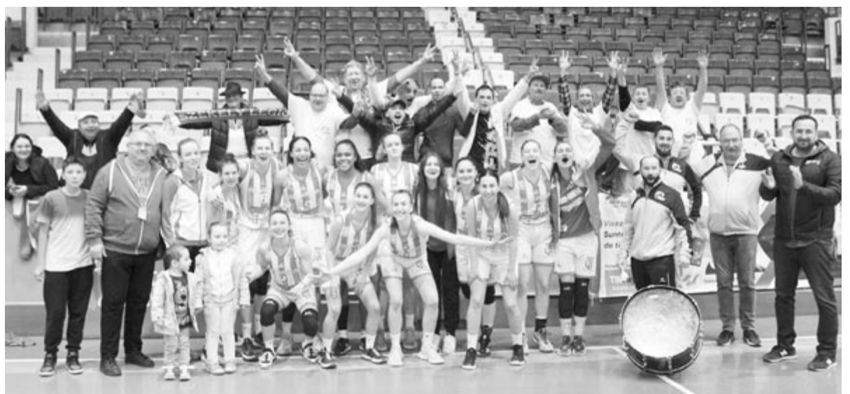
A Sirius játékosai, vezetői, szurkolói ünneplik az 5. helyet

Az FCC Arad nyerte a női kosárlabdabajnokság döntőjének harmadik mérkőzését a Sepsic SIC ellen. Kedden Aradon 67:61-re győztek a házigazdák a címtartó bajnok háromszékiek ellen, a negyedik találkozót tegnap, lapzártá után rendezték. A három győzelemig tartó párharcban a sepsiszentgyörgyi együttes 2-1-re vezetett.