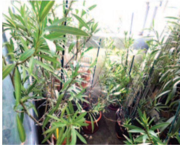
Fényre vágynak a leanderek