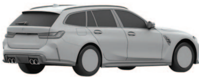
BMW M3 Touring hátulról