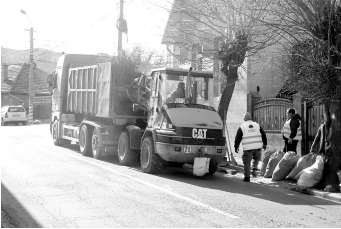
Tavaszi nagytakarítás Marosvásárhelyen