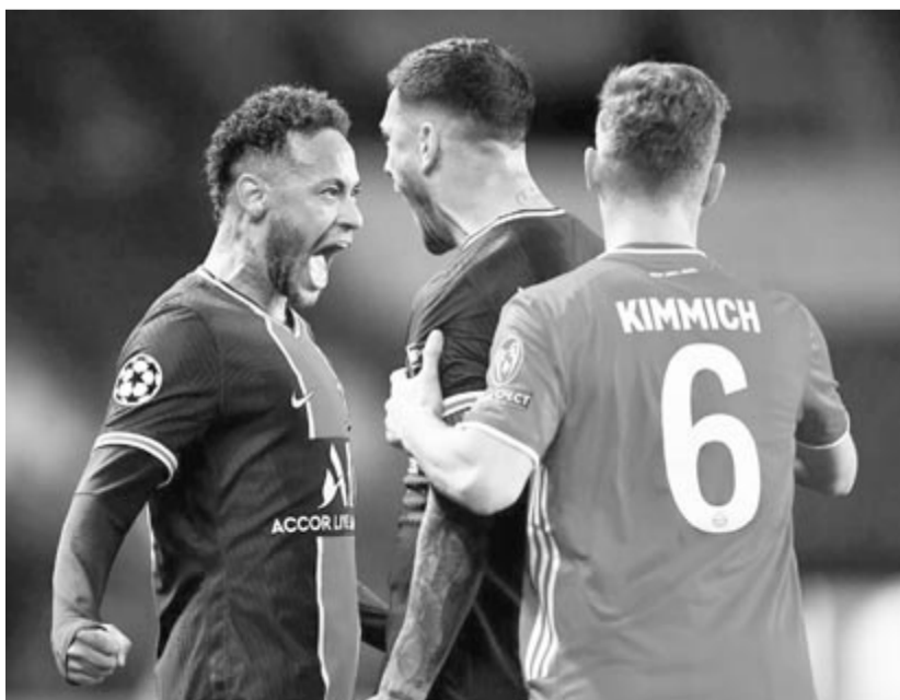
Neymar (b) vezeti a rangsort, nem is kevéssel