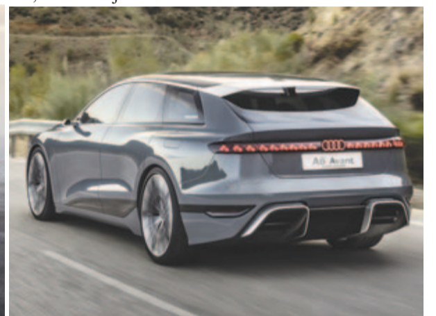
Forrás: Audi Audi A6 Avant E-tron hátulról

Az M3 Touringot teljes egészében a jelenlegi sportszedánra alapozták, műszaki értelemben nem is lesz semmiféle eltérés. A pletykák alapján mindössze annyi lesz a különbség, hogy a kombi változatot kevésbé lehet majd konfigurálni, a jelenlegi információk alapján csak Competition kiadás – azaz a legerősebb változat – fog készülni belőle, és ehhez társul az összerakékhajtás és az automata váltó. Azaz hajtáslánc tekintetében nem lesz választása a vevőknek. Tehát olcsó biztosan nem lesz, nem mintha az M3 alapváltozata arról lenne híres, hogy előnyös áron meg lehet vásárolni.