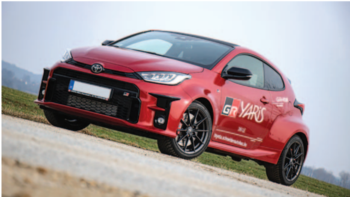
Toyota Yaris GR