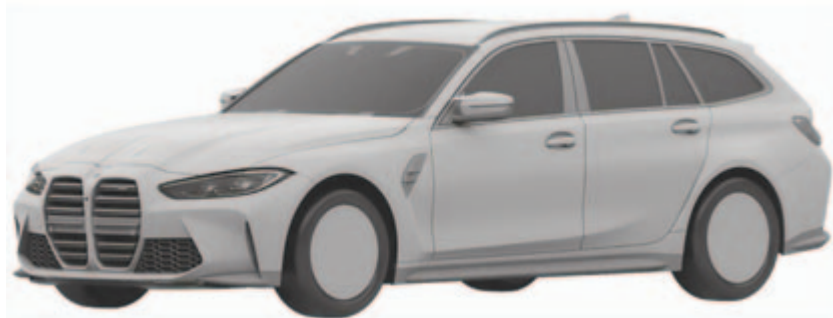
BMW M3 Touring elöl

Az Audi azt sem titkolta, hogy mikorra kerülhet a kereskedésekbe az autó. A sorozatgyártású modell – amely a gyártó szerint közeli rokonságot fog ápolni a most bemutatott koncepcióautóval – 2024 első negyedévében érkezik meg. Árakról egyelőre nem beszéltek, de az most még amúgy is túl korai lenne, hiszen még közel két év van a piacrak dobásig. A jelenlegi helyzet pedig még tovább képes bonyolítani az árképzést.