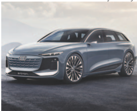
Audi A6 Avant E-tron elöl

A tanulmányt kétfokozatú kialakításban álmotdák meg, azaz előre és hátra is jut egy-egy villanymotor. Az összteljesítmény 476 lóerő, és maximálisan 800 newtonméter képes leadni az autó. Az akkumulátor méretéről egyelőre nem közöltek pontos információkat, csak annyit engedtek sejteni, hogy 100 kWh körüli akkucsomaggal szerelik majd az A6 Avant E-Tront. Ez kivitelről függően akár 700 kilométeres hatótávot is jelenthet a WLTP ciklus szerint mérve, ami a valóságban általában kevesebb, de 500-550 kilométer körüli egy feltöltéssel