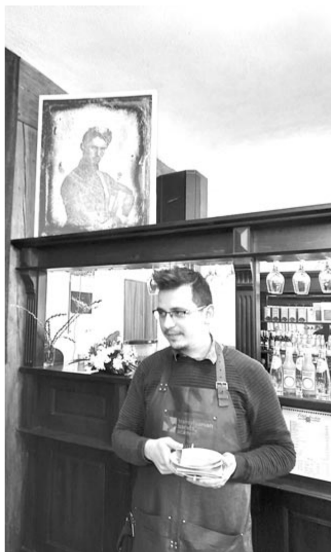
Március 14-én a marosvásárhelyi Petőfi kávézóban

Mint a szervezők hangsúlyozzák, a sokszínűség visszaköszön a kiállított alkotásokban is, hiszen a látogatók egyaránt találkozhatnak interaktív, kísérletező jellegű alkotásokkal és olyanokkal, melyek a videóinstalláció és a konvencionális grafika ötvözéséből jöttek létre. Mindezek mellett többször köszön vissza a vásznáról az ősfényképnek nevezett Petőfi-dagerrotípia, ugyanakkor egyes alkotók átvitt értelmezésben, absztrakt festmények, fotográfia, szobor vagy éppen faliszótt formájában asszociálnak Petőfi egy-egy költeményére – szól a közlemény az április 23-ig látogatható kiállításról.