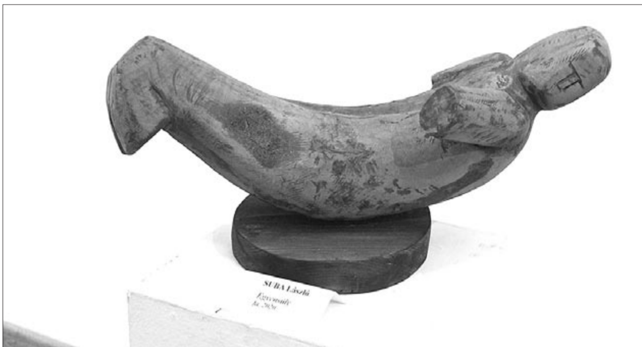
Suba László: Egyensúly (2020)

*Köszöntjük a Kossuth-díjjal kitüntetett költőt