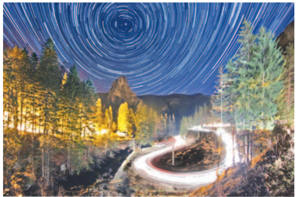
A Békás-szoros éjszakája