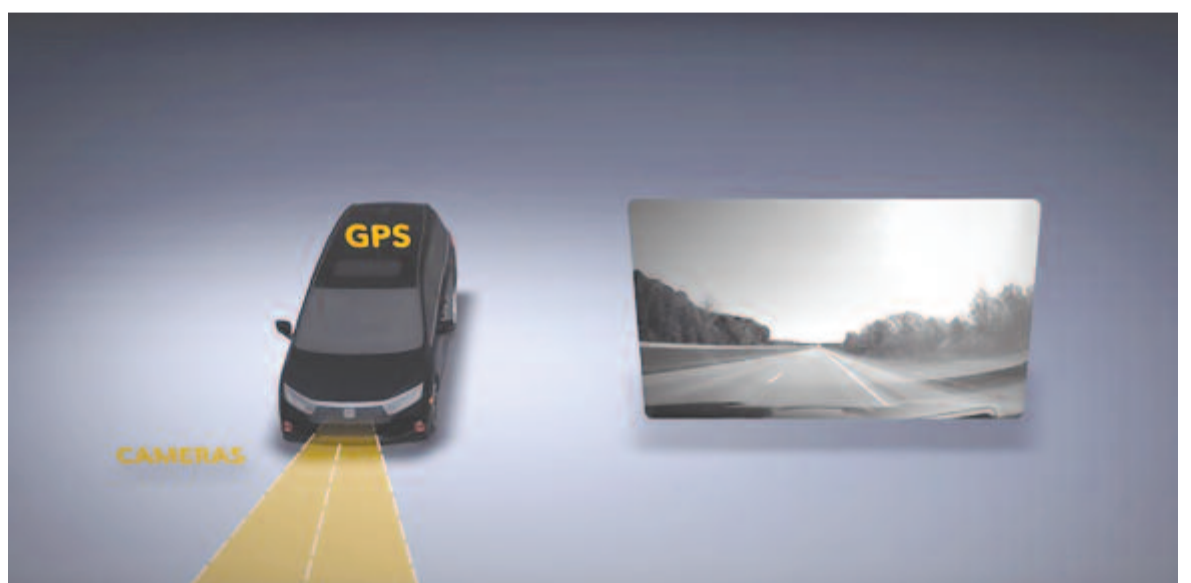
Útfestésfigyelő szoftver, illusztráció

A Honda egy újabb zseniális ötletet valósít meg, igaz, egyelőre csak kísérleti jelleggel. Ohio állam közlekedési minisztériuma és a Honda amerikai kutatóközpontja egy új útvizsgáló módszert próbál ki. A legjobb az egészben, hogy ehhez olyan eszközre van szükség, amely a modern autók nagy részében már megtalálható: a kamera. A szoftver a kamerák képét elemezné, és ahol a kamera képe alapján úgy ítéli meg, hogy halvány a festés vagy lekopott, fotókat készít, és a fedélzeti navigáció GPS-adatai segítségével jelentést készít. Ezt névtelenül feltölti egy rendszerbe, amelyhez csak az útfenntartók és a