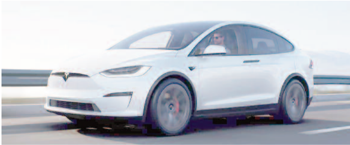
Tesla Model X