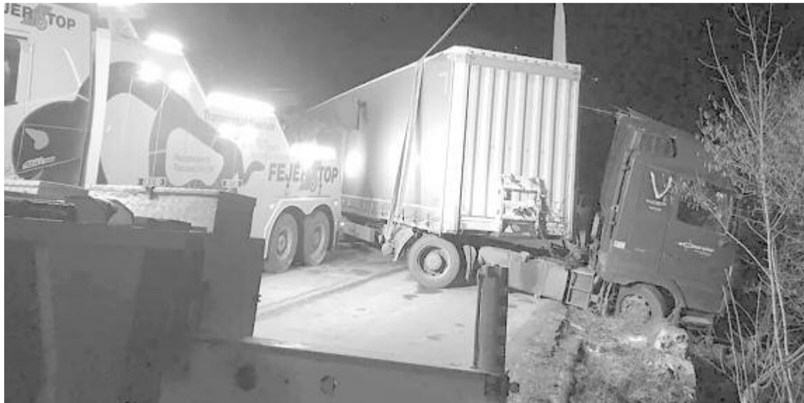
Téli gumi nélkül közlekedett a kamion

Az állami költségvetés bevételét 4,6 millióval emelték Tízezernél több új évi bírság