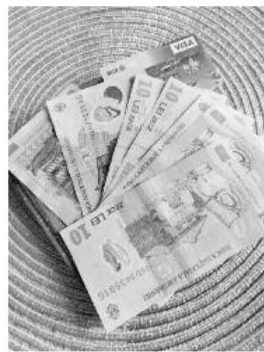
emelték. A pénzügyminiszter bejelentette, hogy emelni fogják a nyugállományú katonák speciális nyugdíját is. (szer)

Az Országos Nyugdíjpénztár közleménye szerint a legkisebb öregségi nyugdíjak 1.000 lejre nőnek. Az 1.600 lejnél kisebb összegű havi ellátmányban részesülő kisnyugdíjasok pedig januárban 1.200 lejes egyszeri támogatásban részesülnek. Év elejétől a nyugdíjpont értékét 1.442 lejről 1.586 lejre