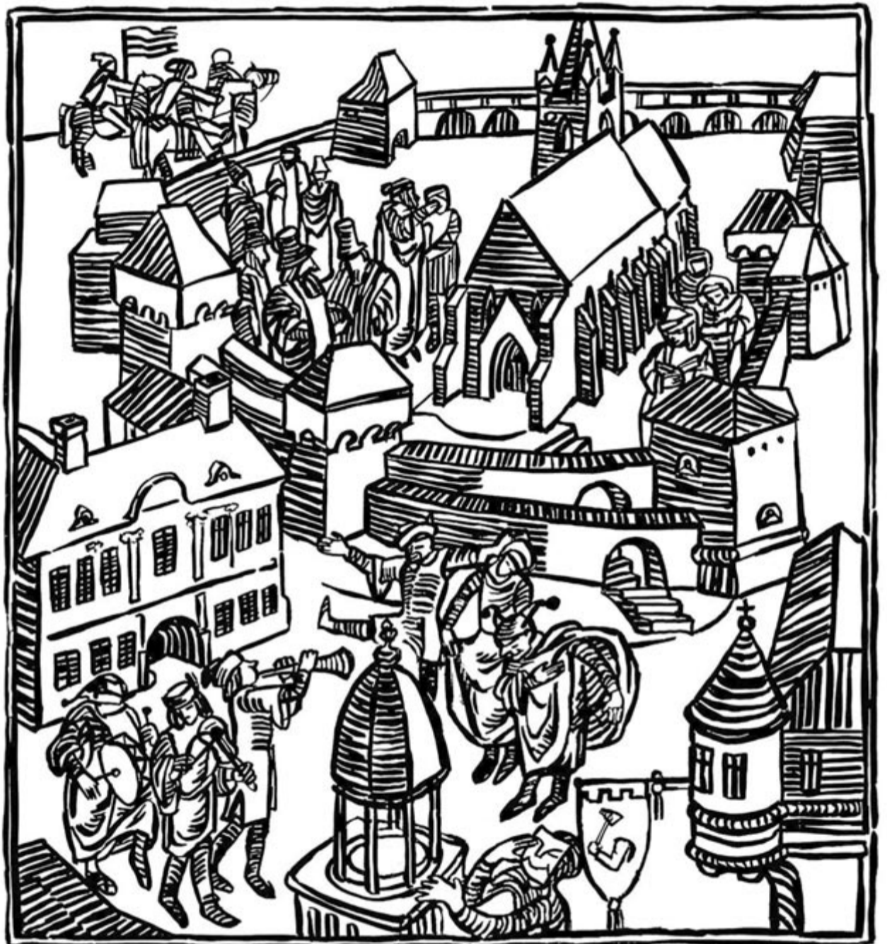
A régi Marosvásárhely... Z. Erdei Anna grafikája

*Gratuláció a frissen kapott Baumgarten-émlékdíjhoz!