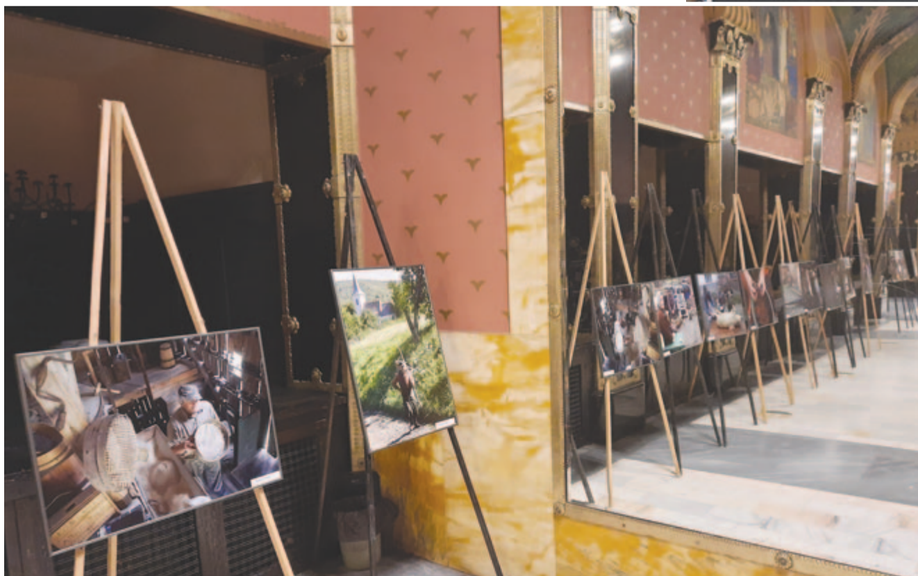
Tükör által sokszorozva