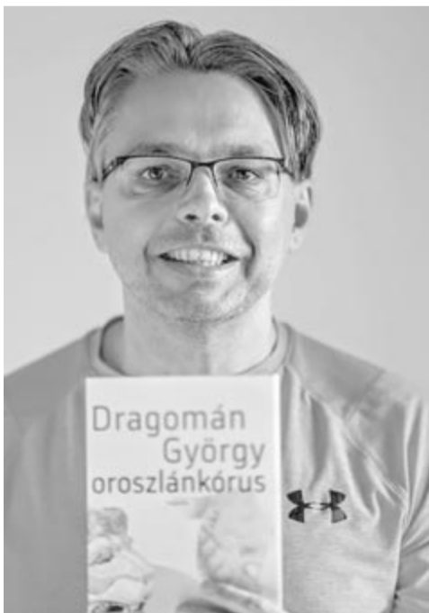
A szerző sokadszor újranyomott kötetével