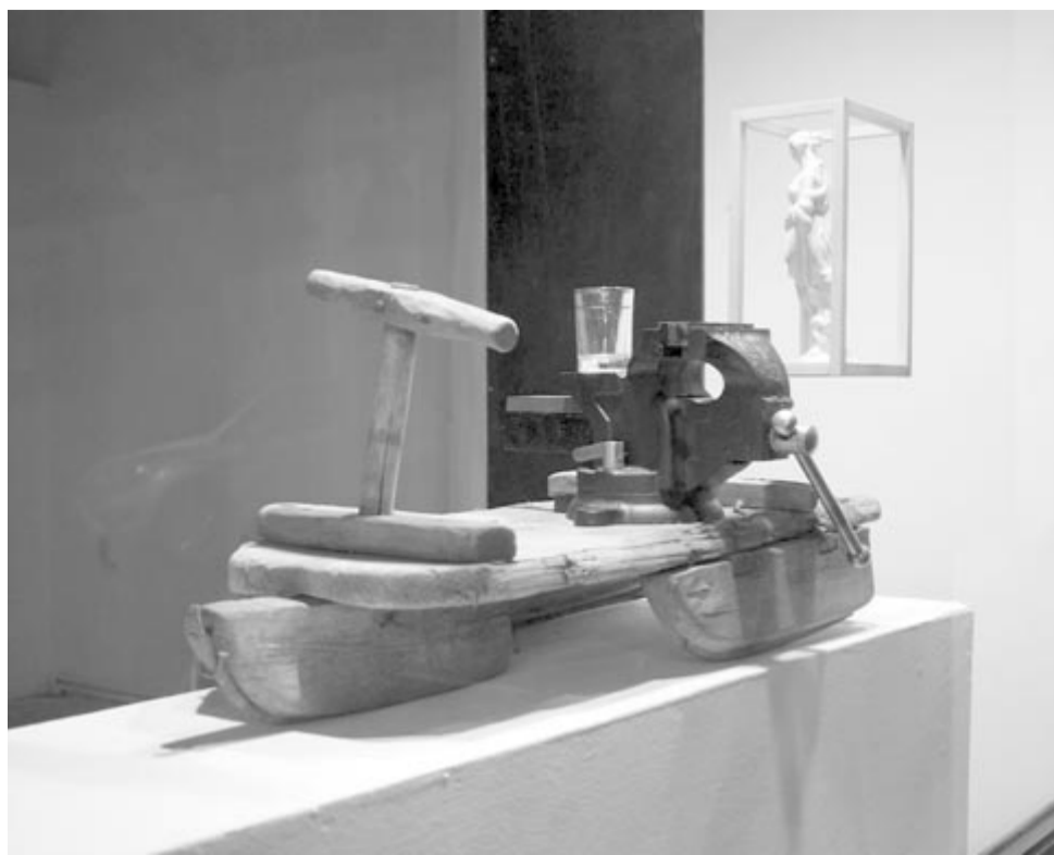
Ferencz S. Apor munkája

A karácsonyi ünnepkör témája a kortárs művészetben meglehetősen elhanyagolt, óvatosan kezelt, már-már tabunak számít. Mindez annak is köszönhető, hogy a téma bizonyos értelemben „elkoptott”, kisajátította a fogyasztás és a reklámpia: a mindennapi vizuális terünkben az ünnepek idealizáltak,