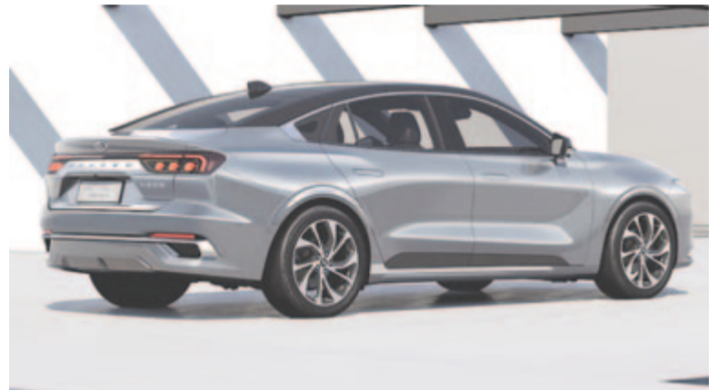
Changan Ford Mondeo – hátsó rész