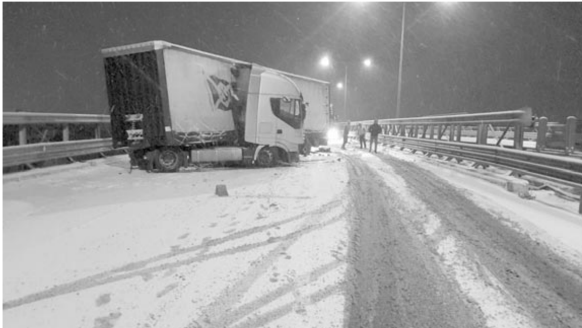
A kisodródott teherautó elhasznált gumikkal közlekedett