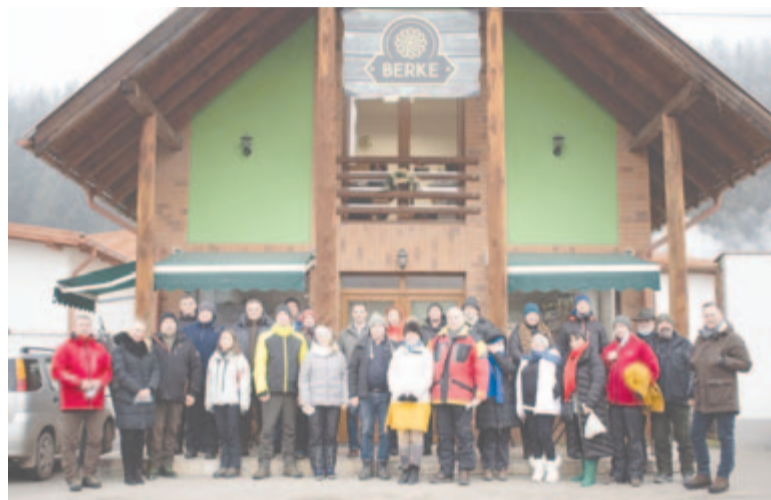
Az ivói Berke húsfeldolgozót is felkeresték a szakmai program során

Azért döntöttek közös rendezvény mellett, mert több olyan meghívottjuk volt a Kárpát-medencéből, akikkel találkozni, értekezni kell mindkét térség gazdáinak, gazdaszervezeteinek, ezért érdemesnek tartották egy nagyobb lélegzetű találkozó megszervezését. A rendezvényt Zeterváralján kezdték, majd a találkozás öröme után a Madarasi Hargita 1801 méteres fagyos csúcán imádkoztak az új évről a résztvevők, ezután szakmai