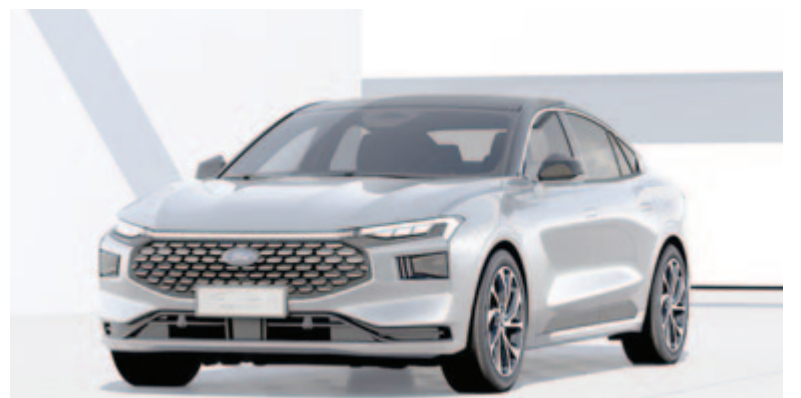
Changan Ford Mondeo

Műszaki adatokat egyelőre nem közöltek, így csak sejteni lehet,