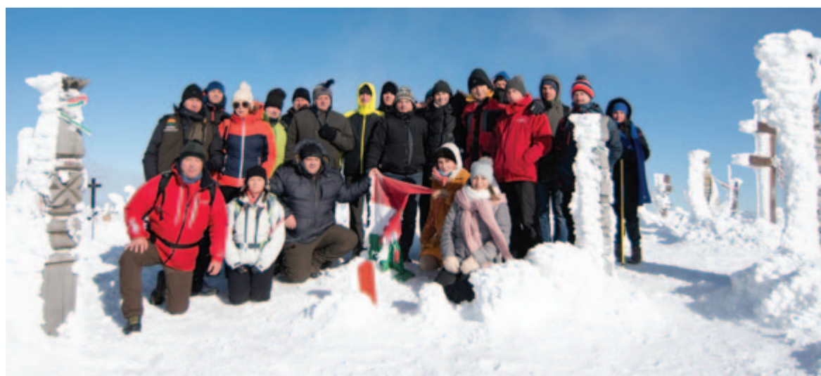
A Madarasi Hargita csúcására is kilátogattak a vendégek