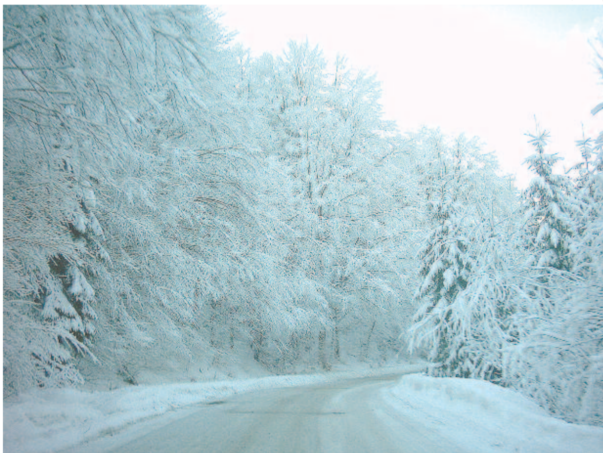
„Országuton is csak az jár mostan, akit Isten átka kerget”