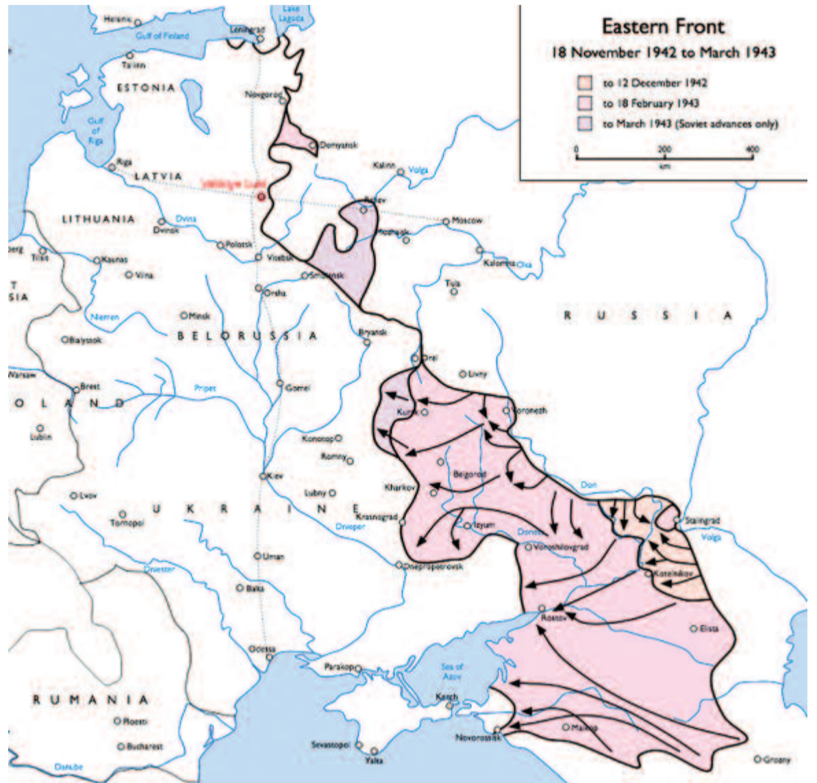
A keleti front 1942 novembere és 1943 márciusa között

során elesett, megsebesült és fogóságba esett honvédek és munkaszolgálatosok száma mintegy 125-130 ezer (pontosabb becslés szerint 128 ezer) főre tehető. Közülük 49-50 ezren estek el, és csaknem ugyanennyien sebesültek meg, a hadifogságba esettek száma pedig 27-28 ezerre tehető. Közülük kevesen térhettek vissza, a legtöbben már a hadifogolytáborba szállításuk közben meghaltak, becslések szerint pedig mindössze 3-4 ezren élhették túl közülük a megpróbáltatásokat. Az anyagi veszteséget 70 százalékban, ezen belül a nehézfegyverzetét csaknem 100 százalékban állapították meg. (MTI)