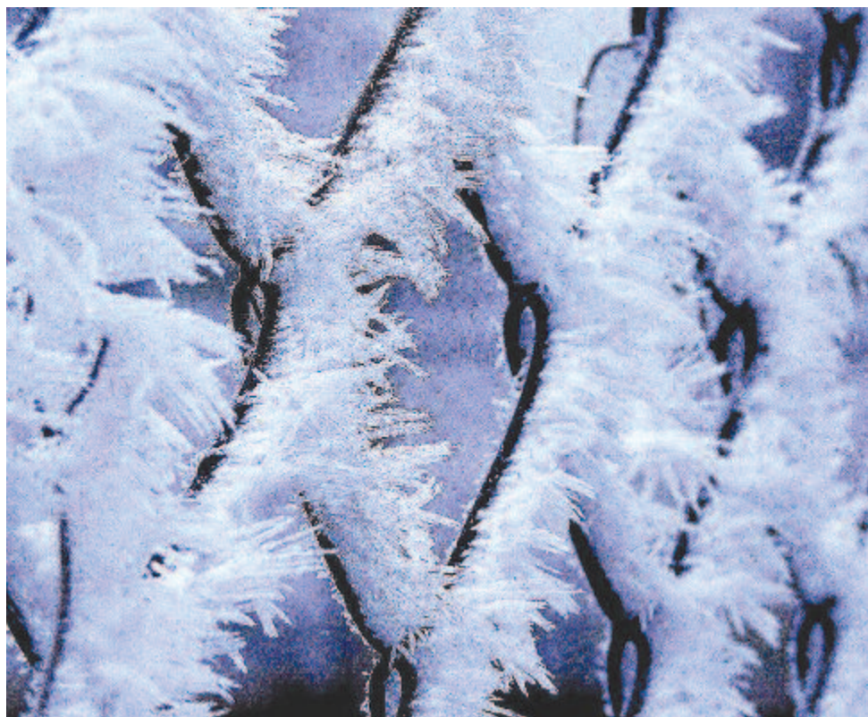
„Zúzmará – a szeszélyes télnek dús virágu lombja”

Benedek Elek et 1902-ben arra kérték, hogy sorolja fel legkedvesebb olvasmányait. Az írni-olvasni tudó székely határőr család 1859-ben született sarja három meghatározó serdülőkori olvasmányát említette. Elsőnek sorolta az 1859-es István bácsi kalendáriumát , amelynek „jóízű, becsületes, tanulságos történeteit” sokszor elolvasta. A nagy világegés után szülőföldjére hazatért író 1920-as önéletrajzában, az Édes anyaföldemben újra idézte mint az egész család kedves, agyonolvasott könyvét. Edesapja különös megbecsülésének jeleként be is költette. Mayer István , a derék esztergomi kanonok szerkesztette ezeket a kalendáriumokat, amelyek – Elek apó szavával élve – tele voltak a falusi népek való „Egy ballépés ezer bajt hoz” s efféle hasznos erkölcsös történetekkel. Kioktatott arról, hogyan kell a fagyott embert életre keltetni; szívrehatóan prédikált a pálinkaivás szomorú áldozatairól, s örök időkre emlékezetembe vésődött ez a verse: A pálinka gonosz ital.