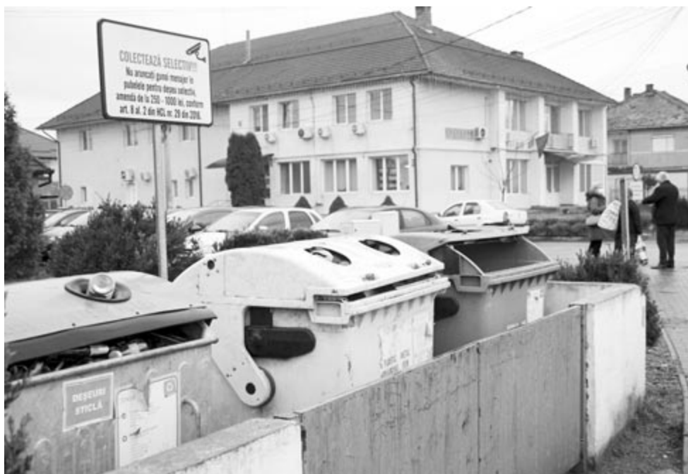
Marosszentannán felszámolják a szelektív gyűjtőpontokat