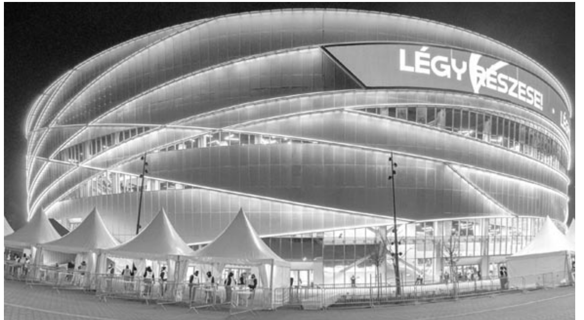
Az újonnan átadott Budapesti Kézilabda Aréna 2021. december 16-án. Az 50 ezer négyzetméter alapterületű, 20 022 ember befogadására képes multifunkcionális csarnok 27 hónap alatt épült fel.

Ez lesz a 13. kontinenstorna, amelyen a magyar csapat is részt vesz, de az első férfi felnőtt világverseny a sportágban, amelynek – részben – Magyarország ad otthont. Az eddigi legjobb Eb-szereplés az 1998-as hatodik hely volt, legutóbb