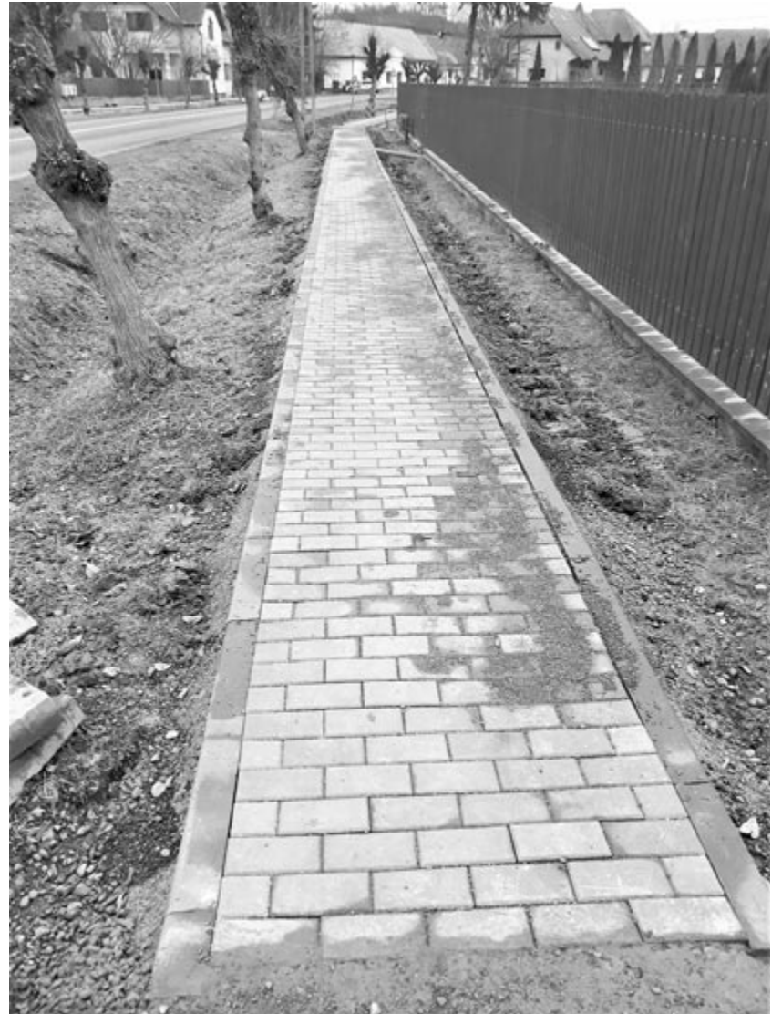
Mintegy félmillió lejt szántak arra, hogy néhány hónap alatt megépüljön másfél kilométer járda

Az is gondot okozott, hogy a községben még nincs sem szennyvízcsatorna-, sem ivóvízhálózat kiépítve, ezek kialakítása előtt nem igazán üdvös járdát építeni. Ezzel a községvezetés is