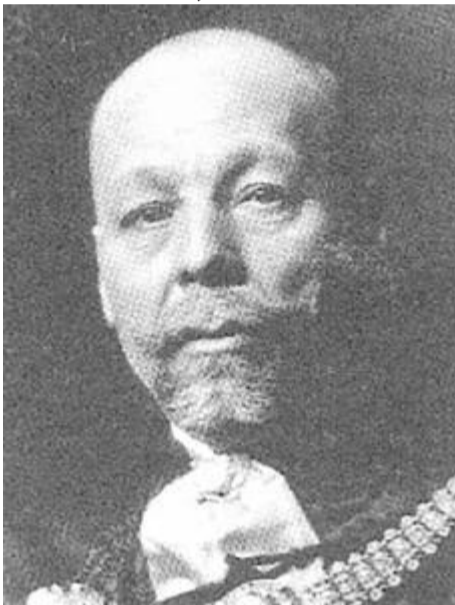
Gál Sándor (1855–1937), a képviselőház elnöke (1909–1910)

tus 17-én, Erősdöt védelmezve, három oldalon egydolgozatnyi cikket írt a becsületbíróság döntéséről. A Pesti Napló ugyanezen a napon ezt az eljárást a demokrácia arculcsapásának nevezte. Erősdöt védelmezve vélekedett a Népszava, Az Est, a Polgár, a Pesti Hírlap és a Független Magyarország is az említett napon. Augusztus 18-án a fővárosi és az erdélyi lapok Erősd diszkvalifikálásáról írtak. E döntés miatt Erősd Budapestre utazott, beadta lemondását, de a belügyminiszter nem fogadta el, mert egy becsületbírósági döntés nem érvénytelenítheti a főispáni kinevezést. (205) Erősd a Budapesti Tudósító munkatársának a becsületbírósági döntés után a következőképpen nyilatkozott: