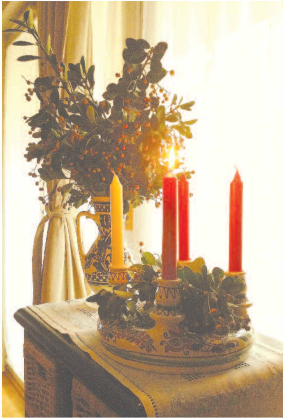
Az első adventi gyertya 2021

Mindkettejüknek tanártársa volt az 1901. november 28-án született meteorológus, klimatológus Simor Ferenc . 1923-tól Pécsen tanított az egyetem Földrajzi Intézetének külső munkatársaként. Magyarország búza-, rozs-, kukorica- és burgonyatermesztése és az időjárás közötti összefüggéseket kutatta. 1940-ben a pécsi egyetem földrajzmagántanára volt, majd rövid ideig Kolozsvárott ta-