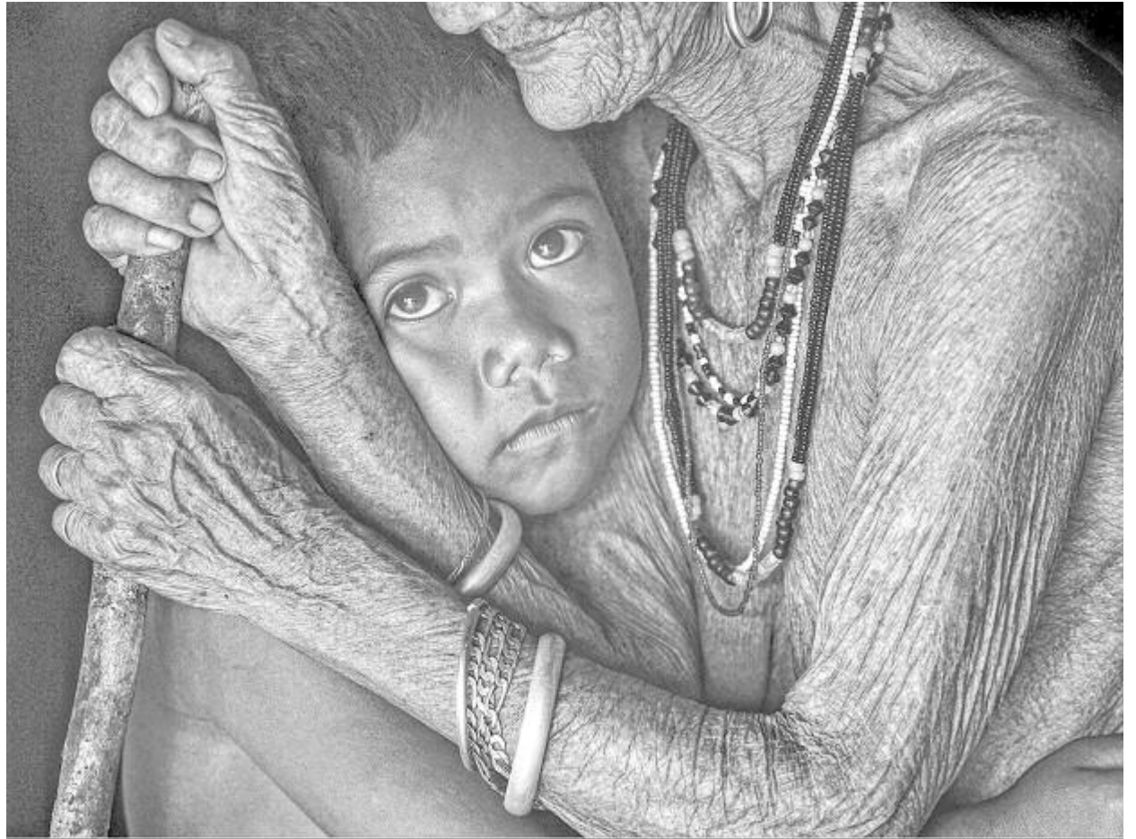
Le Chau Dao: Look art