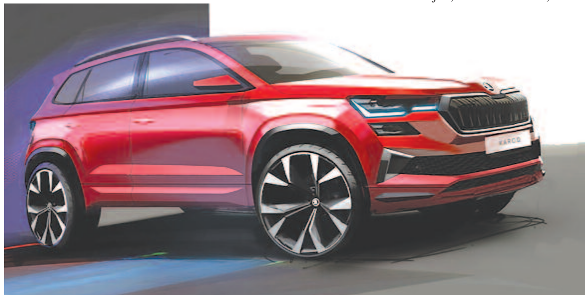
Új Skoda Karoq, vázlat

A hiány tehát feltételezhetően csak valamikor 2022 végén oldódik meg. Ha igaz ez a feltételezés, a gyártók sokat fognak még szenvedni, az ügyfelekhez hasonlóan. Azonban ez a probléma más, komolyabb gondokat is eredményezhet. Ha nem gyártanak autót, számos munkaszerződést meg kell szüntetni, azoknak az embereknek nem lesz bevételük, tehát nem fognak tudni vásárolni, ami további munkahelyek megszűnéséhez vezet és így tovább. Ez az, amikor a kigyó a saját farkába harap. Jelen esetben egy újabb gazdasági világválság is