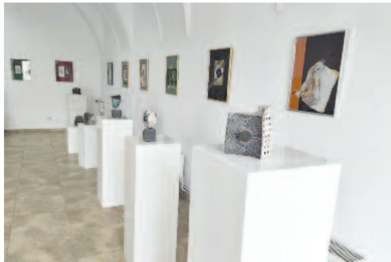
Nyitásra várva a nagyszebeni galériában