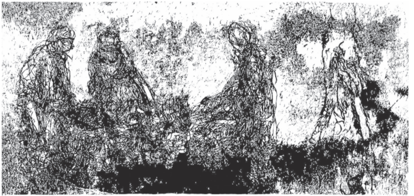
Partra vetett párbeszéd... Bugyi István linómetszete a grafikus honlapjáról

*105 éve, 1916. november 21-én született a költő