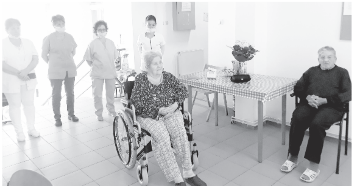
Az intézménynek elsősorban az idősek ellátásával kellene foglalkoznia, nem az anyagi háttér biztosításával – véli az igazgató