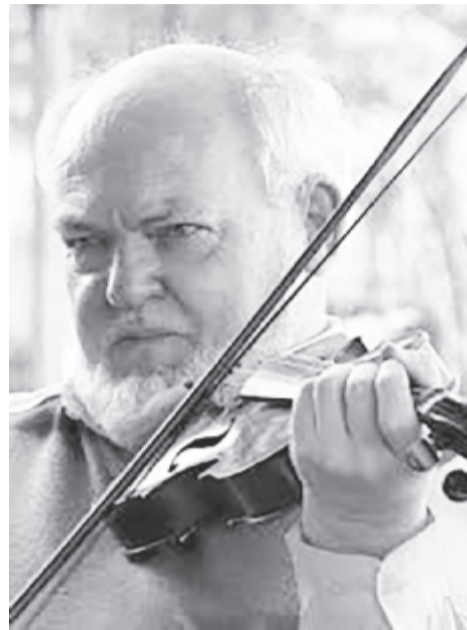
Az író hegedűvel. A harmadik pohár. Karcolatok, novellák című kötet borítóján

De immár kékelő derűvel elengedem. – Írásaid rövidek, tréfásak, szórakoztatóak, groteszkek, ugyanakkor a szatíra vitriolja is teszi a dolgát. Van ennek valamilyen „mü gondossággal” való magyarázata, vagy az író lényéből fakadó