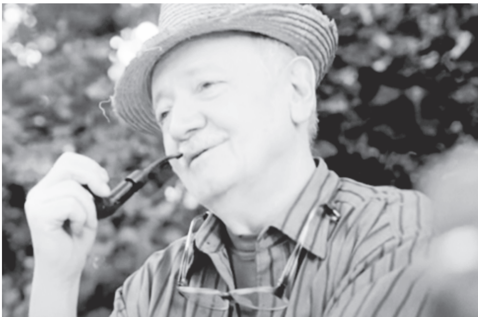
Tartott még a hosszú, forró nyár...

*Marosvásárhely, Nemzetközi Könyvvásár, 2021. november 11–14.