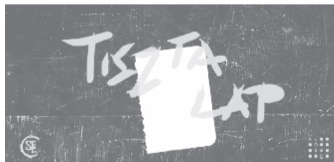
Az esemény borítóképe

lesz, ami a fizikailag is jelen lévő emberek számát illeti. Maga az esemény felépítése leginkább a workshopokhoz hasonlítható. A járvány előtt még tartottunk olyan előadásokat, ahol nagyobb közönség volt, több fellépő, és bárki szabadon mondhatott szöveget, ez lenne az Open Mic. De volt egy másik kategória is: a workshopok. Ezeknek az a lényegük, hogy együtt legyen a csapat, és új emberek csatlakozzanak, illetve közösen tudjunk fejlődni, szövegeket írni, különböző gyakorlatokat elvégezni. A mostani rendezvény elsősorban workshop lesz, tehát ott lesz a csapat, és új emberek jelentkezését is várjuk. Az est első felében a workshop lesz, a második felében pedig vagy a workshopon alkotott szövegeket fogjuk felolvasni, vagy bármilyen más szöveget, amit a résztvevők magukkal hoznak. Személyesen 25 személy lehet ott, de az est második felét online is fogjuk közvetíteni a Slam Poetry Marosvásárhely Facebook-oldalán. Kiemelném, hogy a zöldigazolványt kötelezően fel kell mutatni a bejáratnál. A létszám tehát