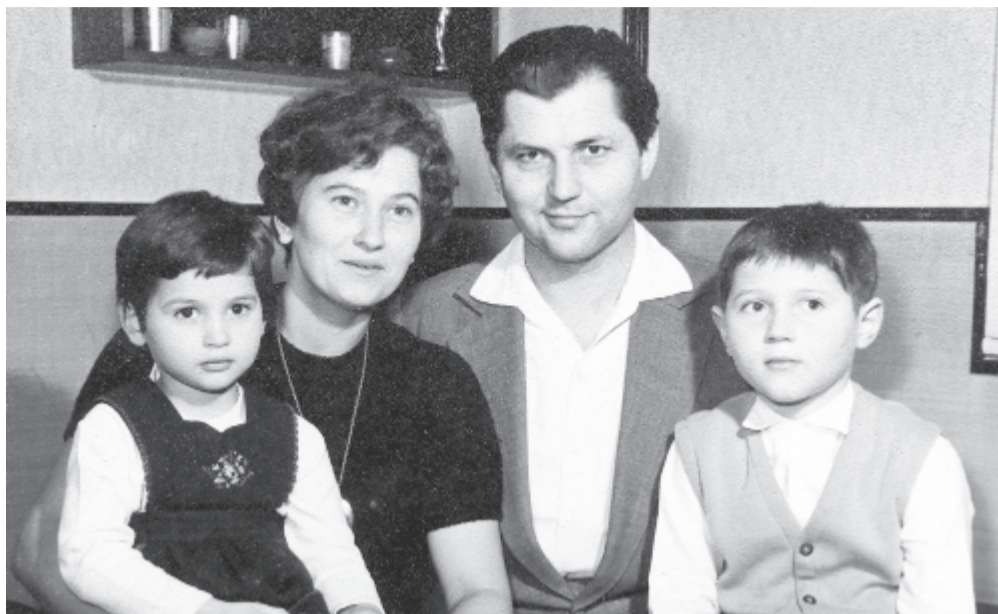
Családi kép 1964-ből

ő, köszöntem neki, és siettem tovább, hogy minél kevesebbet késsek, hagytam, hogy rossz lábaival, botjaira támaszkodva jöjjön utánam. Mindmáig szégyellem magamat emiatt. Lelkiismeretfurdalásomat is szeretném enyhíteni ennek a könyvnek a megírásával.” (A könyv címe: Györgyi Géza, egy kivételes elméleti fizikus életpályája – az itt közölt képek is ebből a műből származnak.)