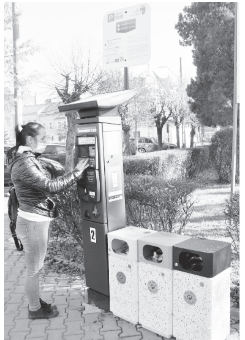
Nemrég parkolójegy-automatákat helyeztek ki a városban

– Ahogy a bürokrácia hátráltatja a munkánkat, az az érzésem, hogy kevés az idő a nagy tervekre. Mintha a közbeszerzési és egyéb hatósági eljárásokat, engedélyeztetési procedúrákat azért találták volna ki, hogy fékezze a helyi közigazgatási munkát. A város központjának az átalakítása is olyan elgondolás, amelyet nem hiszem, hogy ebben a mandátumban megvalósítható. Az új városi kórház tervének a dokumentációi is elkészültek, de valószínű, hogy ennek a kivitelezéséhez sem lesz elég a három év. Bizom abban, hogy az irányó, a célokat kitűztük. Négy év kevés a kampányprogramban ígért betartásához, de az egy év bizonyította, hogy ha ilyen ütemben haladunk, a helyi tanáccsal, a civil szervezetekkel és a városlakókkal közösen sok mindent megvalósíthatunk a szászrégeniek érdekében.