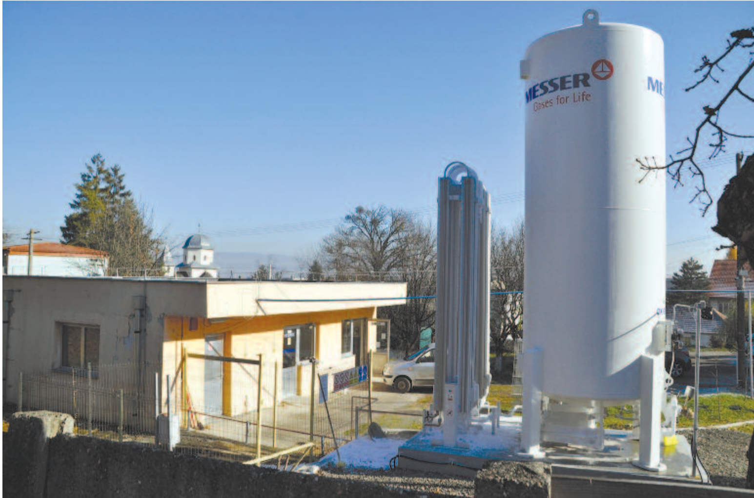
Az új oxigéntartály a városi kórház udvarán