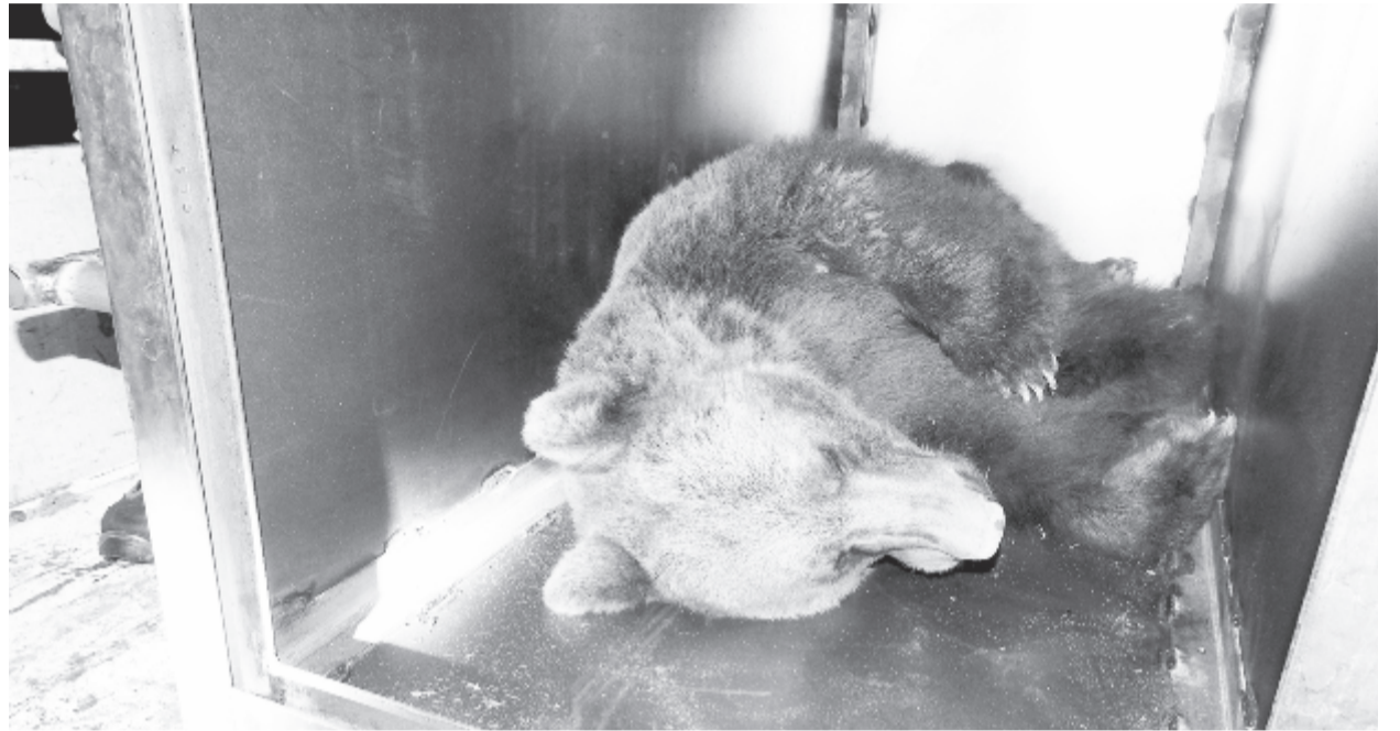
Egy anyamedvét és két bocscát szállították el