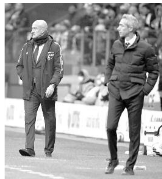
Marco Rossi, a magyar (b) és a portugál Paulo Sousa, a lengyel válogatott szövetségi kapitánya.

* Paulo Sousa (Lengyelország): „Több olyan játékosnak is lehetőséget adtunk, akik eddig kevesebbet játszottak, hogy felkészüljenek a nemzetközi mérkőzések magas színvonalára, de nem volt mindenki a legjobb formában, és nem is értették meg egymást kellőképpen a pályán: ebben fejlődniük kell! Rosszul érintett, sőt meglepett a mai eredmény, amelynek nyomán kissé nehezebbé vált a dolgunk a pótselejtezőn, de bárhogyan legyen is, biztos vagyok a vb-kvalifikációban. Nem vagyok olyan kapitány, aki félne a döntések meghozatalától, és változatlanul úgy érzem, hogy a mai mérkőzés lehetőség volt arra, hogy előre léphessünk, Lewandowski és Krychowiak hiányában is. Lewandowski mellőzéséhez ugyanakkor a Bayern Münchennek semmi köze. Nem a klub hozta meg a döntést! Én vagyok a kapitány!”