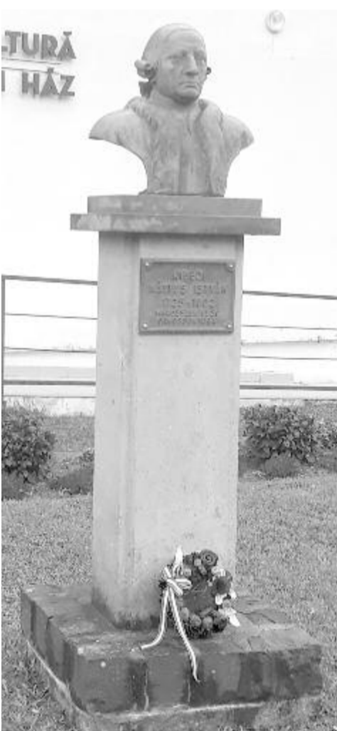
Mátyus István emlékének Kibédén emléktáblák, iskola és mellszobor is őrzi

Mátyus István 1725-ben született Kibédén, az itteni református iskola diákja volt, felsőbb iskolai tanulmányait Marosvásárhelyen végezte a Református Kollégiumban. Többévi előkészület után 1754-ben külföldi tanulmányútra indult, az Utrechti Egyetemen (Németalföld) diplomázott orvosként, majd Göttingenben, Marburgban és Bécsben volt orvosi gyakorlaton. 1757-ben hazatért, Marosvásárhelyen telepedett le, Küküllő megye és Marosvásárhely első főorvosa volt. „Emberemlékezet óta előttem nem volt orvos” – írta egyik levelében. Hatalmas és sokrétű munkássága volt, orvosi munkája mellett egy rövid ideig törvényszéki munkát is vállalt, de az orvostan, a fertőzések, a gyógyítás és a táplálkozástudomány területén dolgozott, elérhetővé és megfizethetővé tette a gyógyulást a szegények számára is. Orvostudor, zseni, humanista, polihistor, enciklopédista és nyelvművelő volt egyszerre, aki fő művét az akkori kibédie és székely nyelvezet használatával írta meg. Eredményei nyomán Mária Terézia már 1765-ben „a közjó, a gyógyítás szolgálatában végzett munkássága elismerésül” nemesi rangra emelte a már lófő székely orvost. Mátyus nagyon ragaszkodott szülőfalujához, 1781–82-ben saját költségén megmagasította a kibédie templom falait és tornyát is. 1800-ban kelt végrendeletében 912 műből álló könyvtárát és nyomdáját (amelyen később Bolyai Appendixét is kinyomtatták) a marosvásárhelyi református kollégiumnak hagyta, és alapítványt tett négy kibédie