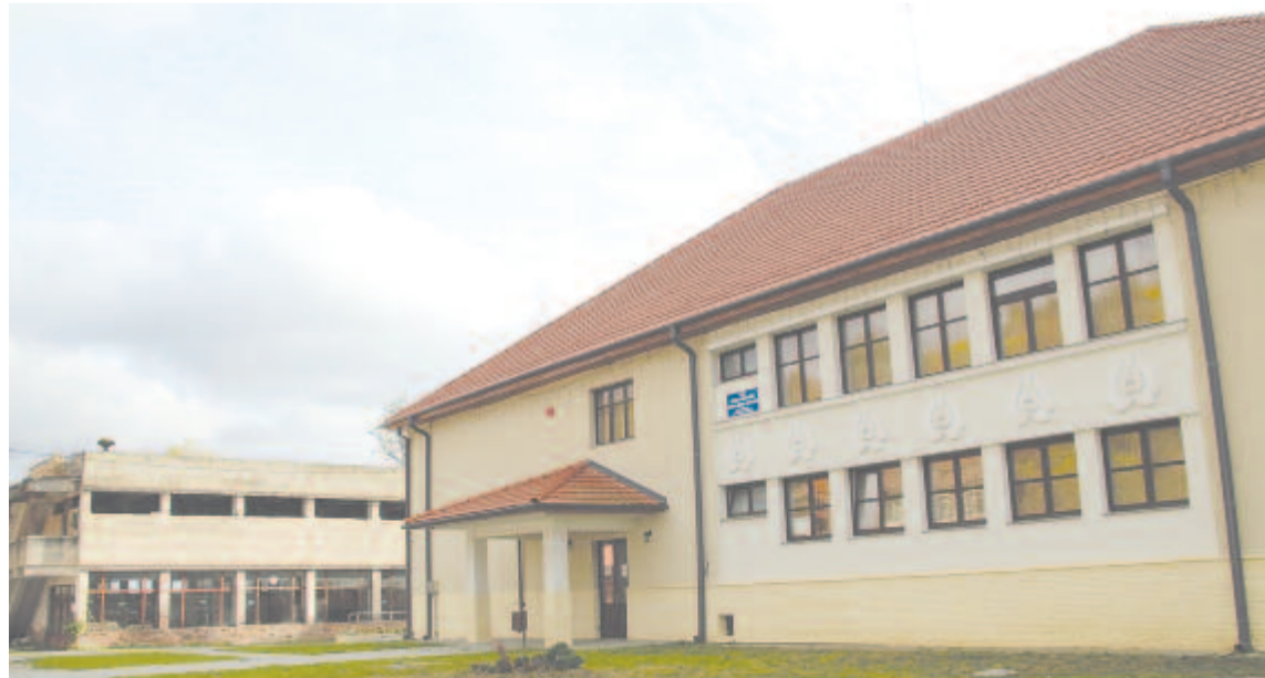
Avató nélkül nyílt meg a felújított kultúrotthon

„Szerencsések vagyunk, mert van hagyományos néptáncunk, népviseletünk mind Magyarosón, mind Selyében, és nekünk kötelességünk ápolni, továbbadni az értékeket a következő generációnak. Nem az a cél, hogy színpadra lépjünk, hanem az, hogy ismerjük meg kultúránkat. A legfontosabb az, hogy együtt legyünk és közösen értékeljük szellemi örökségünket” – mondta a polgármester.