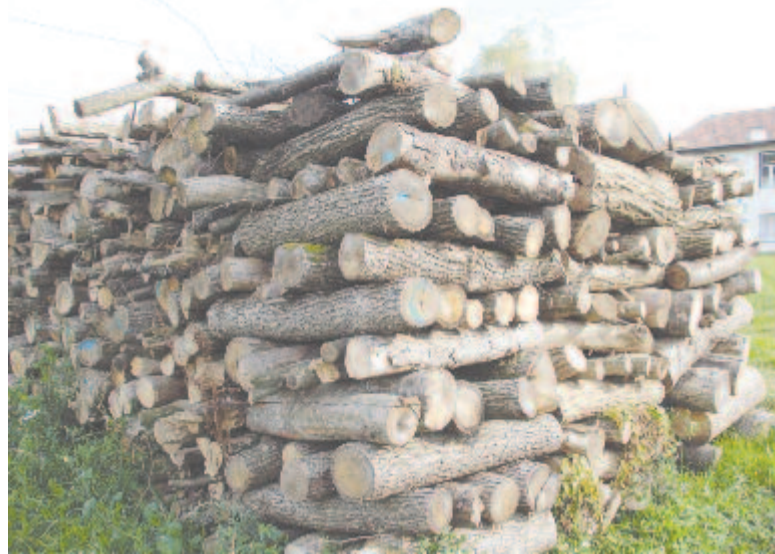
Még mindig fával tüzelnek, remélhetőleg nem sokáig

Annak ellenére, hogy a Nyárádszereda irányából érkező egyik fő földgázvezeték kútja Torboszló határában van, a községben nincs háztartási használatra szánt földgáz, az itt lakók még mindig fával fűtenek.