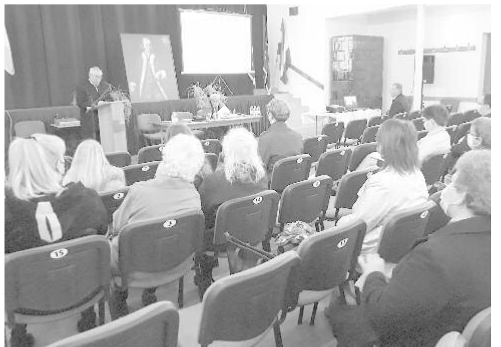
A járványhelyzet miatt igyekeztek idén megtartani a tavaly elmaradt emlékkonferenciát

hasson, míg ma a diákoknak nem kell ilyen áldozatokat hozniuk, és itthon, szülőföldjükön, anyanyelvükön tanulhatnak, hogy a társadalom hasznos tagjai lehessenek – mondta el lapunk az intézményvezető.