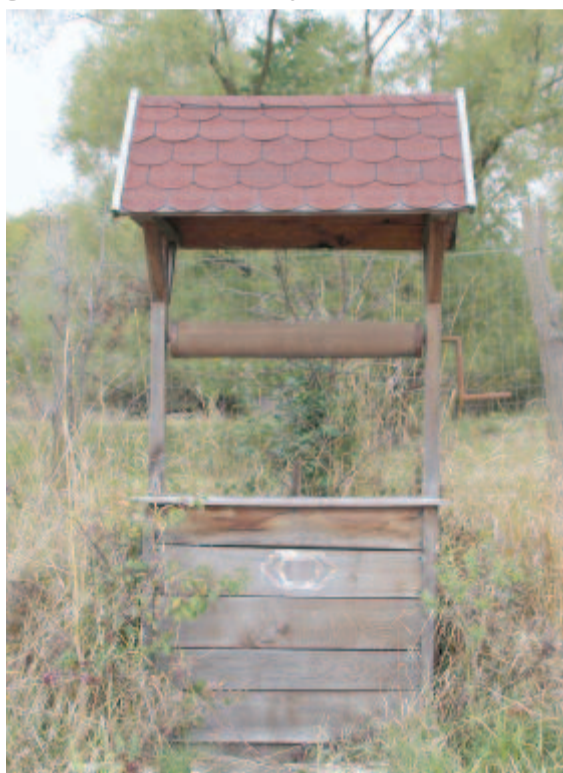
A kutakból időnként kiszárad a víz