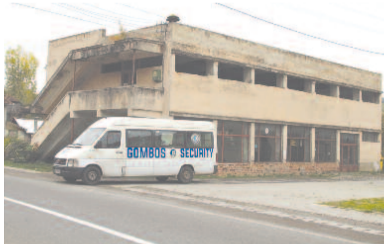
Parkolót létesítenének az egykori szövetkezeti üzlet helyén

Nyárádmagyarós központjának összképét a nemrég felújított és gyönyörűen kivitelezett kultúrotthon mellett egykori szövetkezeti áruház-ros épülete rontja. Az 1989-es változásokat követően nem sikerült új rendeltetést adni az ingatlanak, emiatt siralmas állapotba került.