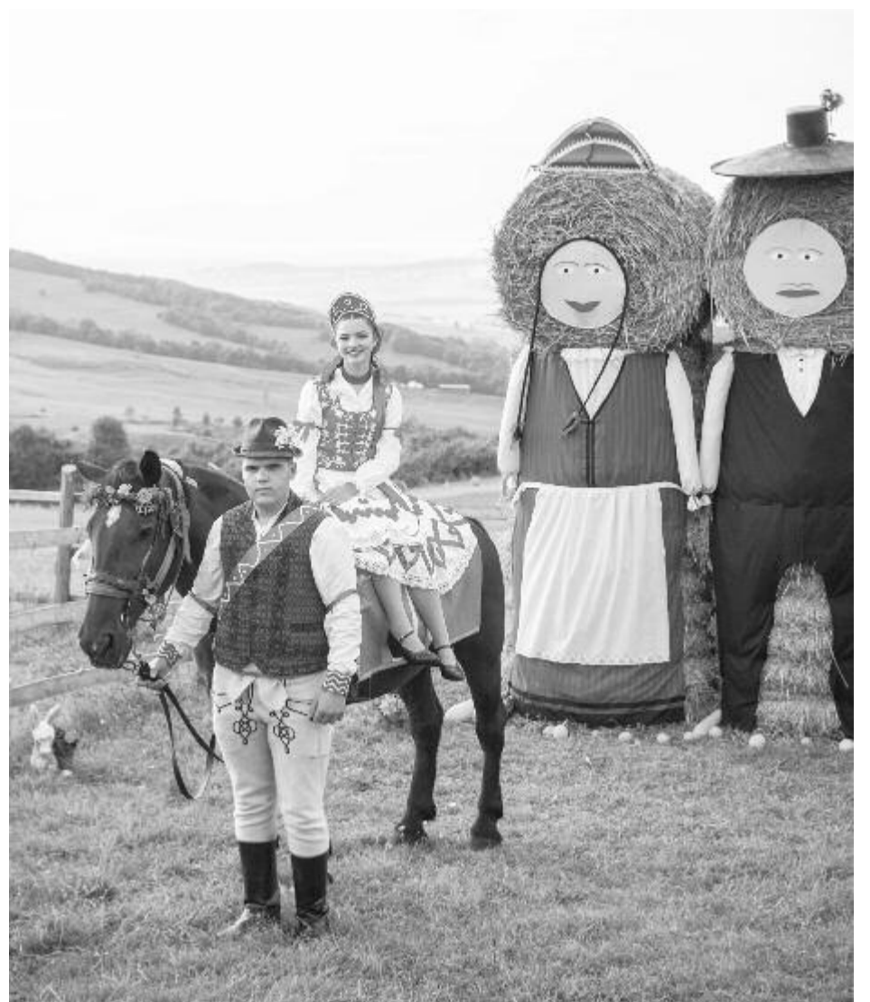
Selyében új nemzedék hozta vissza a régi hagyományt

A szokásos utcai felvonulás egyben hívogatás is volt az esti bálba, és mindenki kíváncsian állt ki a kapu elé megtekinteni a csőszpárok felvonulását, több helyen meg is kínálták őket. A felvonulás utáni szokásos emlékfotók a falu fölötti dombon készültek, ahol szalmabábukat „öltöztettek” be erre az alkalomra. Tavaly a rendőrség az utolsó pillanatban megtiltotta a szüreti mulatság megtartását a járvány miatt, s talán ezért is nagyon sok fiatal vett részt most a reggelig tartó bálban, ahol az LKL húzta a talpalávalót. A szervezők a szőlőkoszorút is magasra emelték, de a gerezdek árát is, ha netán valakinek mégis sikerülne le-