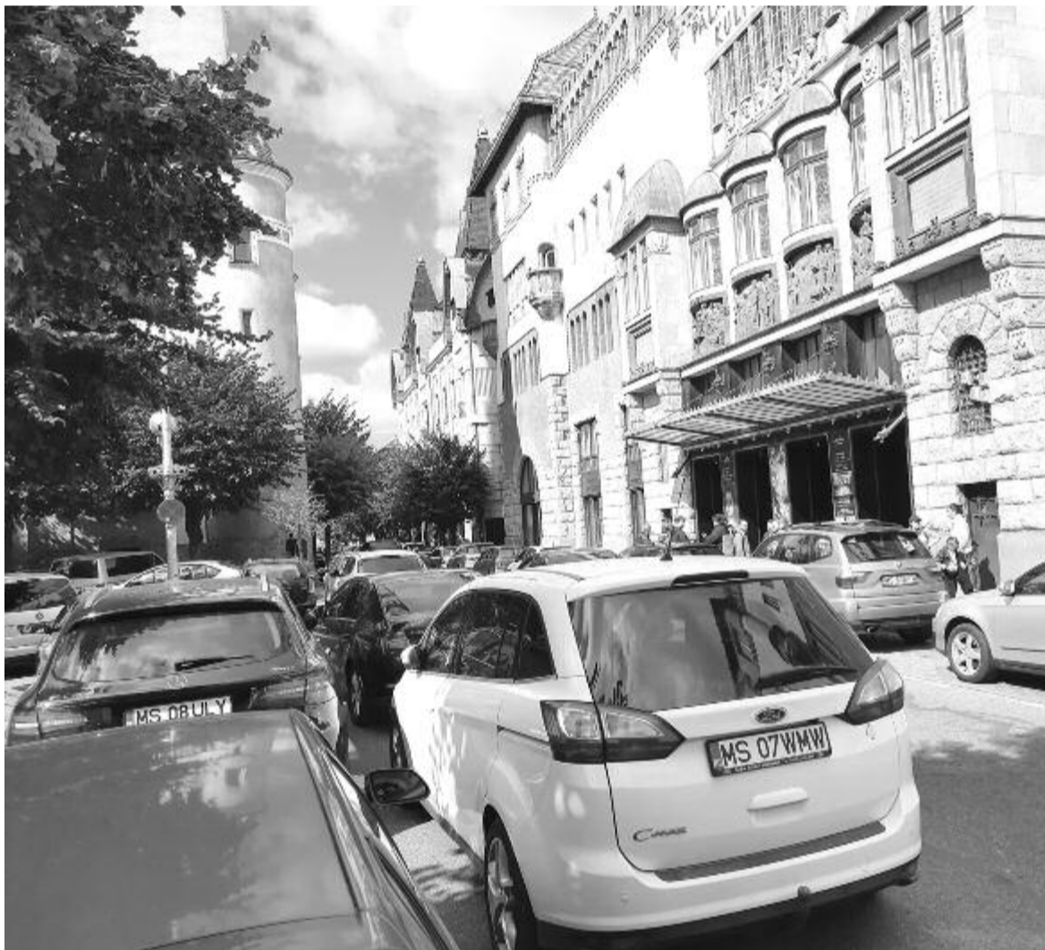
Enescu utcai káosz

A Népszavazás kérdésre válaszolva a polgármester elmondta, hogy a két utca és a polgármesteri hivatal előtti tér jövőre válik gyalogosövezetté.