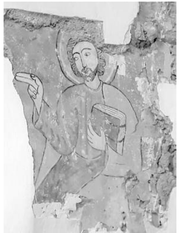
Még hátravan a költséges rész: a kazettás mennyezet és a freskók felújítása, megóvása

Végre az idén az egyházközségnek sikerült hároméves munka után telekeltetni a templomot és az 1896-ban épült parókiát, illetve a hozzájuk tartozó területet. Azonban az államosított ingatlanok visszaszerzéséért is meg kell küzdeniük. A református iskolát egy „ügybuzgó” magyar személy okán még nem sikerült visszaszerezni, egyelőre az önkormányzat tulajdonában van. Hallgatólágosan az egyház használja gyülekezeti teremként, ezt megelőzően ravatalozó működött benne, sőt egyesek halottasházá szerették volna átalakítani, de a megyei múzeum figyelmétetést küldött, miszerint a műemlék templom környezetében