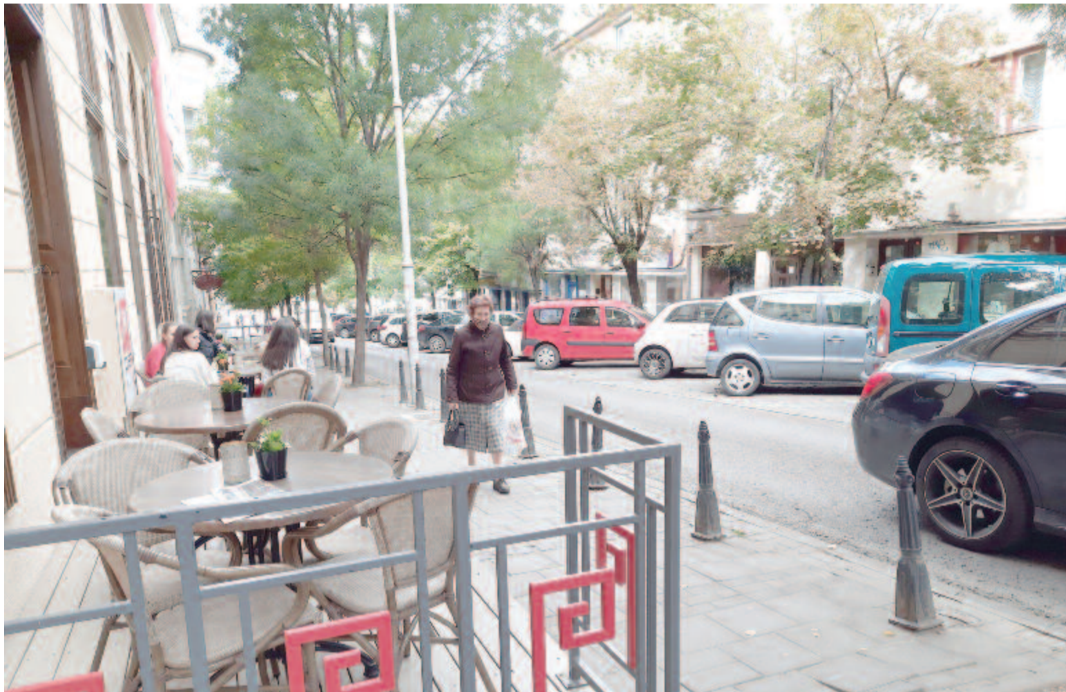
A Bolyai utca