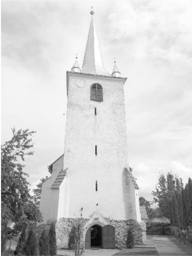
Szép eredményeket értek el az elmúlt fél évben, de még sok a tennivaló a templomnál

Hat és fél hónapi távollét után a tervezett dátumra, az augusztus 22-i confirmációra a református gyülekezet visszatérhetett a templomba, amelyet a tervezett felújítási és ásatási munkálatok miatt az év első részében el kellett hagynia. Mindenki örül ennek, bár a tervezett felújítások korántsem értek véget.