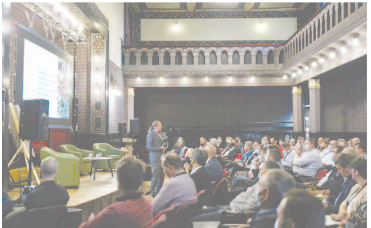
Előadás a gazdasági fórumon

kormány által kiírt budapesti pályázatokban is sok esetben részt tudnak venni. Ilyen például a Pro Economica Alapítvány által lebonyolított erdélyi gazdaságfejlesztési program is, ami szintén a magyar kormány támogatásával jön létre, de itthon is tudnak pályázni a cégek. Meglátásom szerint ezért jó újra magyarnak lenni, hiszen azontúl, hogy a nyelvünkben, az identitásunkban és a nemzeti büszkeségünkben eddig is biztosak voltunk, most már azt is látjuk, hogy gazdasági értelemben is a napi megélhetésünket két oldalról tudjuk ilyen szempontból biztosítani. Vállalkozóként nagyon fontos tényező az RMDSZ kormányzati szerepe, hiszen ennek köszönhetően van egy másik pillér is, ahova ezeket a kéréseket el tudjuk juttatni döntéshozói szintre.