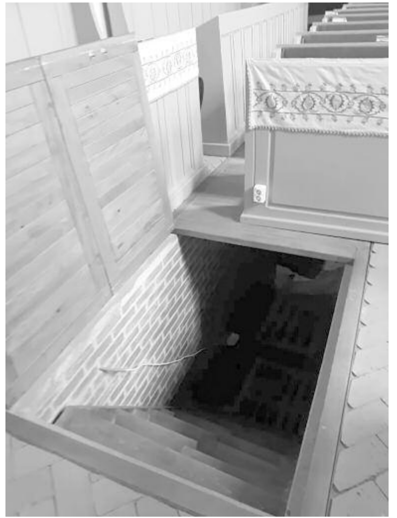
Kialakították a kriptalejárót, látogathatóvá tennék a kriptát

A templom külső felújítása még hátravan, pontosabban a toronyban volna szükség külső-belső felújításra, továbbá a toronyablakok kicserélésére, a templomhajó lemeszelésére és a villámhárító megoldására. Az épület alsó részéről leverték a vakolatot, hogy száradjanak a falak, a szakemberek majd megmondják, hogy így marad-e a fal, amit esetleg lemeszelnek. Utolsó lépésben az udvaron felbontják a betonjárdákat, helyettük térköves járófelületeket alakítanak ki, majd következik az udvar füvesítése. Mindehhez a pénzt a román államtól remélik, pá-