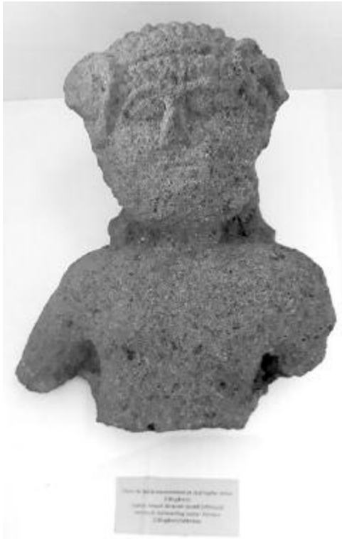
Egy Mikházán talált kettős keleti istenszobrocska adta az idei rendezvény apropóját