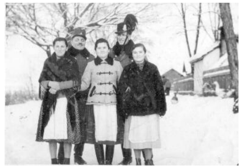
A csendőrök is emberek – makfalvi lányok társaságában

volt, főleg az egykori csendőrök leszármazottai vagy volt ismerősei részéről.