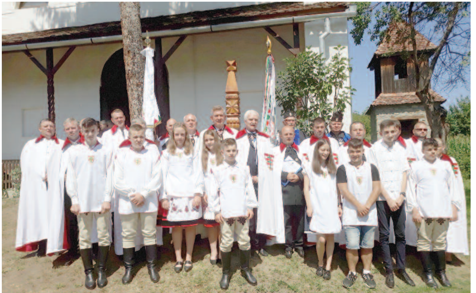
Immár tizenöt lovagja és tizenhat apródja van a rendnek Erdélyben

Az ünnepség után a rend Németországban élő főkapitánya, magyarországi törzsszéktartója és annak helyettese meglátogatták az otthont, megismerkedtek annak működésével és lakóival, munkatársaival. Az ünnepséget megelőző napon a rend vezetői és az erdélyi tartomány lovagjai tanácskozást tartottak, amelyen javaslat született, hogy a rend ezután is támogatást nyújt az abodi gyermekotthon lakóinak, illetve karácsonyi ajándékot a rend apródjainak is. Erre már most van egy összeg, amit az év végéig gyarapítani lehet.