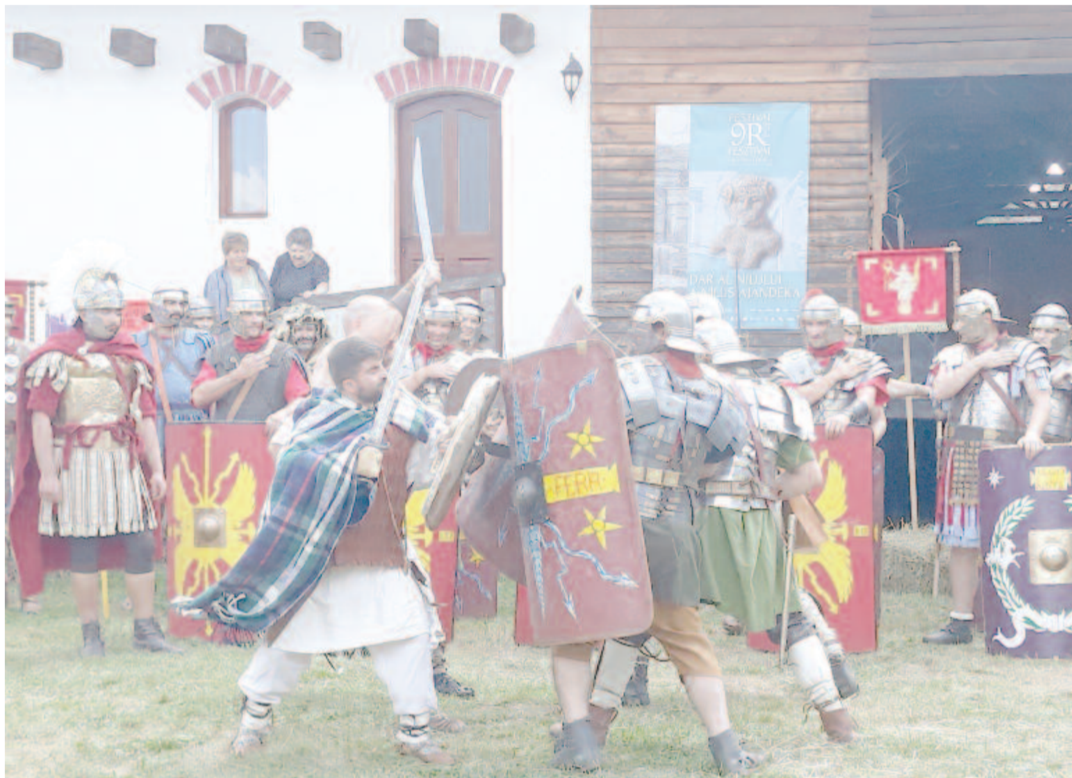
Rómaiak és barbárok csatajelenete