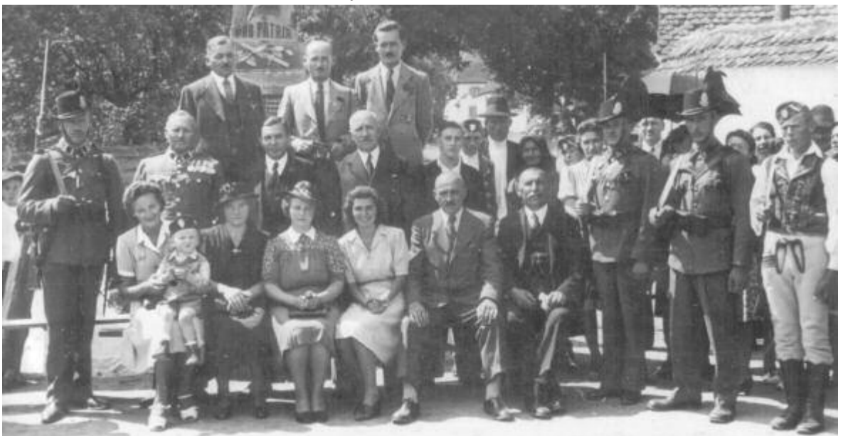
Csendőrök egy csókfalvi eseményen (1942)

fenn leírás, csak annyi derült ki belőle, hogy az illető csendőr hol szolgált. Nagyon kevés a dokumentum erről a Nemzeti Hadtörténeli Levéltárban is, ráadásul ott a járvány miatt nem is lehetett kutatómunkát végezni, csak az internetes oldalán talált kevés adatot a szerző. Így maradt a világháló, ahol még néhány forrás fellelhető. Fizetség ellenében sikerült korabeli újságok, csendőrségi havilapok, zsebkönyvek tartalmát böngésznie, és nemrég közkinccsé tették azt a hagyatékot is, amit ki tudtak menekíteni a Kanadába emigrált volt csendőrök, ahol a baráti társaságuk 1947-től havilapot adott ki. Két csendőrrel interjú készült, ezek anyaga is felhasználható volt.