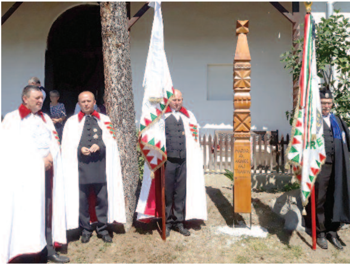
Ez alkalmából a rend a trianoni diktátumra emlékeztető kopjafát is állított

A nemzeti újakezdés eszterdejében idén Székelyabodban, az Úr megszentelt házában tartották meg a Szent László Társaság és (1861) Rend erdélyi tartományának központi rendezvényét, amelyen ünnepélyes keretek között lovagokat és apródokat avattak múlt szombaton, továbbá figyelmeztető emlékjelet hagytak a templom előtt.