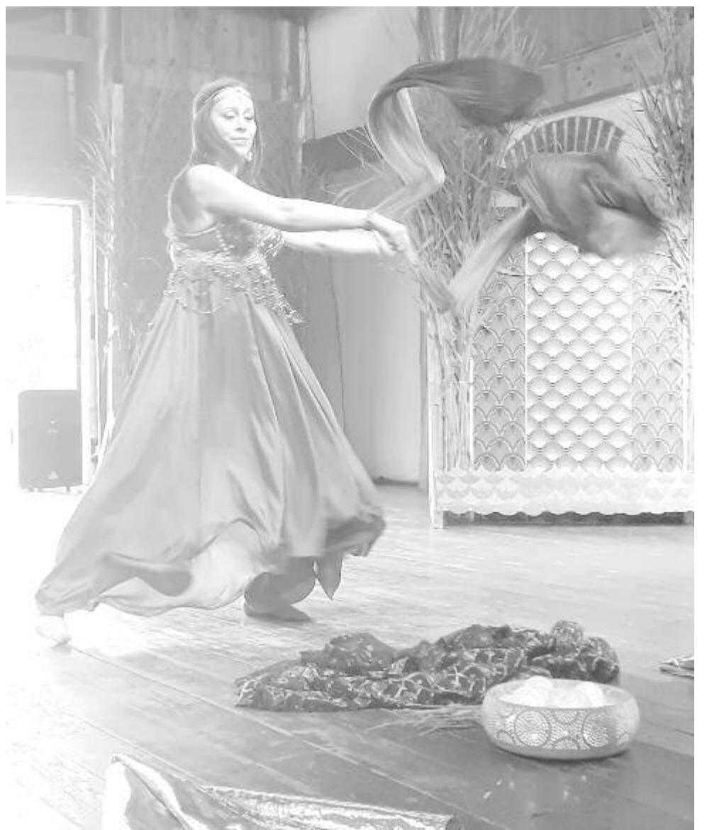
A Nilus tánca – Egyiptomhoz is kötődött az idei fesztivál