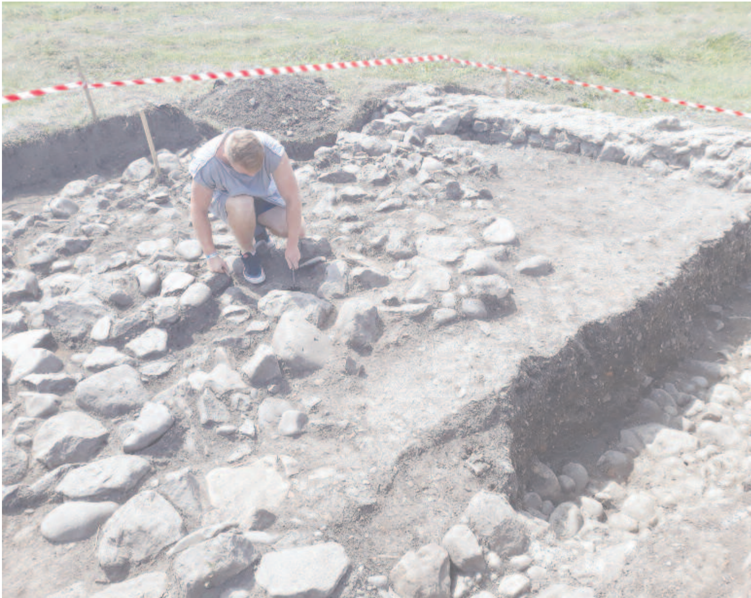
Az idén mindhárom lelőhelyen tovább vizsgálódnak