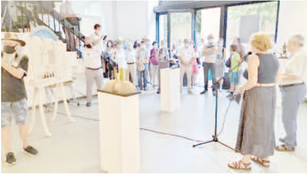
Szobrászati Szalon maszkkal ... Tárlatnyitó és közönsége