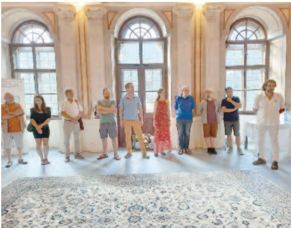
A Kastélypark Művésztelep VII alkotói a megnyitón